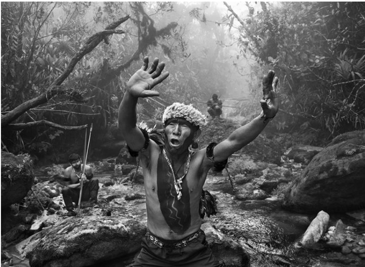
© Sebastião Salgado/Contrasto, Sciamano Yanomami dialoga con gli spiriti prima della salita al monte Pico da Neblina. Stato di Amazonas, Brasile, 2014.

In realtà è una cosa che accade, direi, abbastanza casualmente. Nel senso che, ovviamente, il mio linguaggio di espressione è un linguaggio fotografico e io provo un piacere immenso quando mi occupo di fotografia perché mi permette di esserci, con ogni mia parte. Ma, allo stesso tempo, ho anche preso coscienza del fatto che, parlando dell'Amazzonia, si tratta di uno spazio immenso che sembrerebbe quasi impossibile distruggere. E invece, tutto sommato, lo stanno facendo, lo stanno distruggendo. Ora, visto che il mio mezzo espressivo è l'immagine, voglio trasmettere questa mia enorme preoccupazione per quanto riguarda, per esempio, i problemi della vita, della coscienza, dell'ideologia, e il senso di voler proteggere questo spazio che viene distrutto. E quindi diciamo che questo passaggio, questa trasposizione fra la memoria e il messaggio da dare viene abbastanza naturalmente, nel senso che è come se la mia lingua si trasformasse in comunicazione, provando sempre un piacere immenso nel fare fotografia.