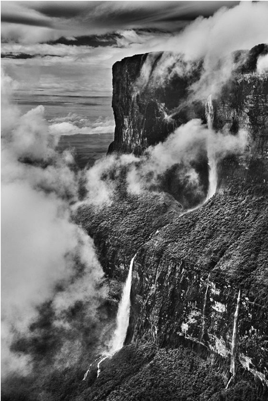
Monte Roraima. Stato del Roraima, Brasile, 2018.

Perché? Perché noi nel nostro lavoro mettiamo tutto quello che è la nostra eredità . E quindi, in quell'intervento che è lo scatto fotografico che dura una frazione di