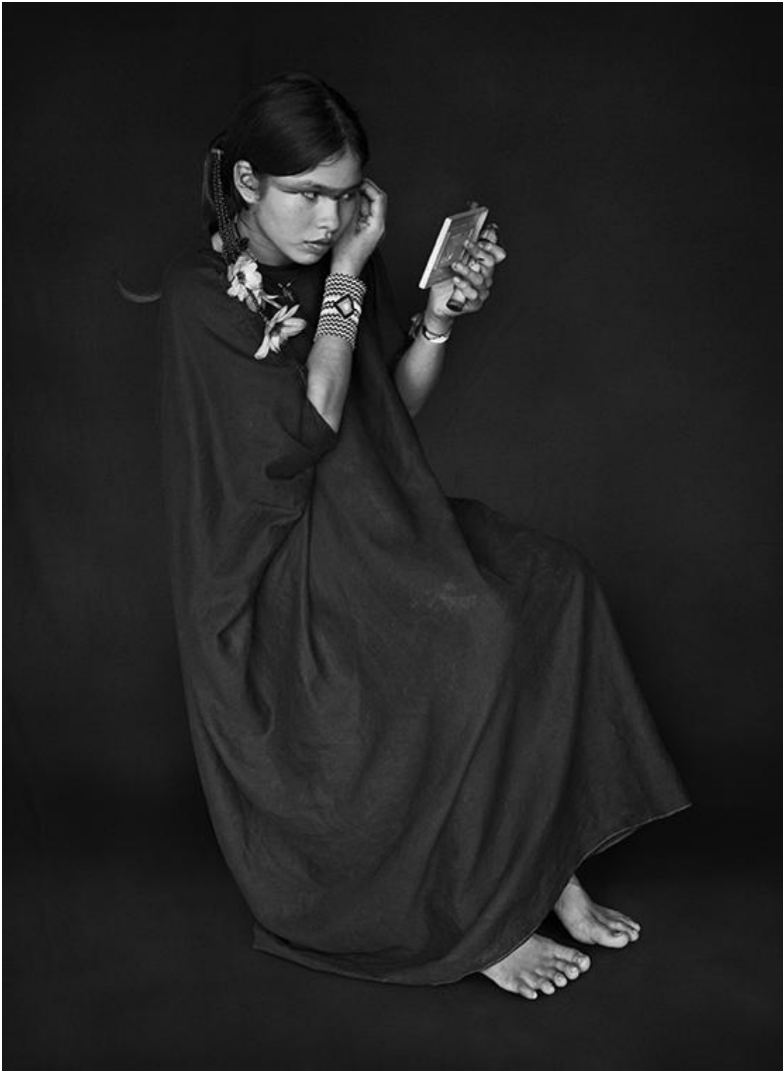
Giovane donna Ashaninka. Stato di Acre, Brasile, 2016.

Si può dire che Lei abbia uno stile, una tonalità perfettamente riconoscibili. Come è arrivato alla Sua fotografia?