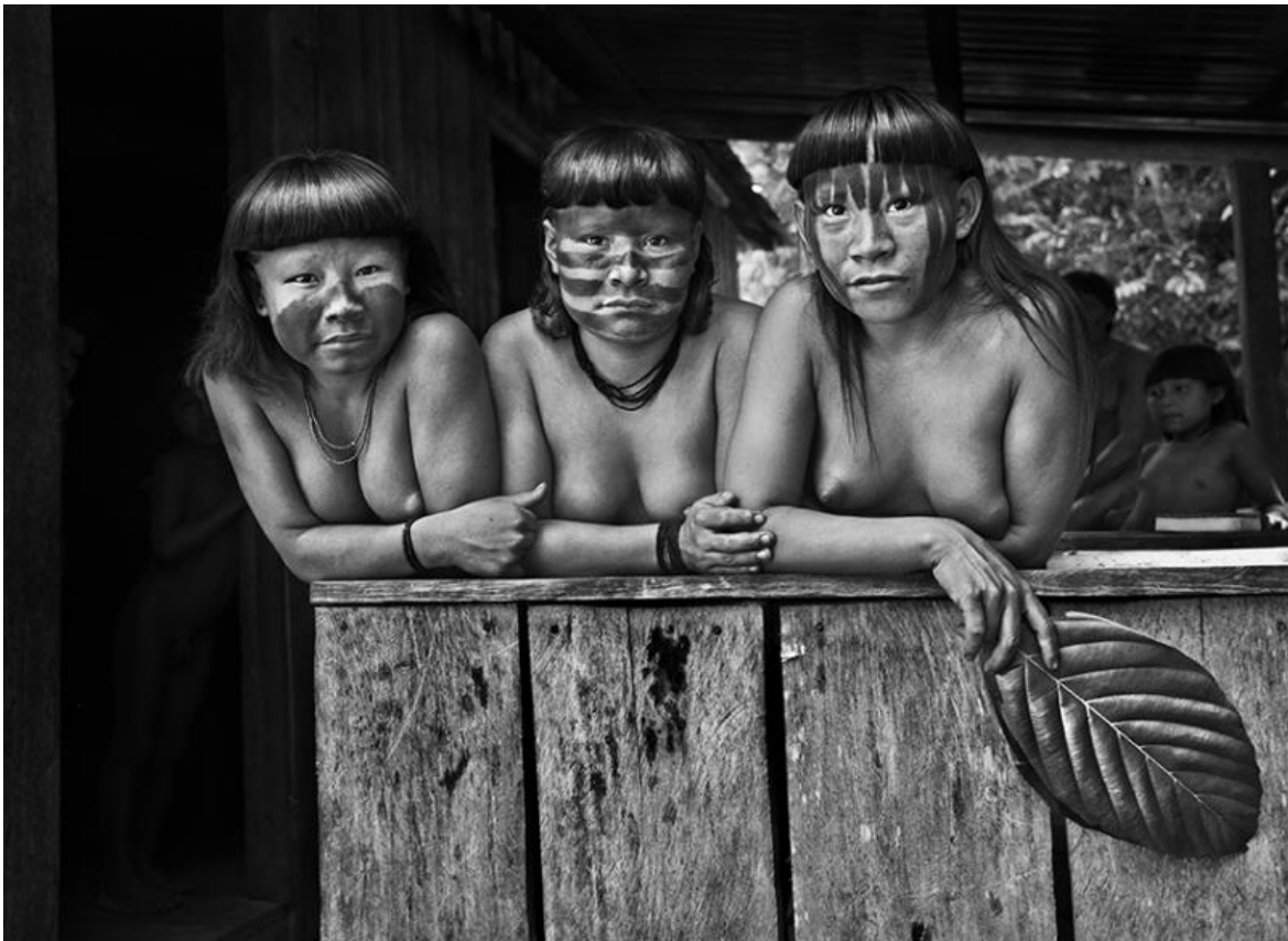
© Sebastião Salgado/Contrasto, Giovani donne Suruwahá. Stato di Amazonas, Brasile, 2017.

La maniera in cui queste popolazioni si relazionano tra di loro, gli spazi interi, tutto è fenomenale, veramente impossibile da descrivere. Ecco perché ho cercato, attraverso questa mostra, di far vedere a ciascuno, per far prendere loro coscienza, di quanto sia necessario proteggere questa zona del mondo. Perché da questa zona dipende la sopravvivenza dell'umanità. È stato recentemente scoperto e sancito e studiato anche scientificamente che l'umidità che si crea nella foresta amazzonica, le microscopiche gocce di umidità che lì si creano, vengono trasportate creando le piogge negli Stati Uniti, in Europa attraverso l'Atlantico, e nel resto dell'America. Quelli che si definiscono "fiumi volanti". Quindi, la foresta amazzonica è ciò che ci permette di avere l'agricoltura, per esempio, nei paesi circostanti, in Argentina come in Brasile, e le piogge amazzoniche sono quello che si pensa possa dare un aiuto enorme alla conservazione della biodiversità del pianeta. Quindi dobbiamo davvero tenere in considerazione che la foresta amazzonica è la nostra riserva di acqua dolce valida per tutto il pianeta. E che se l'umanità riesce a vivere e a ricostruire e a vedere questo Paradiso può conservare la salute e la bellezza di cui tutti, da sempre, hanno bisogno.