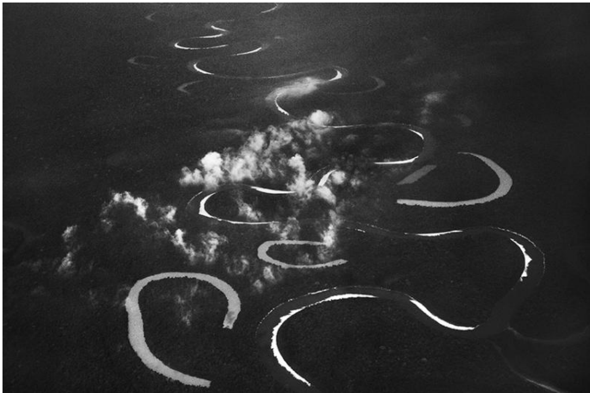
Rio Jutuí. Stato of Amazonas, Brasile, 2017.

Questo in particolare è stato il nodo della densa conversazione incontrandolo alla Fabbrica del Vapore, a Milano, dove sono allestite le più di 200 immagini che compongono la mostra Amazônia , vera ode dedicata al significato più puro che la Terra possiede.