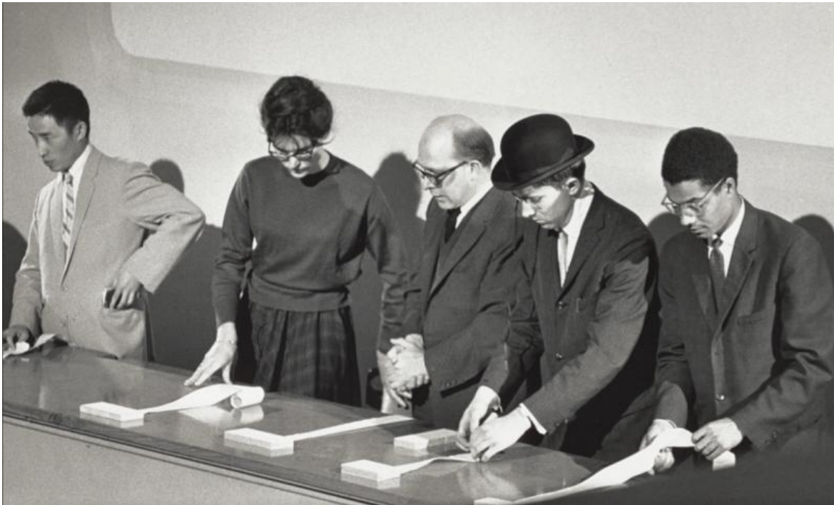
Nam June Paik, Alison Knowles, Emmett Williams, Maciunas e Benjamin Patterson eseguono In Memoriam to Adriano Olivetti, Fluxus Festival di Wiesbaden, settembre 1962.

Un modo per uscire da queste contraddizioni è accettare che in arte non sia necessario uscire dalle contraddizioni; e che anzi possa essere benefico. Nel caso di Maciunas sembra inevitabile: era un vero ossimoro vivente. Il suo libro lo conferma: benché pubblicati per rimanere, i suoi scripta di fatto volant , anzi fluunt , scorrono in ogni direzione e in ogni forma, come un vulcano in continua eruzione di iniziative concrete e utopistiche, ridicole e rigorose, commerciali e invendibili, artistiche e anti-artistiche, collettive e individualiste. Un bell'esempio della mentalità ossimorica di Maciunas sono i grafici rigorosi e analitici, da architetto razionalista, con cui si ostinava a mettere in forma un'entità inafferrabile e informe come un "flusso".