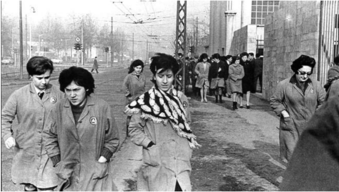
Viale Migliara, operaie della Siemens in uscita verso la mensa. Milano, 1964 © Carla Cerati.

una storia da indagare e da scrivere. Perché non è qui, con le sue compagne di prima? Che cosa o chi l'ha fatta deragliare?