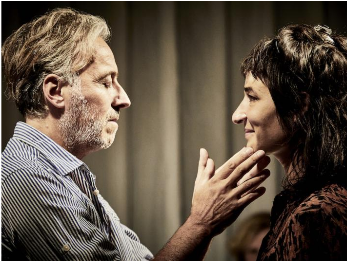
La Vie invisible