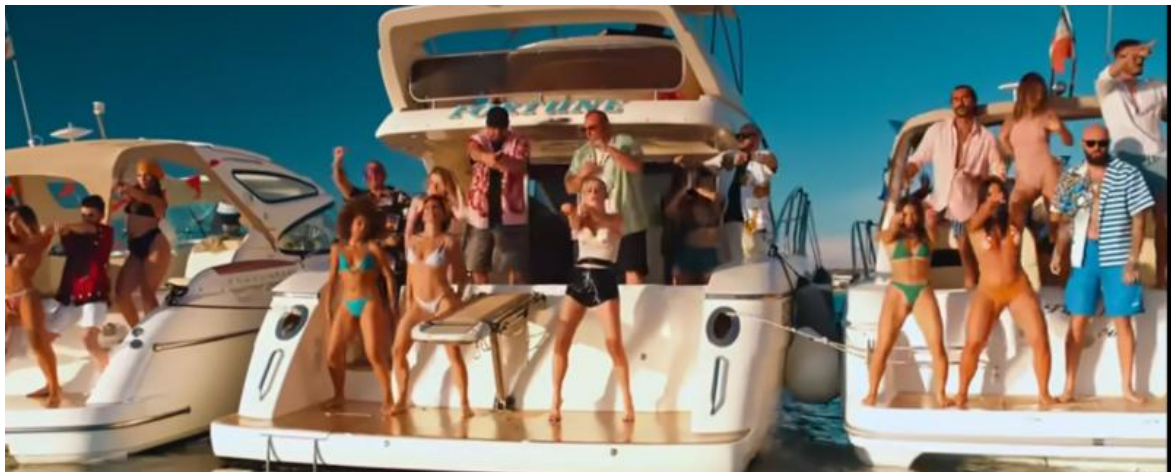
Tropicana di Annalisa e Boomdabash.

Anche i luoghi bramati per passare la stagione estiva si trasformano nel corso del tempo: Rimini e Riccione – pilastri dell’immaginario estivo del Novecento – vengono alla fine sostituite dal Salento dove insieme alla pizzica si balla il mambo con Boomdabash e Alessandra Amoroso (2019). Si registra una piccola parentesi internazionale con Roma-Bangkok (Baby K ft. Giusy Ferreri 2015), Pamplona (Fabri Fibra The Giornalisti 2017) e Malibu (Sangiovanni 2021), sebbene alla fine risulta più rassicurante il paradiso di Ostia Lido (2019), esaltato da un J-Ax in t-shirt di Putin che sfreccia sulla battigia in quad, il principale mezzo di trasporto estivo insieme alla Vespa 50 special. Qualunque siano le coordinate di questi luoghi alla fine si balla, meglio se fino all’alba. L’idea di relax all’italiana equivale alla rigida osservazione dei pattern vacanzieri. Peccato che il vero viaggio inizia quando si sono messi da parte gli obblighi da turista.