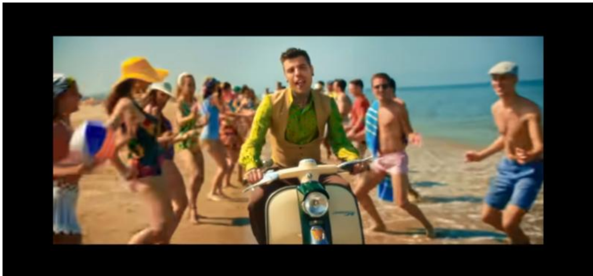
Fedez e l'estetica retrò da spiaggia.

e scappa dalla memoria. Ovviamente è una generalizzazione che funziona benissimo per chi non ha molti stimoli esterni, perché rifugiarsi nella bolla è la scelta più sicura, specialmente se si è vissuta la pandemia nel bel mezzo dell'età evolutiva. Ho provato reale disagio quando, per caso, su Instagram mi è capitato di leggere che le hit estive sono nate nel 2015 con Maria Salvador di J-Ax - rapper onnipresente nelle hit estive da solo o in compagnia di Fedez - feat. IL CILE. Come se per l'intero secolo precedente nessuno avesse mai pubblicato musica d'estate. Come se un signore chiamato Ricky Martin non fosse mai esistito. Il nodo gordiano sta nella costruzione di questi testi-tormentoni che, oltre a martoriare chi ha una cultura musicale variegata, obnubilano la coscienza ingenua e ineducata di una generazione. Ciò che si può riconoscere al mercato musicale italiano è che dal 2015 a oggi le hit italiane sono state costruite con criteri solidi e perlopiù invariati, cantate da uno "zoccolo duro" di artisti uomini, supportati dalle "donne" del momento, spesso e volentieri travestite nei video secondo i diktat di una sensualità a buon mercato, a tratti persino tenera per quanto naïf.