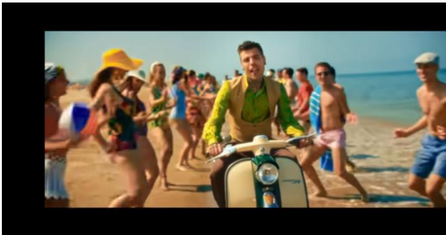
Fedez e l'estetica retrò da spiaggia.

Ho provato a confrontare i pezzi estivi di fine Novecento con quelli preferiti dalla generazione Z e i risultati sono sorprendenti per l'alto tasso di banalità, maschilismo e condensazione di citazioni piacione alle canzonette degli anni '60. In buona sostanza queste persone trascorrono l'estate rilassandosi con alcool e sostanze stupefacenti, passando la maggior parte delle notti a ballare dopo aver spento il telefonino e provato a scappare con qualcuno. È un esito tanto evidente quanto condiviso dal senso comune che per aggiungere un tasso di difficoltà analitica mi prefiggo di passare in rassegna il dress code della hit estiva attraverso testi e videoclip.