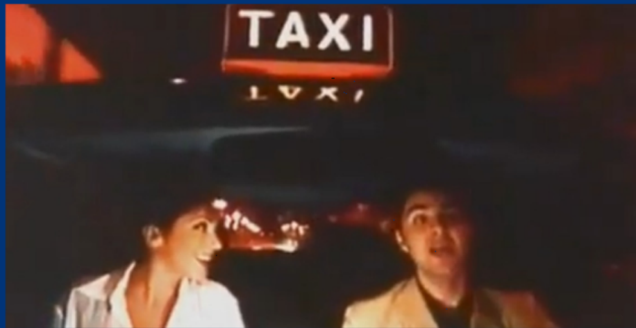
Sabrina Salerno interpreta il "Mito" in Jolly Blu (1998), il film degli 883.

Questi "noi" manifestano il loro rinnovato e infinito poter fare con pratiche da milionari alternate a liste di marchi di lusso che connotano attività di product placement legittime oppure occulte. Nominare brand o citare serie tv, film o cartoni animati sono scelte "furbe" per favorire il processo di identificazione nella canzone in modo da farla diventare la colonna sonora elettiva per quell'anno. Dagli anni Novanta ai Duemila l'idea di "festa" cambia, dall'esaltazione del mare, dei corpi scoperti, e delle relazioni fugaci, ma indimenticabili, si passa all'apologia dei sensi alterati da droga e alcool che uniti alla musica "danno la carica, corroborano il corpo e lo spirito" ( Marrone 2005 ). Se soldi e nuova posizione sociale rispecchiano il poter fare, droga, alcool e musica servono a giustificare il voler fare dei protagonisti delle storie raccontate dalle hit estive, sostanziando il sistema di valori da far circolare.