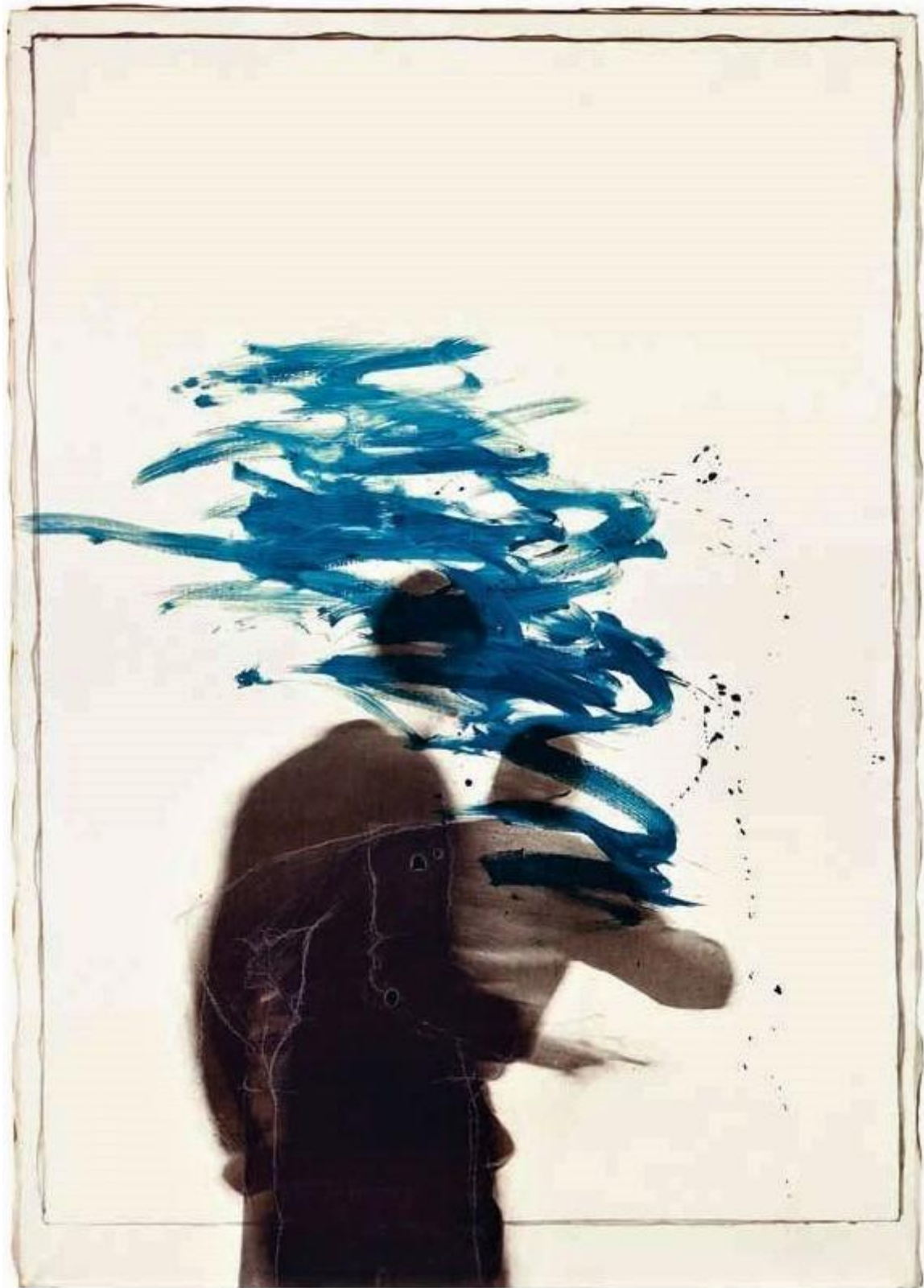
Giulio Paolini, Giulio Paolini, Académie 3, 1965

L'uso della fotografia è determinante anche per Michelangelo Pistoletto, che a partire dal 1962 utilizza fotografie riprodotte manualmente su sottili veline applicate su acciaio inox lucidato (un metodo poi abbandonato a favore della serigrafia). La sua è un'indagine intorno alla dinamica figurativa e temporale delle superfici specchianti, grandi lastre sensibili che creano sulla loro superficie infiniti