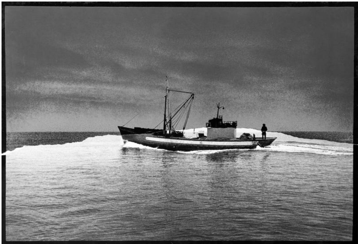
Mimmo Jodice, Il viaggio di Ulisse, 1969 (dal manifesto per la mostra di Jannis Kounellis alla galleria Lucio Amelio, Napoli 1969)

ricordo nei prossimi giorni). A questo artista poliedrico la mostra giustamente restituisce il ruolo di sperimentatore precoce e innovativo delle possibilità del medium fotografico e cinematografico, espanso alle dimensioni della pittura, come in Mare firmato , una tela emulsionata datata in catalogo al 1965 ma più verosimilmente realizzata l'anno successivo. Al centro della poetica di Patella vi sono la manipolazione e la diffrazione dell'immagine e delle sue potenzialità compositive, cromatiche e ritmiche, declinate in procedimenti originali utilizzati tanto nelle tele che nei suoi film d'artista (come Terra animata , 1967, e il noto SKMP2 del 1968). In parallelo, una nuova generazione di fotografi (Claudio Abate, Elisabetta Catalano, Mario Cresci, Mimmo Jodice, Ugo Mulas, Paolo Mussat Sartor) trasforma negli stessi anni il tradizionale ruolo di documentazione in vera e propria collaborazione creativa, consentendo anche agli artisti meno interessati alla manipolazione diretta del medium – i casi, tra gli altri, di Jannis Kounellis, Giuseppe Penone e Giovanni Anselmo sono in questo senso esemplari –, di elaborare una innovativa strategia per la creazione (e diffusione) di immagini.