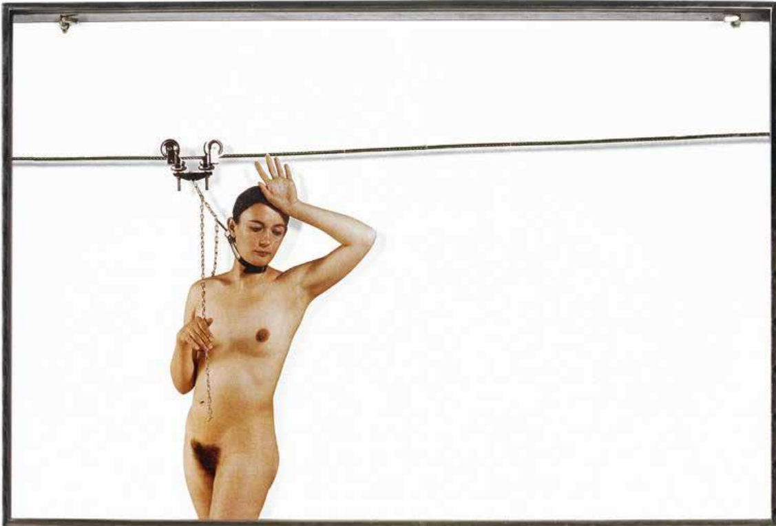
Vettor Pisani, Lo scorrevole (elevazione della Vergine) , 1972

cortocircuiti tra l'Adesso, cangiante e imprevedibile, dello spettatore che vi si riflette insieme all'ambiente circostante e l'enigmatico istante eternato nelle immagini fotografiche, "specchi dotati di memoria", come recita una definizione famosa.