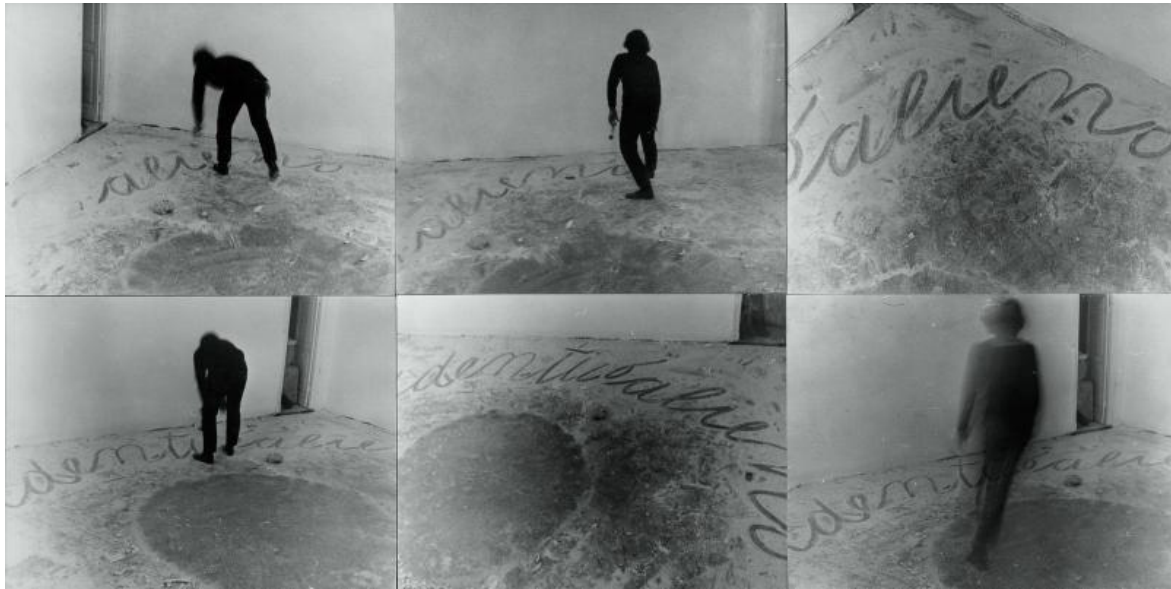
Emilio Prini, Identico alieno , 1967-68