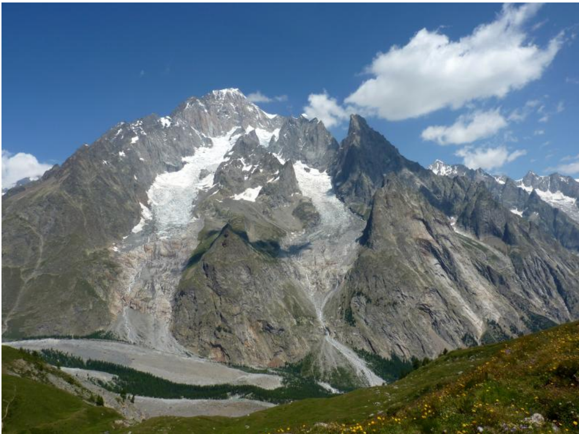
Massiccio del Monte Bianco