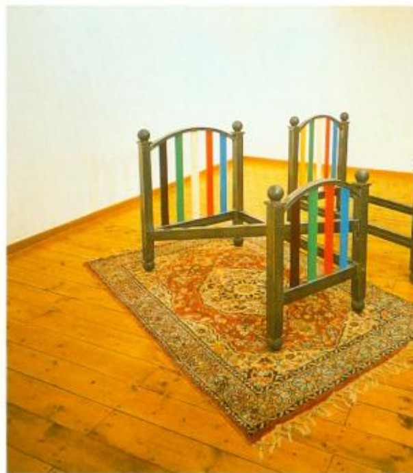
Luca Maria Patella, Letti (The wrong & right), 1990. Materiali vari.

Negli ultimi anni era davvero chiuso in casa, soprattutto a partire da una caduta che gli aveva causato disturbi permanenti a una gamba. E allora lavorava e lavorava, forse anche di più di prima, visto che non aveva più distrazioni. Stava finendo un nuovo libro che spero esca e non passi nel reparto delle attese. Per quanto chiuso in casa, era comunque di una disponibilità assoluta, ha moltiplicato le sue comparse, approfittando della tecnologia, con registrazioni (d'artista, of course) o collegamenti in diretta. Voleva farsi sentire, soprattutto alle ultime generazioni, sicuro che fossero più curiose e interessate.