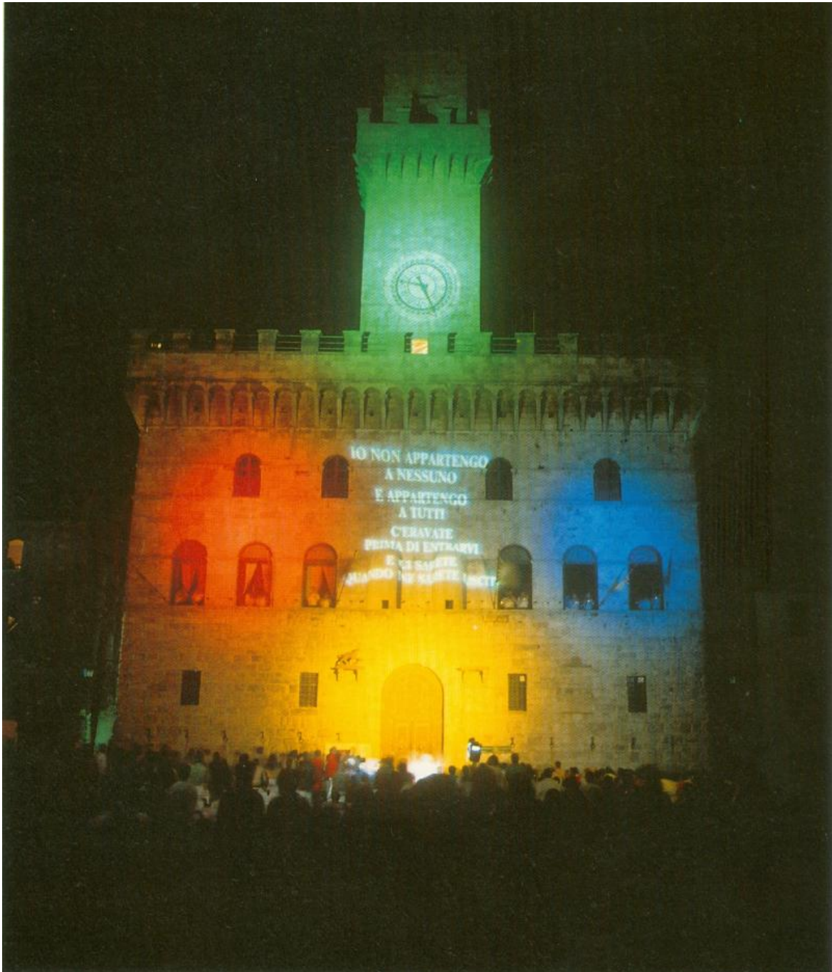
Luca Maria Patella, Omaggio a Diderot , 1983. Proiezione sulla facciata del Palazzo Comunale di Montepulciano.

Non ha mai fatto parte di gruppi, e questo l'ha pagato, tanto più che era intransigente nei discorsi e severo nel denunciare. Ma è stato all'inizio di tante situazioni che poi sono diventate gruppi. (È la storia di diversi artisti importanti in Italia e non solo.)