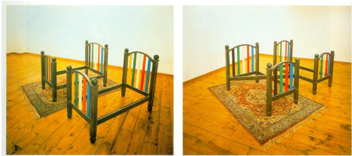
Luca Maria Patella, Letti (The wrong & right) , 1990. Materiali vari.

che proiettò sul Palazzo Comunale di Montepulciano (1983).