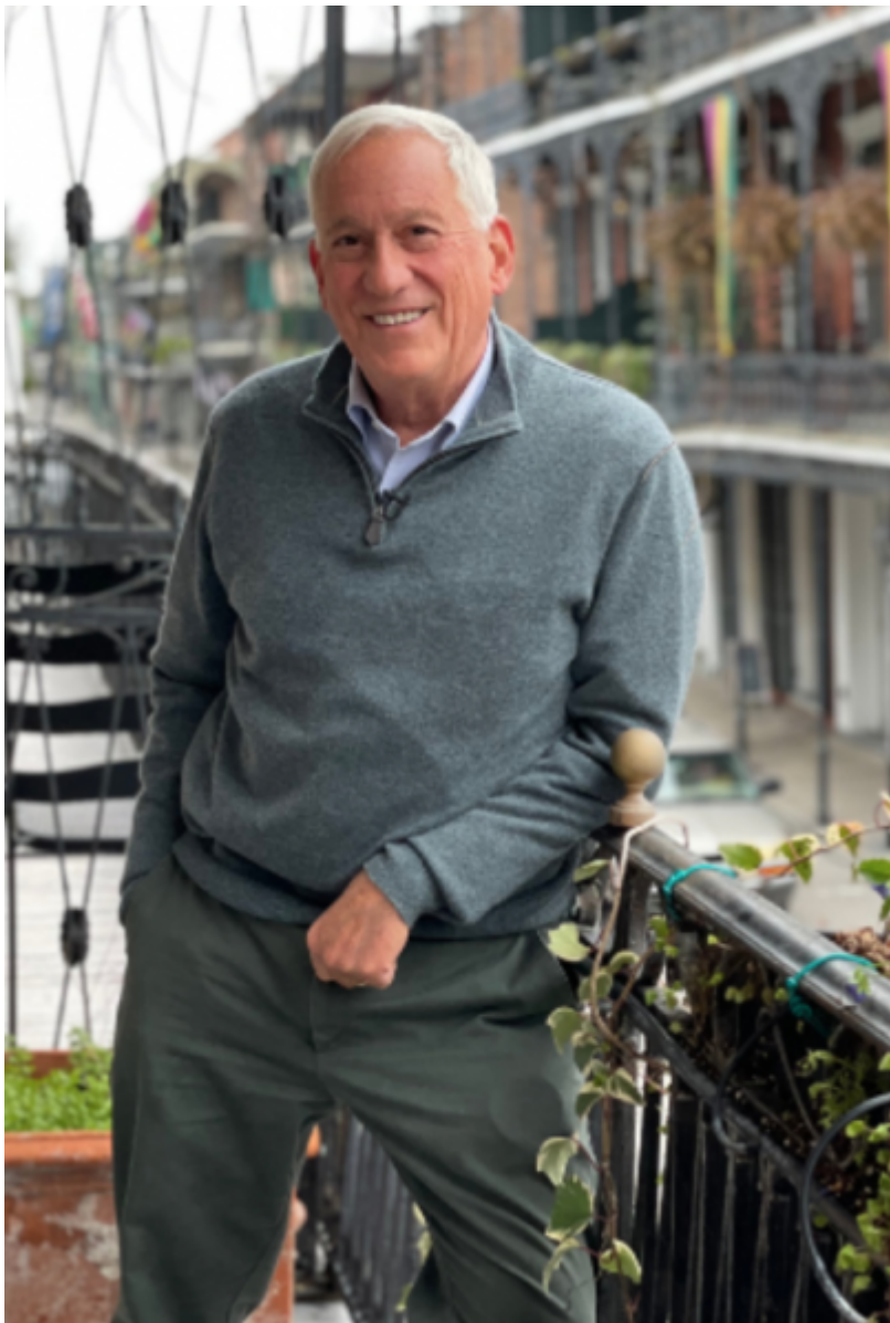
Elon Musk di Walter Isaacson