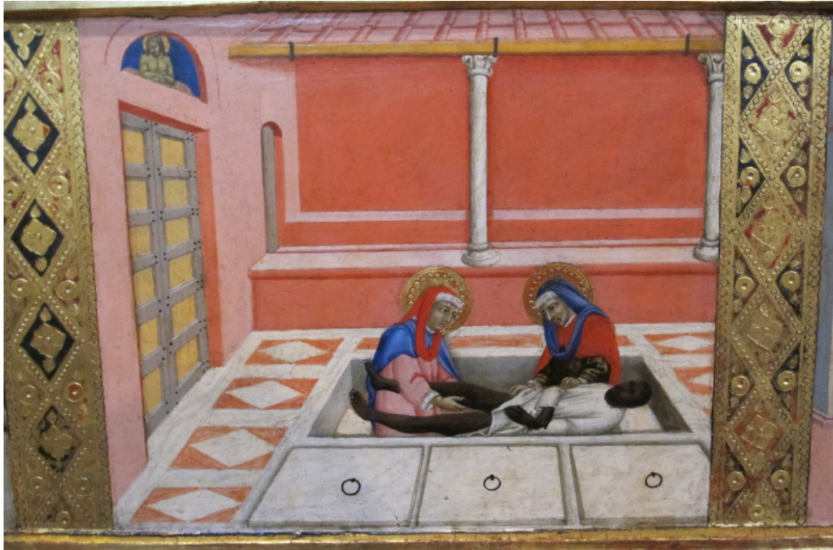
Sano di Pietro, I santi Cosma e Damiano tagliano la gamba all'etiope (1444), Pinacoteca Nazionale di Siena.

Da questo assunto prende le mosse il libro di Sara Benaglia, Note ai margini della storia dell'arte (PostmediaBooks, 2023), che alle figure che declinano la categoria dell'Altro in senso etnico e culturale aggiunge anche l'Altro per antonomasia, il polo di genere, la donna. Certamente non un soggetto messo ai margini delle rappresentazioni, anzi vero e proprio protagonista dell'arte figurativa fin dalle origini, ma solo in quanto oggetto per lo più passivo plasmato dallo sguardo maschile.