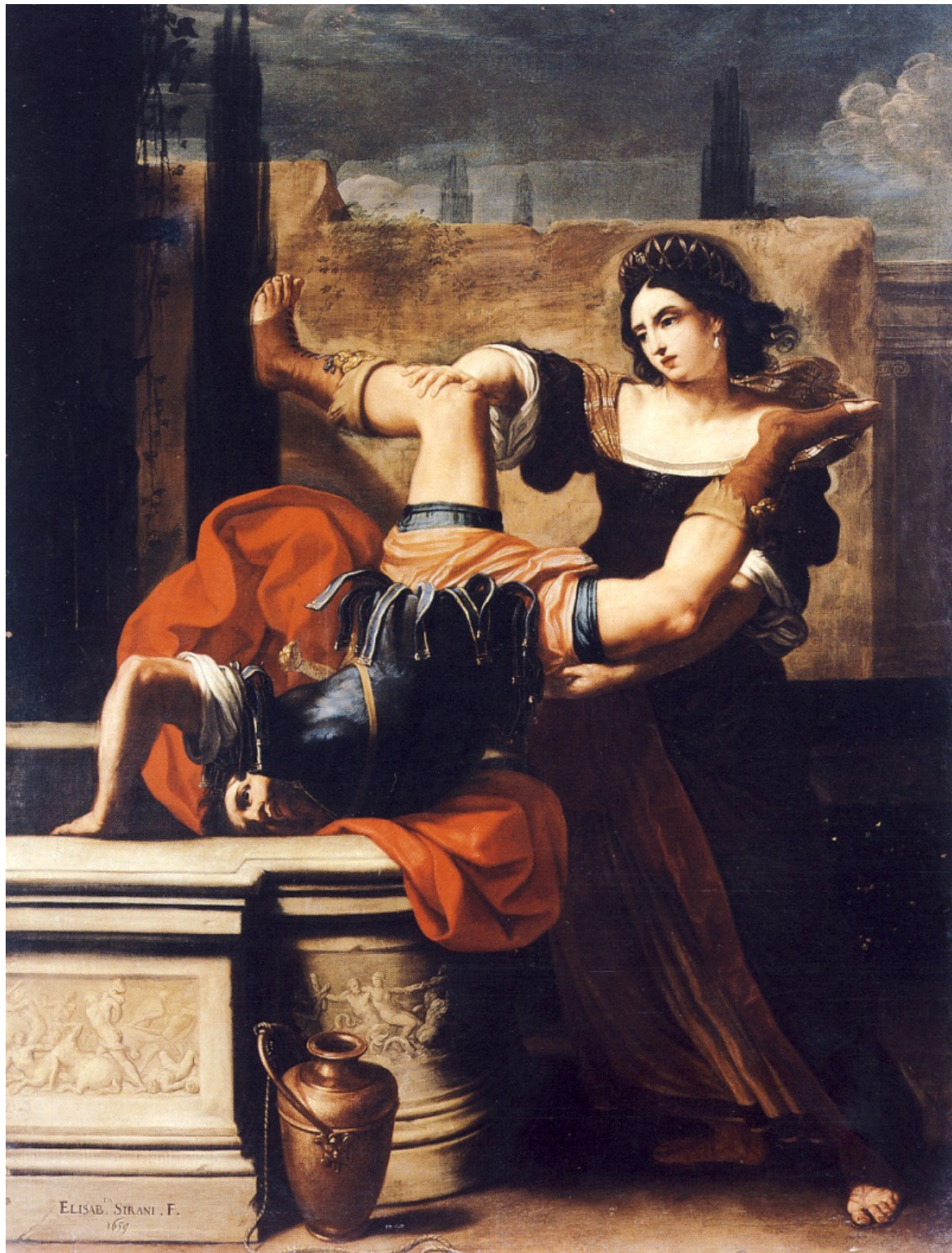
Elisabetta Sirani, Timoclea precipita nel pozzo il capitano di Alessandro (1659), Museo di Capodimonte, Napoli.

«La filosofia estetica – scrive ancora Benaglia –, sin dalla sua apparizione alla fine dell’Illuminismo, ha funzionato come un discorso regolativo dell’umano, in cui risiedono le moderne concezioni dell’ordine politico, razziale e sessuale”. [...] È importante dare spazio nel contesto italico al modo in cui l’arte classica e il giudizio estetico siano connessi a economie razziali, e a come l’estetica di questo specifico contesto e periodo storico abbiano fatto nascere un “regime di