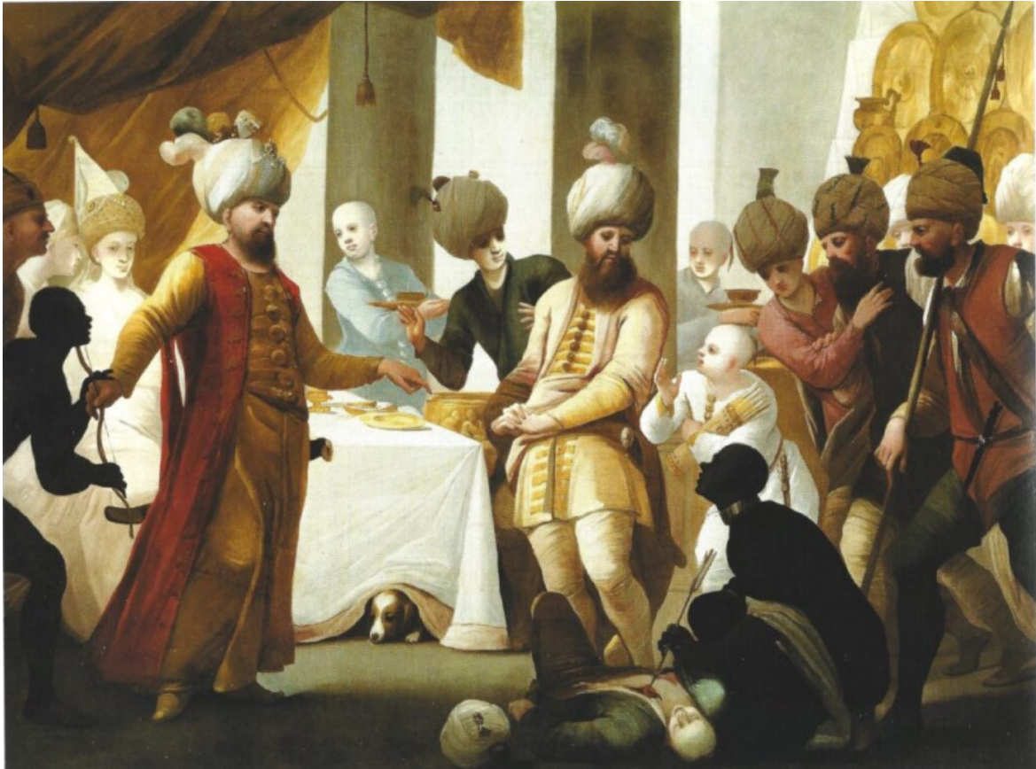
Antonio Cifrondi, L'ebbrezza di Cambise Cambise ebbro uccide il figlio del suo ministro Pressaspe (1690 ca.), Collezione Intesa Sanpaolo.