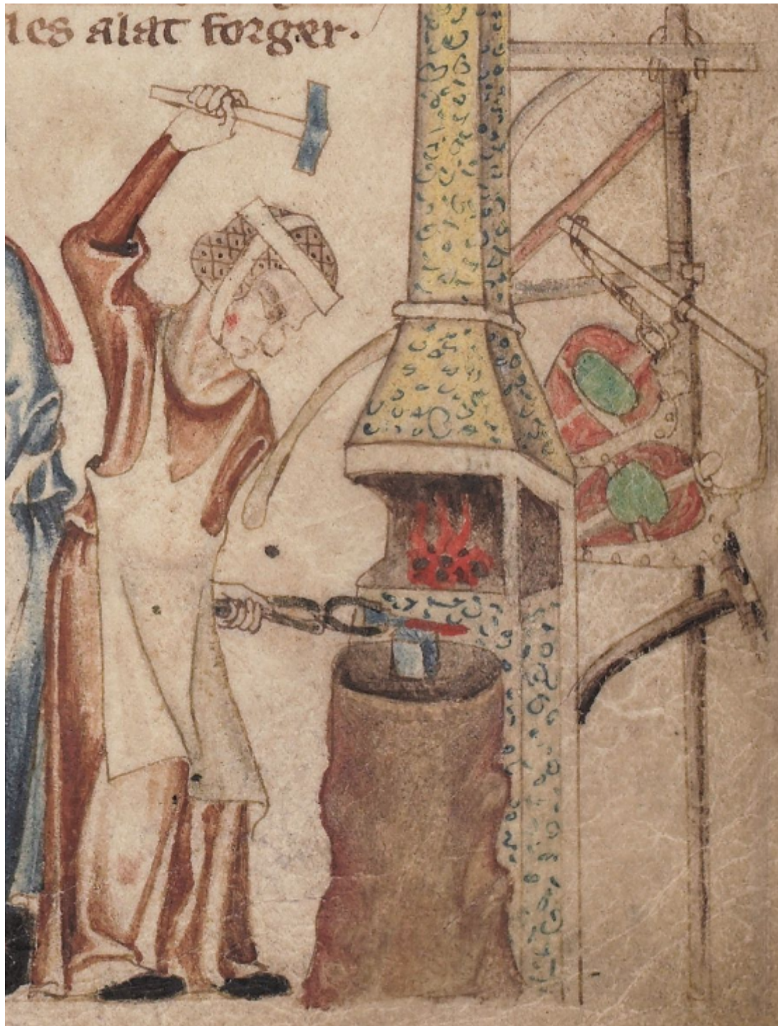
La moglie del fabbro ritratta nella Bibbia di Holkham (1327- 1335 ca.), London, British Library, Add Ms 47682, fol. 31.