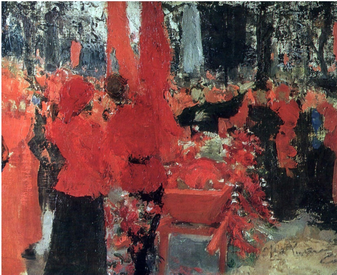
I. Repin, Funerali rossi, 1905-06.

Se, come ha ricostruito Richard Wortman in Scenarios of Power , studio dedicato a miti e cerimonie dell'età zarista, Pietro il Grande nel codificare e introdurre rituali e solennità aveva guardato alle tradizioni delle case regnanti in Francia, Germania e Svezia, la Russia rivoluzionaria prima e lo Stato sovietico poi si sono rivolti alle esperienze del movimento operaio internazionale e agli eventi considerati predecessori dell'assalto al cielo del 1917, come la rivoluzione francese. Vi era stato un anticipo importante, evidenziato da Piretto, nella definizione di cosa doveva essere un funerale socialista: la processione funebre di Nikolaj Bauman, leader dei bolscevichi moscoviti nella rivoluzione del 1905, assassinato il 18 ottobre nei tumulti scoppiati dopo la proclamazione del manifesto del giorno prima in cui Nicola II aveva concesso le libertà civili (salvo poi decurtarle successivamente) e promesso la convocazione della Duma. Il corteo si era trasformato in una vera e propria manifestazione, e stabilì la formazione delle prime componenti essenziali del nuovo spettacolo luttuoso, la bandiera rossa e la musica, in questo caso Vy žertvoju pali , canzone diventata popolare negli ambienti populistici negli anni Settanta dell'Ottocento e diventata inno di almeno tre generazioni di rivoluzionari.