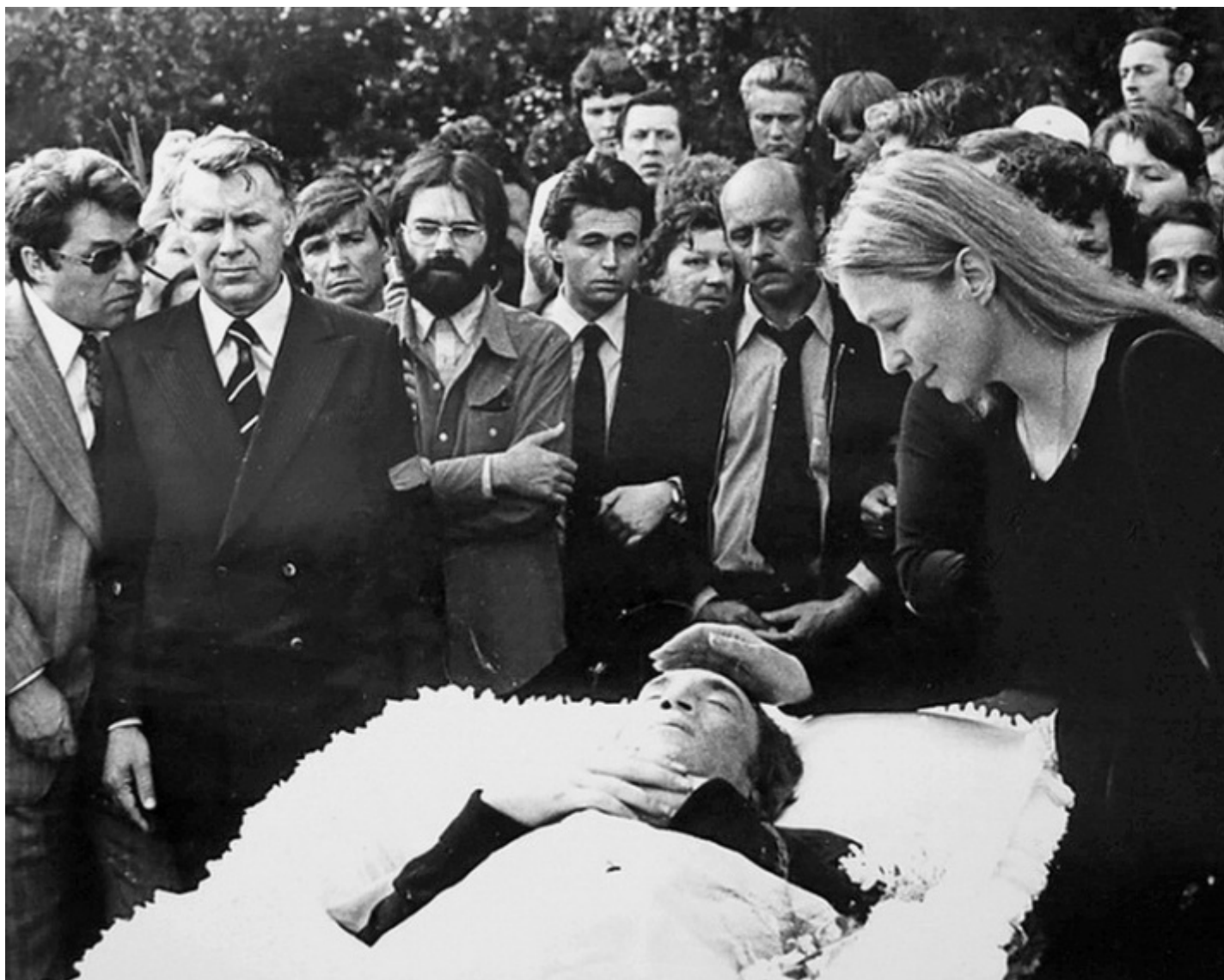
Marina Vlady accanto al feretro del marito Vladimir Vysokij, 1980.

Gian Piero Piretto aggiunge un tassello fondamentale alla sua ricerca ormai ultradecennale attorno alle espressioni culturali e del quotidiano nelle società sovietica e russa, e lo fa con un'opera fondamentale per comprendere la necessità di guardare ai riti come parte essenziale nella costituzione di leggende e della legittimazione politica. Un lavoro utile anche per comprendere e riflettere meglio sul rapporto tra la nostra contemporaneità e la morte.