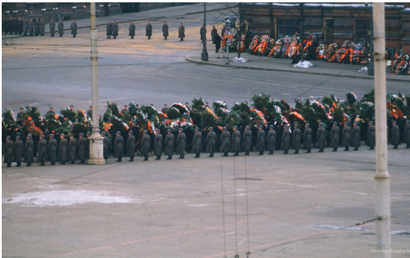
Le centinaia di corone di fiori per Stalin, 1953.

L'ottimismo di inizio anni Sessanta si accompagnava anche a una crescente ricerca d'autonomia dai circuiti ufficiali, a malapena tollerata durante la prima parte del decennio ma poi perseguita come violazione della legalità socialista in seguito, anche se, come ricordato da Anna Achmatova, le repressioni avevano assunto forme "vegetariane" in confronto a quanto avvenuto durante il Terrore. Proprio il funerale della grande poeta (odiava essere declinata al femminile) viene presentato in maniera convincente come la fine di questo periodo, con l'organizzazione delle esequie divisa tra due personaggi molto diversi, Iosif Brodskij e Lev Gumilëv, figlio dell'Achmatova con cui ebbe sempre un rapporto conflittuale.