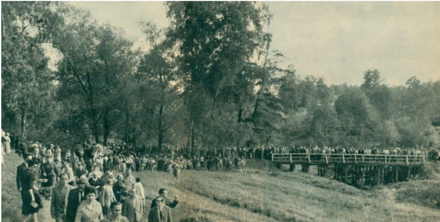
La processione funebre per Pasternak, 1960.