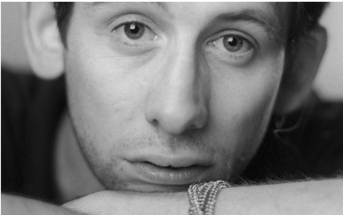
Shane McGowan.

Shane MacGowan, il cantante dei Pogues, uno dei tanti poeti d'Irlanda, ci ha lasciati da poco. Shane era un ragazzo difficile fin dagli anni '70, a beautiful and damaged man , ha scritto Nick Cave in un toccante ricordo subito dopo la sua morte, un uomo bello e rovinato , rovinato nel senso di ferito . Un uomo di una generosità e di una bontà che cozzavano con la sua immagine di ubriaccone cronico, la faccia sghemba, perennemente stralunata, i denti guasti, troppo alcool e eroina. Ma un poeta, appunto, uno, citando sempre Nick Cave, con un profondo senso di ciò è vero, qualcosa che ne amplificava la fragilità e l'umanità . Quella canzone, che trentacinque anni dopo la sua composizione si è ormai guadagnata lo statuto di canzone di Natale fra le più amate al mondo, è stata cantata in chiesa , il giorno del funerale di Shane MacGowan, da Glen Hansard, dalla splendida Lisa O'Neill, una delle più pregnanti voci dell'Irlanda canora di oggi, e dai vecchi amici dei Pogues con un carico di emozione e con quel senso di festa collettiva che soltanto gli irlandesi riescono a creare. E poi sì, non li hanno censurati, in chiesa, quei famigerati versi: