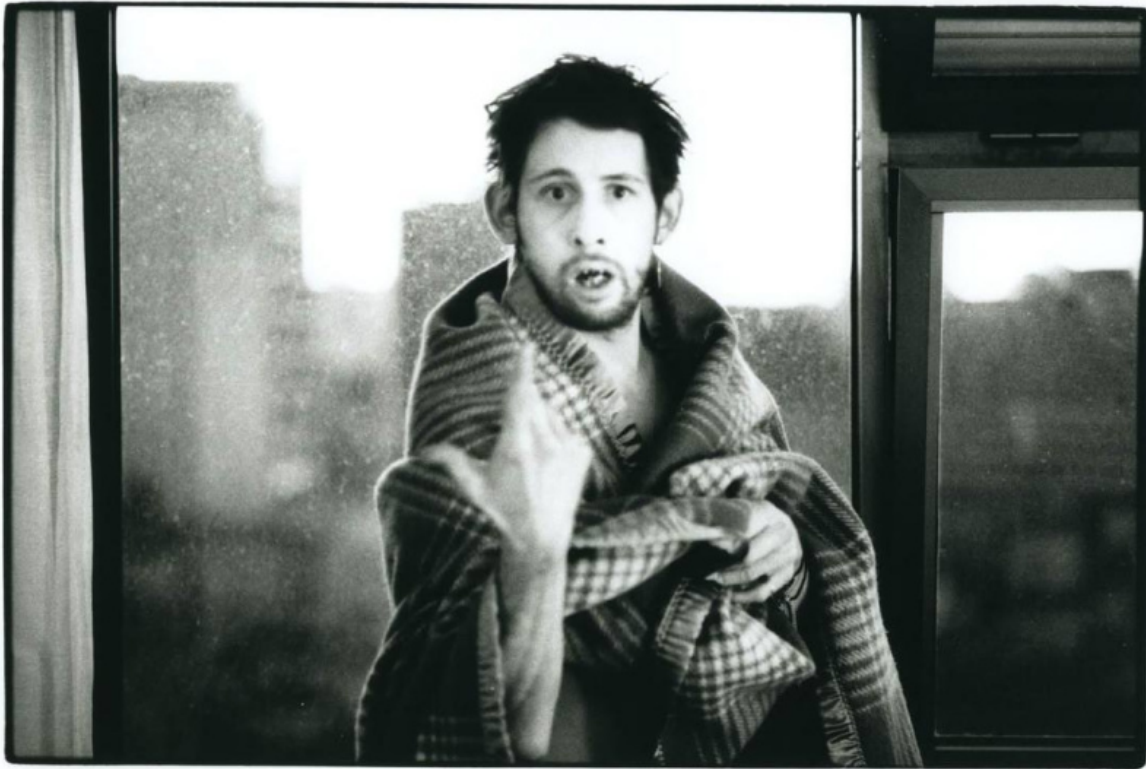
Shane McGowan.

con una parodia in cui i ruoli vengono invertiti, mettendo un secondo lui nei panni di lei e una seconda lei nei panni di lui (un'inversione di ruoli che in verità risulta a sua volta problematica, a prescindere dall'intento comico, laddove lei è presentata come una predatrice e lui nei panni di un tontolone, se non proprio, con sovraccarico di pregiudizio, di travestito, non fosse che per sbadataggine).