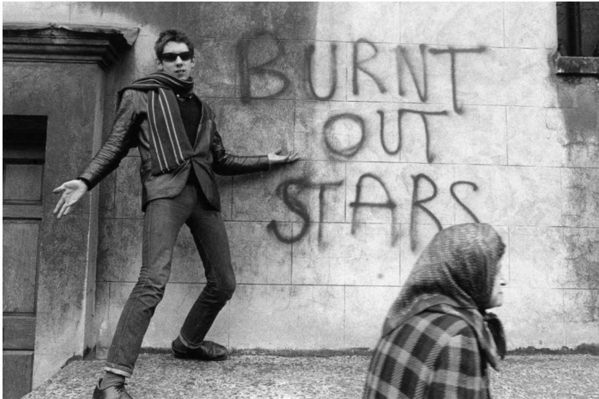
Shane McGowan.

Le canzoni di Natale che di primo acchito paiono c'entrare poco col Natale, fuliginose come se avessero visto la luce nella canna fumaria di un camino dove Babbo Natale non si avventura, formano un canone a sé. La loro particolarità non consiste tanto nel fatto che non si richiamano a slitte, renne e stelle filanti, quanto al fatto che affrontano il Natale con i piedi ben piantati per terra. Impongono un che di realistico al regno fantastico delle canzoni di Natale che tutti abbiamo imparato ad amare. Un esempio fra i più poderosi è Christmas card from a hooker in Minneapolis di Tom Waits (sì, le prostitute scrivono delle lettere di Natale), ma anche l'antesignana Blue Xmas (to whom it may concern) di Miles Davis (canta Bob Donough; il sax è di Wayne Shorter), che già a inizio anni '60 affrontava il tema del Natale consumistico.