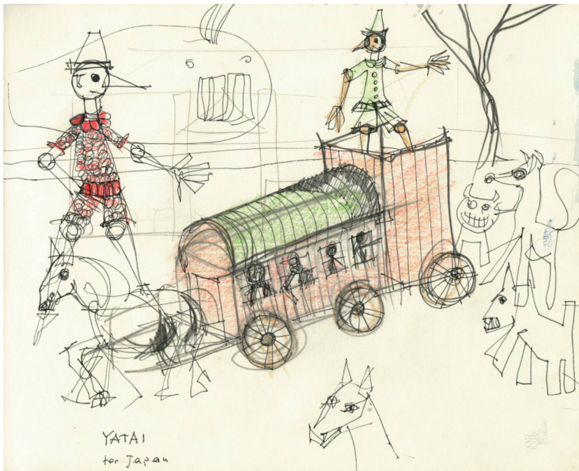
© Eredi Aldo Rossi, courtesy Fondazione Aldo Rossi.

Pinocchio è un eroe della fame. Figlio di un paese sempre affamato, come era l'Italia alla fine del XIX secolo, e ancora all'inizio del XX, Pinocchio è sempre alla ricerca di cibo. La sua non è solo la fame dello stomaco. Si tratta della fame dell'infanzia, qualcosa che ha a che fare con la natura animale che alberga nei bambini. Come fa un essere vegetale - Pinocchio-Pinolo - ad avere una fame animalesca? Perché è anche un asinello, come si scopre a un certo punto. Indossando i panni dell'infanzia, lui che è senza età, essendo nato dal nulla, formato da Geppetto, suo magico artefice, s'impadronisce della fame infantile, quella che sorge improvvisa, senza preavviso, che spinge il bambino, prima buono e tranquillo, a strillare e piangere di colpo: voglio mangiare! Lo stimolo è in lui così potente e imperioso che nulla può opporsi al suo soddisfacimento.