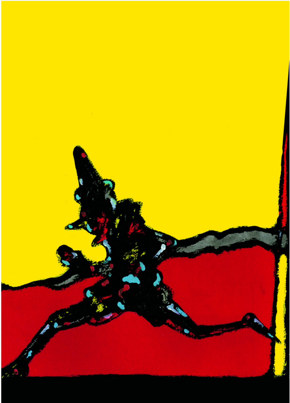
© Eredi Aldo Rossi, courtesy Fondazione Aldo Rossi, 172 x 123 Collodi, Le avventure di Pinocchio: Storia di un Burattino , NUAGES, Milano, 2006, Illustrazioni di Andrea Rauch

Pinocchio è un pezzo di legno; meglio, il seme di un albero, un “pinolo”. Secondo il Tommaseo-Bellini, imprescindibile dizionario, si tratta appunto di un “seme del pino chiuso in un guscio, o nocciolo, detto parimenti Pinocchio, fin che ha in sé il pinocchio”. Così asserisce Ferdinando Tempesti, uno dei migliori, se non il