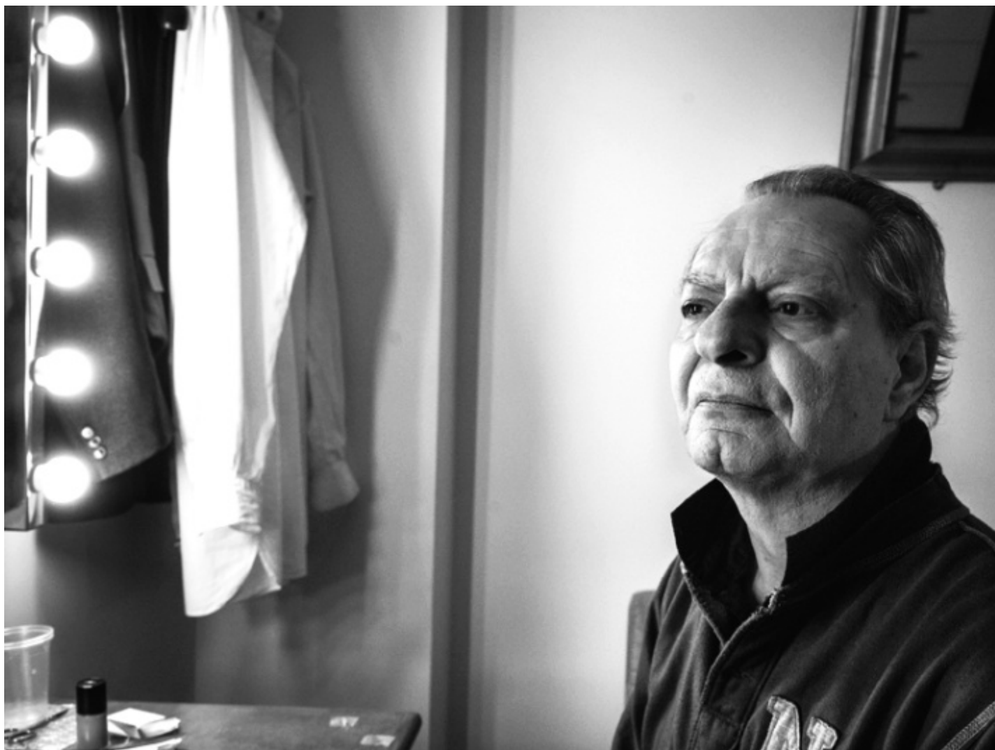
Bordelli di mare con città, Ph. di Daniele Capalbo

Un puro atto di amore e di resistenza a quell'omologazione che Enzo rifuggiva come la morte, preferendo invece sempre essere in ascolto dell'altro da sé, accoglierlo, farsi contaminare. In e da tutte le lingue possibili. Latino, Greco antico, inglese, francese, una Lingua Napoletana quasi scomparsa, che è materica, corposa e al contempo lirica, soave. Il suo corpo in scena un geroglifico incarnato. Lingua, carne, soffio , come recitava il titolo di un suo spettacolo dedicato ad Antonin Artaud, realizzato nel festival di Santarcangelo diretto da Leo de Berardinis.