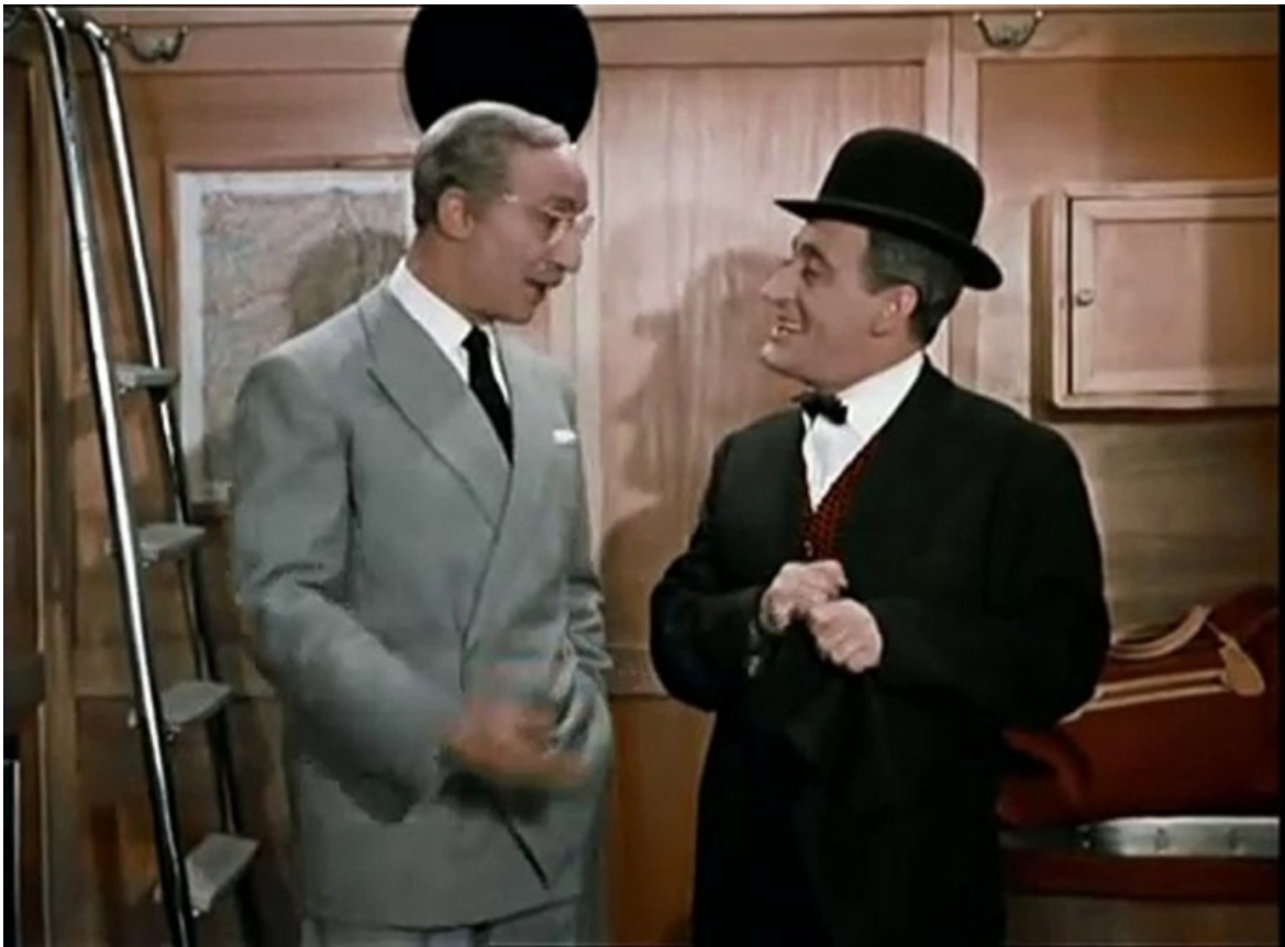
Sketch Totò e l'onorevole.

una stagione, ne bastano pochi sui quali valga la pena di concentrarsi". Lo stesso numero della rivista ospitava un dibattito incandescente sulla Carmen di Bizet da lui messa in scena al Comunale di Bologna, spettacolo sonoramente fischiato da un pubblico che non aveva apprezzato il Don Josè in costume da Uomo mascherato, Escamillo come Batman e Micaela in un succinto impermeabile bianco. Penso che anch'io avrei considerato quei travestimenti banali e riduttivi anziché, come forse il regista si proponeva, utilmente provocatori, ma tutto ciò testimonia di una cultura teatrale sontuosa e vivace, ricca di presenze e di nuove proposte (c'erano anche Carmelo Bene, Leo de Berardinis, Carlo Cecchi, Remondi e Caporossi e tanti altri, in tutt'Italia, persino sul fronte dei teatri pubblici e privati).