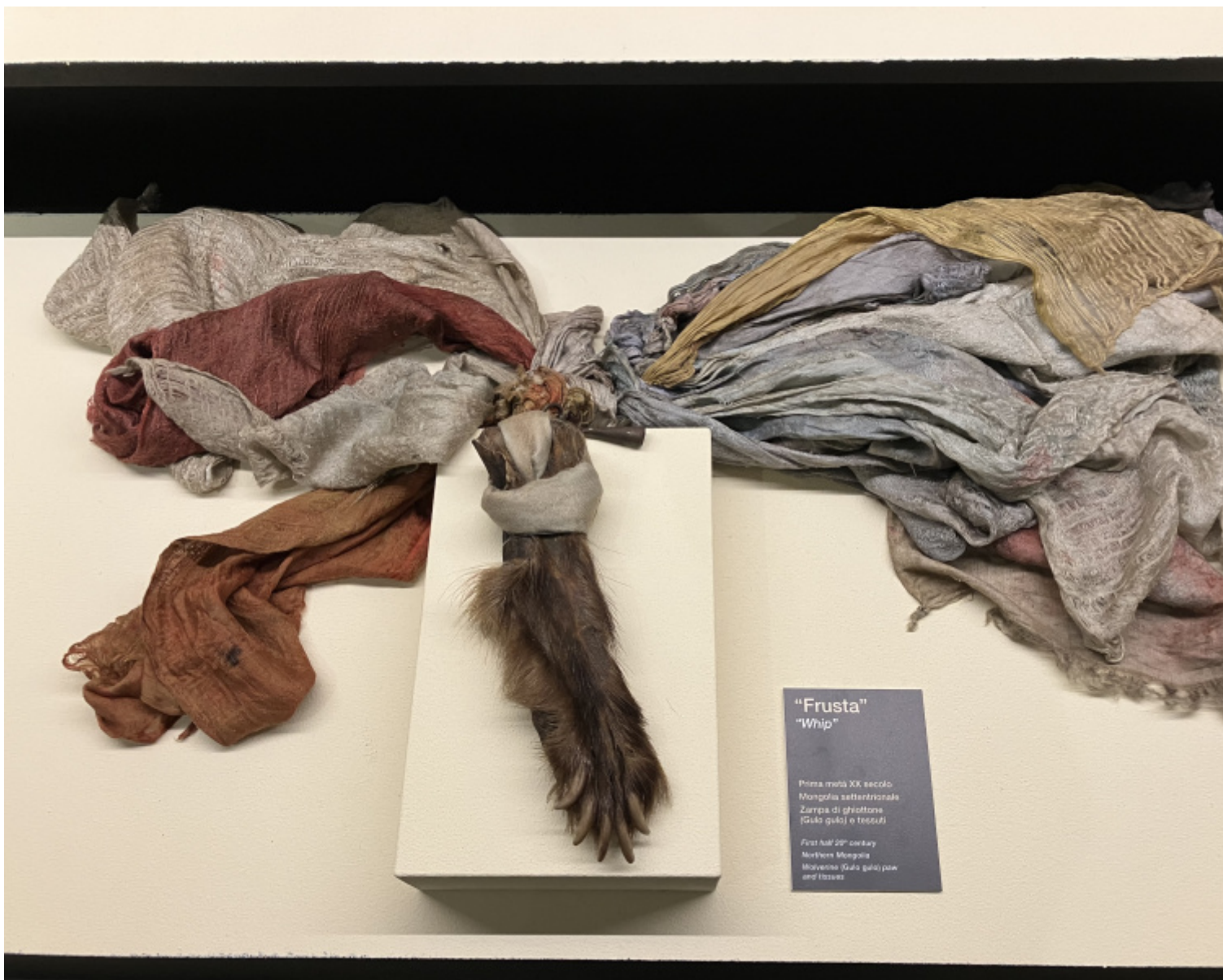
"Frusta" "Whip" Prima metà XX secolo Mongolia settentrionale Zappa di ghiottone (Gulo gulo) e tessuti First half 20 th century Northern Mongolia Marten's (Gulo gulo) paw and tissues

Continuiamo. Le stanze si ripetono un po' uguali. Costumi. Tamburi. Mazzuoli. Scossali. Maschere e bastoni rituali. Statuette curative. Collane. Gli elementi più irrequieti e seminali di questa mostra imperdibile e problematica, non solo per l'addetto ai lavori, sono però le installazioni video, a cominciare dall'autonarrazione di Sergio Poggianella, da cui finalmente apprendiamo dov'è volata l'anima della mostra. Poggianella aveva a Milano una galleria che trattava i Futuristi e, dal suo primo viaggio in Mongolia, non ha potuto rinunciare a un'intuizione tanto pericolosa quanto fertile, cioè accostare sciamanesimo e arte contemporanea, ricerca antropologica e ricerca artistica, oggetti etnici e oggetti estetici. Così, al secondo piano della mostra, l'idea è quella della contaminazione o, meglio, della sperimentazione artistica che sembra avvicinarsi all'esperienza sciamanica nel suo tentativo di varcare soglie, fondare cosmologie, abitare visioni, in una prospettiva spirituale e perfino terapeutica. Troviamo Richard Long, Marina Abramovi?, Joseph Beuys, Mali Weil, Anna Perach, David Aaron Angeli, e molti altri, che non usano lo sciamanesimo ma lo incontrano su un piano ontologico e antropologico abbastanza evanescente ma sufficientemente allusivo per legittimare l'operazione culturale.