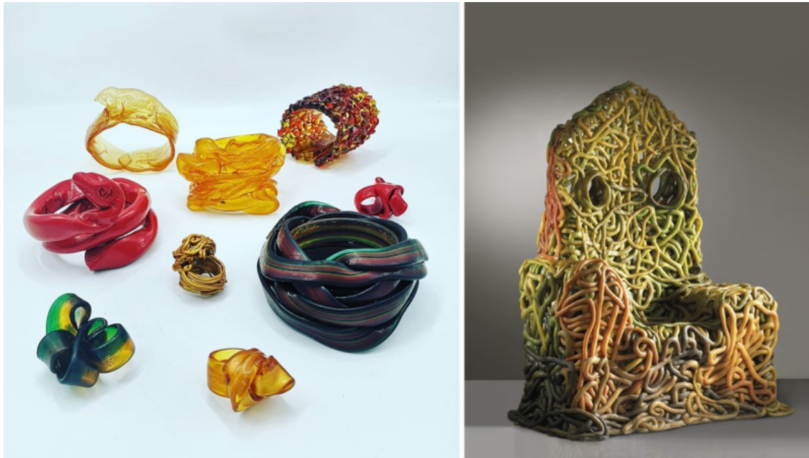
Gaetano Pesce, Gioielli della serie Fish design, New York, dal 1990; Trono, Modello senza fine unica, in PVC policromo nei toni del verde, beige e rosso, Produzione Meritalia, Italia, 2011.

Chi di noi non ricorda lo scherzo che fece scalpore sul web, quando, nel 2016 fu data la notizia della morte dell'artista? Per una notte tutti ne fummo convinti e, ovviamente, dispiaciuti. Per fortuna si trattava solo di una fake news . Ma come era nato il tutto? Così lo ha raccontato lo stesso Gaetano Pesce: