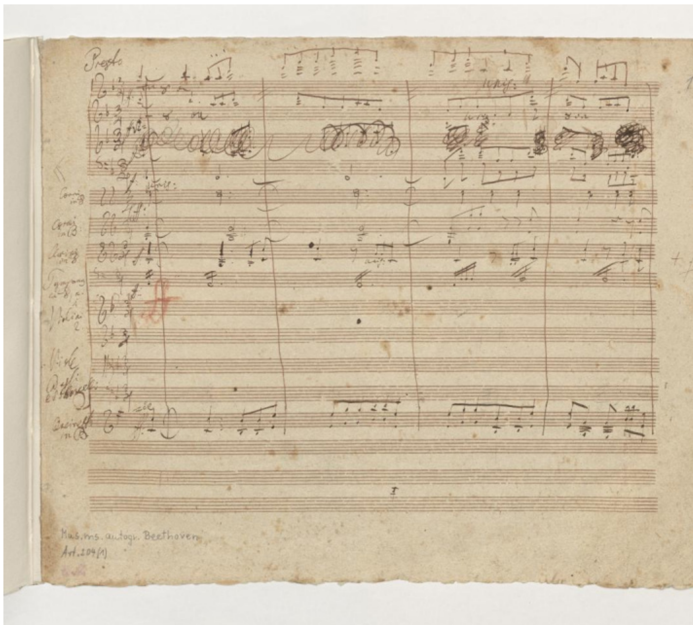
L'attacco dell'ultimo movimento della Nona nel manoscritto beethoveniano (Biblioteca di Stato di Berlino).

certamente noto a Beethoven fin dall'epoca della prima edizione. La sua intenzione di musicarlo risale infatti perlomeno al 1792, anno in cui un docente dell'università di Bonn scrisse alla moglie del poeta per annunciarle che il ventiduenne promettente compositore era intenzionato a musicare An die Freude . A partire dal 1798, si cominciano a trovare nei quaderni beethoveniani appunti melodici su versi sparsi dell'ode, e già verso il 1804 secondo i musicologi ci si trova di fronte a qualcosa che ha una chiara parentela con quello che sarà il definitivo "tema della Gioia". Il motivo era già comparso in precedenza: ancora nel 1795 Beethoven ne aveva utilizzato uno piuttosto simile nel Lied Gegenliebe su versi di Gottfried Bürger. Ma non era quello il momento della sua definitiva fioritura. Non lo era all'epoca della Fantasia op. 80, in cui fu impiegato in forma modificata. E non lo era neanche durante l'estate del 1812, quando l'idea di un'Overture sinfonico-corale sul poema schilleriano venne abbandonata ben presto; il materiale tematico abbozzato per questo progetto confluì tre anni più tardi nell'Overture Per il giorno onomastico , op. 115: un altro "cippo" lungo il tortuoso percorso creativo di questa melodia destinata a entrare nel Pantheon della mitologia culturale del nostro tempo.