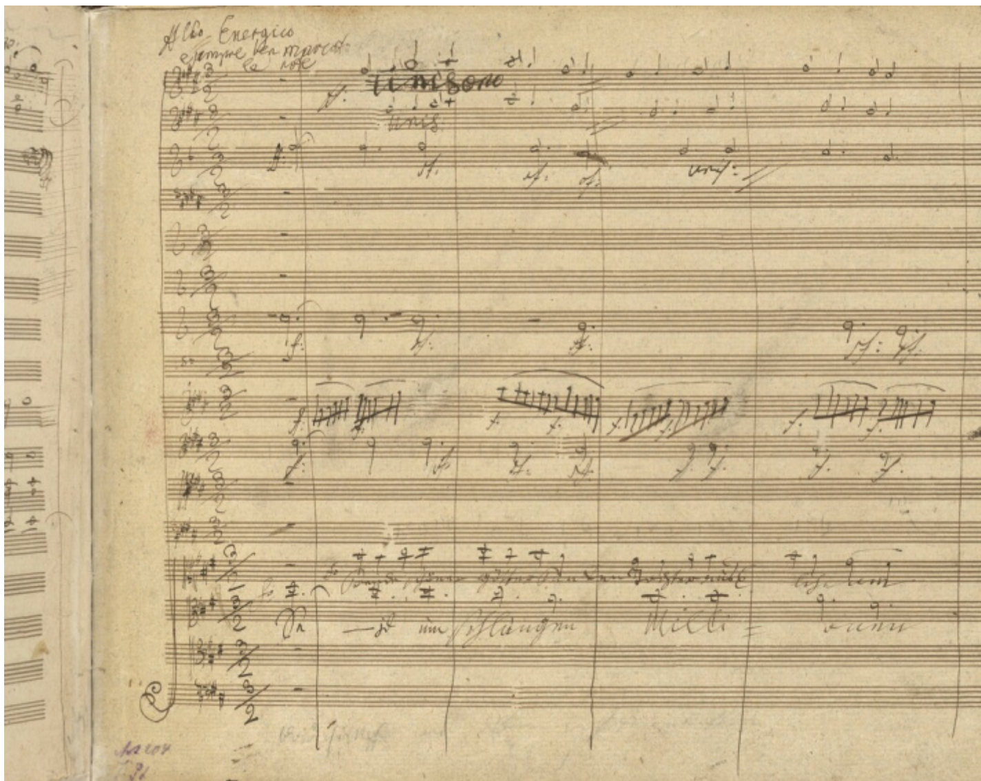
Uno dei passaggi più celebri dell'Inno alla Gioia, nel manoscritto beethoveniano: "Unitevi in un abbraccio, moltitudini" (Biblioteca di Stato di Berlino).

apparizione, si riaffacciano i temi principali dei tre movimenti precedenti, e ogni volta gli archi bassi si incaricano di contrastarne il passo, a loro volta attenuando l'impatto del loro risentito fraseggiare. Ed è proprio a violoncelli e contrabbassi che tocca introdurre il "tema della Gioia". La melodia appare dapprima quasi ai limiti dell'udibile, poi inizia a scalare le tessiture degli archi: la contemplano, si direbbe, le viole, mentre i fagotti si abbandonano a una fioritura dell'immortale motivo; se ne impadroniscono i violini, mentre le fioriture passano agli archi bassi, infine esulta nella piena orchestra, con gli ottoni che sfavillano.