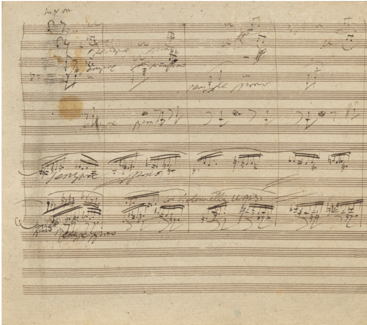
Una pagina del manoscritto della Nona, primo movimento (Biblioteca di Stato di Berlino).

La soluzione alla necessità di evitare una cesura troppo netta fra la grande parte solo strumentale che precede e quella corale fu risolta – sempre nell'ambito della forma variata che è il perno intorno al quale si muove tutta la Sinfonia – con un'ampia introduzione orchestrale. Ancora, come “mediazione” rispetto ai contenuti letterari schilleriani, Beethoven decise, dopo molte incertezze, di affidare al baritono una sorta di breve Prologo («O Freunde, nicht diese Töne»: «Amici, bando a queste note! Ne intoneremo di più dolci, tutti assieme, e di più gioiose»). Una contraddizione abbastanza singolare, visto che poco prima il “tema della Gioia” è già stato declamato a tutta orchestra, anche se subito seguito dalla ripetizione dell'angoscioso attacco dell'ultimo movimento.