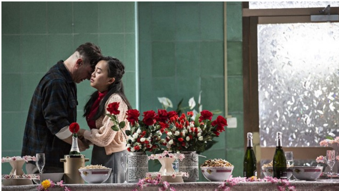
Saigon, foto di Jean-Louis Fernandez.

all'indomani dell'episodio di violenza. Alice convoca il suo aguzzino in una vasca da bagno, proprio come Clitemnestra con Agamennone: ma qui - invece di rispondere con violenza alla violenza, come lo spettatore forse si augura - gli impone soltanto una sorprendente coesistenza non sessualizzata dei due corpi nudi, nella loro dimensione di assoluta fragilità. A interpretare la protagonista in questo lungo e straniante bagno di giustizia riparativa non è l'attrice che la impersona da giovane (Eryn Jean Norvill), ma la Alice anziana (Amelda Brown), che espone orgogliosamente sulla propria carne il passaggio del tempo. Guiela Nguyen lascia invece apparire sul palco, mentre si avvicina il finale, tutti i personaggi che hanno animato il ristorante vietnamita nelle quasi quattro ore di spettacolo: coesistono nello stesso tempo e nello stesso spazio giovani e vecchi, morti e vivi, gli innamorati separati dalla storia e le famiglie spezzate. È solo un attimo, vertiginoso e commovente, poi la storia continua a fare il suo corso, inesorabile. Continuerà a essere questo il teatro - ci suggerisce Presente Indicativo: un luogo dove passato e presente convivono, le porte chiuse possono per un momento riaprirsi, le occasioni mancate manifestarsi di nuovo. Così, semplicemente, senza bisogno di effetti speciali.