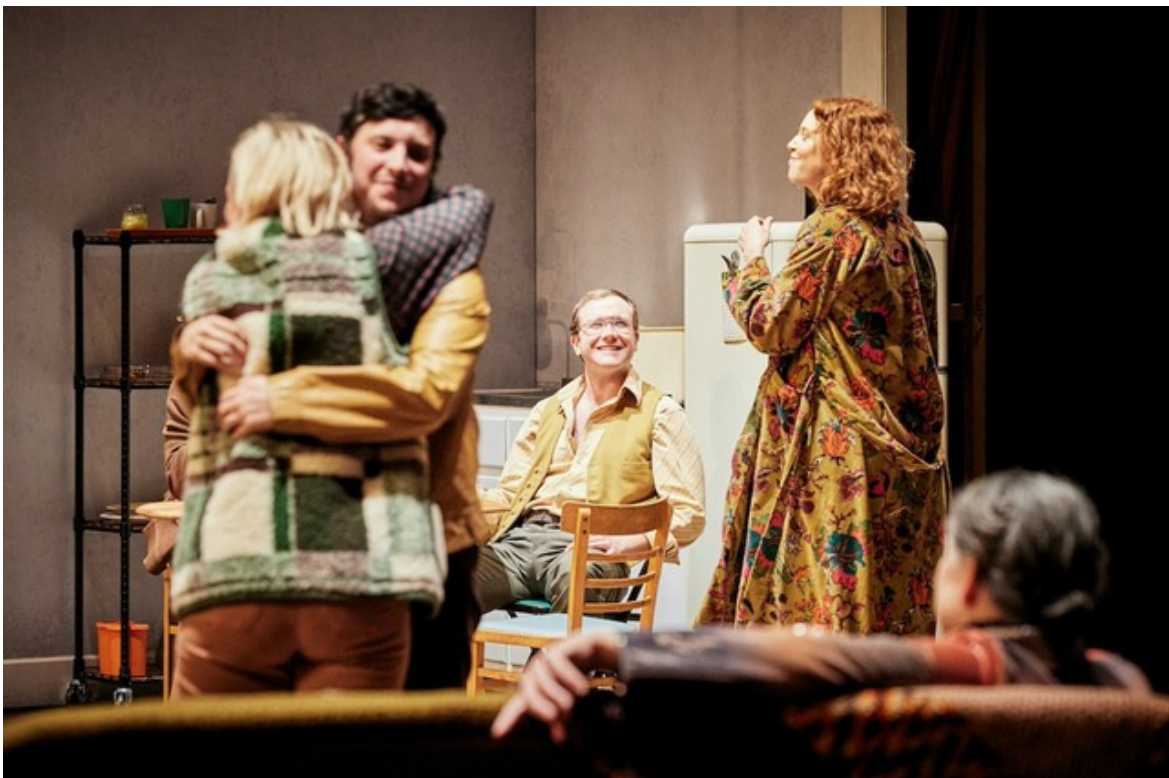
The Confessions

Vale la pena appuntare un'ultima riflessione, a proposito di come il teatro oggi possa affrontare a testa alta la sfida del dialogo con gli altri media. Nei cast di Saigon (undici attori e attrici, alcuni dei quali non professionisti), e di The Confessions (nove superlativi interpreti) si recita felicemente senza enfasi e con realismo, in modo non troppo distante da come ci hanno abituati le serie tv di qualità o il cinema. Le scenografie - ambienti da interno con piatti e bicchieri, gli attori non di rado seduti intorno a un tavolo - possono a tratti ricordare un set cinematografico, e sembrano perseguire una certa concretezza minimalista che non lascia molto all'immaginazione e alla metafora. Ci si potrebbe chiedere se il teatro non sia piuttosto il luogo dell'astrazione e del simbolo, e se a forza di inseguire la realtà e gli stili del piccolo e grande schermo non si finisca per smarrire le specificità della scena. Ci sono due momenti indimenticabili, rispettivamente in The Confessions e in Saigon , dove il tempo pare sospendersi e che offrono una silenziosa risposta a questa domanda.