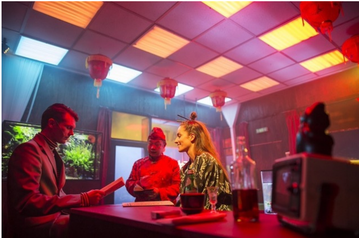
Rohtko, foto di Arturs Pavlovs.

un film enigmatico, in cui piani temporali differenti si accostano tra loro; al contempo, sul palcoscenico è un teatro antico e sempre nuovo a realizzarsi, secondo le proprie regole di prossemica e movimento, di recitazione e gesto, di macchinaria e artigianato. “Il trucco si può anche vedere, e forse è bene che lo si veda, ma nello stesso tempo l’illusione dev’essere proprio stupefacente”, annotava Tony Kushner negli appunti per la messinscena di Angels in America , e l’arte di Twarkowski mostra ogni proprio inganno, rivela ogni singolo dispositivo umano e tecnico necessario a realizzare un’opera-mondo di fronte alla quale si prova un genuino senso di incanto bambinesco.