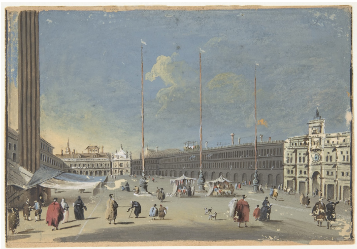
View of the Piazza di San Marco Toward the South (showing the now destroyed church of San Geminiano), Giacomo Guardi.

“Nell'altro quadrante, a sud-ovest, investito dal sole radente, scopriamo all'orizzonte – con un gran martello nel cuore – il profilo di Venezia che aspettava. Era proprio Venezia: il sole basso prendeva d'infilata i campanili lontani – quanti –; sottili e puntuti, uscivano qua e là dalla bruma, affioravano da quell'impasto grigio tra acqua e terra. Brevi sagome incerte, appena visibili: ma il sole gli dava corpo, li avvicinava a noi, e noi a loro. Durava poco, l'orizzonte si confondeva con la foschia man mano che si alzava; le distanze ridiventavano nebbia o vapori, Venezia si dissolveva quando stava per farsi più nitida. Una mattina decidemmo di inseguire le dissolvenze: di fare una puntata da quelle parti, finiti certi rilievi tra le pietre. Traversata la laguna nord, ci avvicinammo a Torcello; da lì senza volerlo, come spinti da un motore invisibile, fino a Murano, a un passo da casa. Dietro il verde di San Michele, eccola, improvvisa, ormai a portata di mano, Venezia: ponti, rive, case, campanili – quasi quasi si vedeva anche l'ufficio da qui. Laguna in bassa marea: la città pareva alzarsi su campi di alghe, su striscioni di fango.