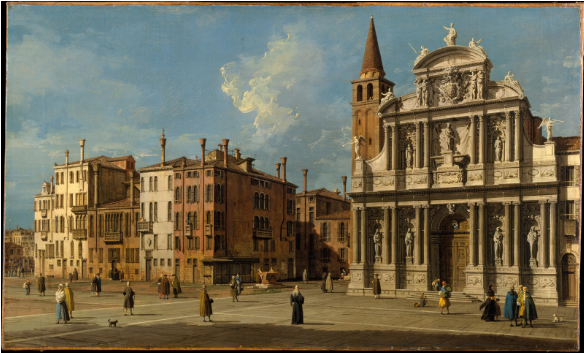
Campo Santa Maria Zobenigo, Canaletto.

“Non dall’aeroplano, sempre goffo, nel suo baccano ruggente e nel suo superconsumo di energie, ma dall’alto di una rassicurante, bonaria mongolfiera, che contemporaneamente fosse presa in enigmatici e rapidissimi vortici da satellite artificiale, converrebbe poi salutare Venezia, i suoi dintorni e gli estuari, in cerchi di orizzonti sempre più larghi. Il misterioso, trafiggente e trafitto scarabeo della città brilla nel mezzo della laguna, nutrito e insieme come sacrificio dentro di essa. Affiorano spunti di barche, ancora soffiate via per canali appena individuabili, indizi di caccia e di pesca pazienti nello stesso modo e nello stesso modo attonite e senza prede se non di incanti: siano meandri di corsi d’acqua, o rettilinee defilature di argini, o i coltivi improbabili del mare, o il taglio al diamante di certe isolette, o la divinazione di topografie scomparse che solo il trascolorare delle erbe contro l’ortogonalità dei tracciati fa entrare appena nell’angolo più incerto della vista. Da sempre più in alto e insieme da vicino si ritorna all’intenso e delicato abbraccio terra-acqua nelle sue centomila figurazioni, all’innesto difficile delle acque dolci nelle salsedini, o anche di ciò che è morbido e salutare in ciò che, a poca distanza, è ammorbato e chimicizzato. Vivono le grandi barene, dorsi di entità che si lasciano scoprire e ricoprire secondo impalpabili, grandi leggi, appaiono stellate macchie, uccelli, antenne vibratili come di formiche all’incontrarsi”.