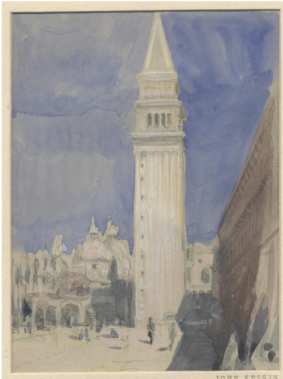
John Ruskin

Altrettanto poco rassicurante è la visione di una Venezia post-guerra che la bassa marea rivela scarnificata, erosa fin nelle fondamenta, galleggiante sul vuoto: così nel racconto Settesabbie di Paolo Barbaro (Mestrino, 1922 - Venezia, 2014), un testo che per Tiziano Scarpa - altro veneziano - è "uno dei vertici della letteratura italiana del Novecento, uno dei racconti più belli che il secolo abbia espresso". In questa storia, due giovani ingegneri assunti dal Genio civile per eseguire dei