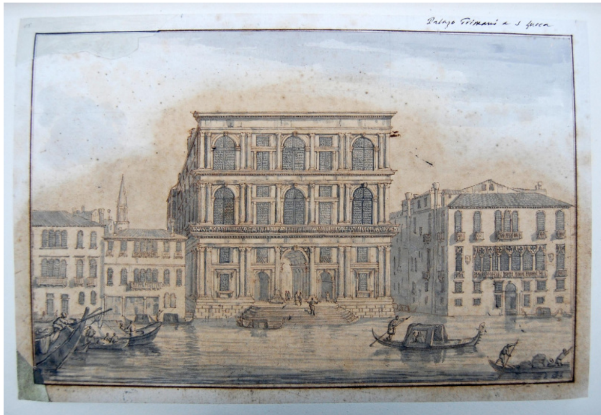
Luca Carlevaris

Da tutt'altro punto di vista, ma sulla stessa linea di Zanzotto, col quale si intendeva bene, il geografo Eugenio Turri (Grezzana, 1927 - Verona, 2005) ribadisce l'indissolubilità del binomio Venezia-laguna, e sottolineando il lavoro dell'uomo per rendere abitabili queste terre malcerte ne rivela l'intrinseca precarietà: