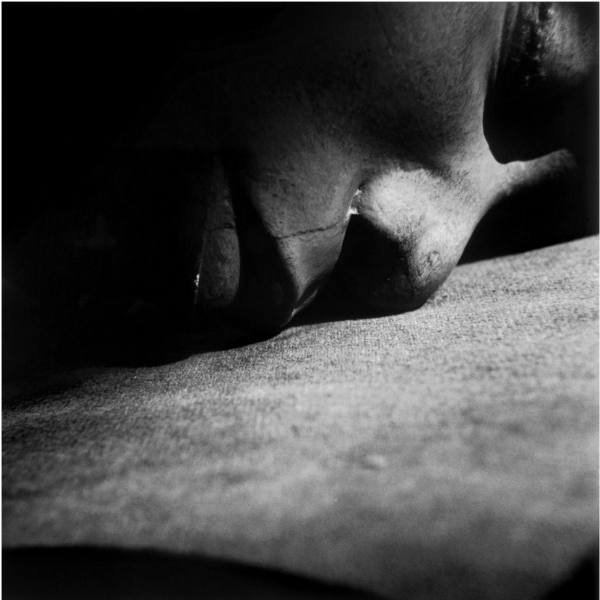
Res 1999 © Antonio Biasiucci.

Meno che mai può apparire un caso il fatto che la parola “arcano” trovi la propria etimologia in “ciò che è riposto nell’arca”. Anche le cose più evidenti possono risultare nascoste o misteriose, e la fotografia vive di continuo in bilico tra i nomi realtà e ignoto, verità o illusione. Biasiucci riesce a dirci che la vista è un’attitudine in cui perseverare per scoprire l’assenza di un confine tra quei concetti opposti. Le scritte cancellate dalla lavagna de “La Sapienza” di Roma (“Sapienza”, 2023) sono traccia a un tempo di un sapere e di un tempo trascorso, e sono il disegno nuovo nato dal gesto fisico di rimozione del segno. Un sapere che rimarrà sepolto, che si potrà solo più intravedere nei frammenti sopravvissuti, componendo nell’insieme un gesto simile a quello che Dio compì cancellando col diluvio la maggioranza delle forme di vita della Terra.