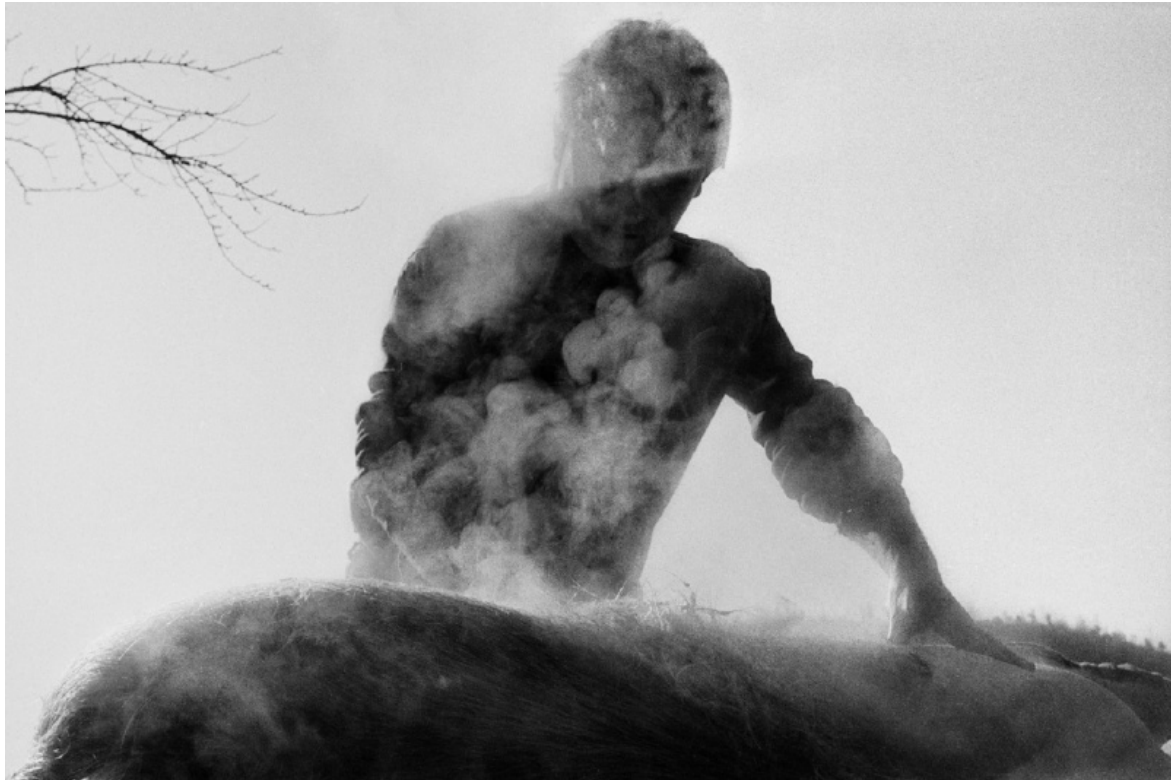
Vapori. Il rito dell'uccisione del maiale 1983-1987