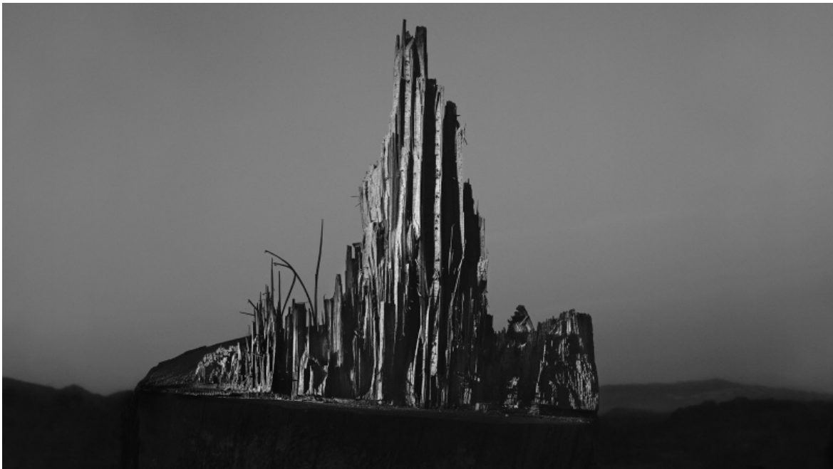
Corpo ligneo 2021 © Antonio Biasiucci.

arrivare a una visione rivelata, aperta a una nuova storia. Si prenda il lavoro “Vacche”, a cui il fotografo lavorò tra il 1987 e il 1991. Ci appare una serie di dettagli apparentemente informi dei corpi degli animali fotografati dentro lo spazio chiuso della stalla in cui vivevano. Così il fotografo, fattosi più piccolo nelle possibilità ridotte di quel luogo, e vicino – vicinissimo – ai corpi animali, poté vederli nella loro più ampia forma di colossi neri, o dune, o monti invalicabili. E il muso come una silhouette scura in mezzo al pavimento, e l’occhio che ci guarda emerso da quel corpo buio può essere quello della Solfatara (1995) di Pozzuoli, l’occhio “della Natura non indifferente” (Biasiucci), l’occhio in cui, e grazie a cui, può compiersi la congiunzione perfetta tra le forme nel tempo.