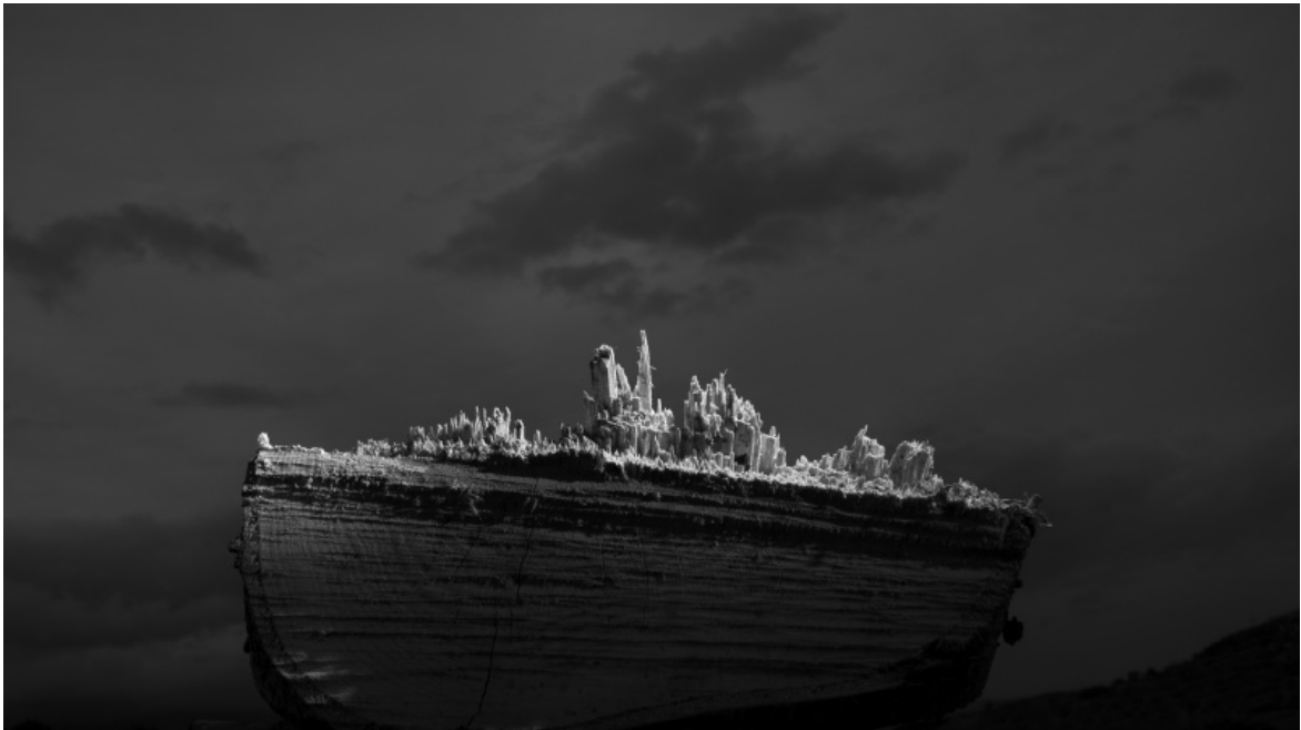
Corpo ligneo 2021.

La mostra, che presenta circa 250 fotografie, ben evidenzia la linea di congiunzione che tiene insieme e lega ogni singolo lavoro di Antonio Biasiucci: non solo per motivi formali – una predilezione chiara e motivata per l’uso del nero è il dettaglio che può saltare più facilmente agli occhi – ma anche per la scelta di quei temi che, come lui stesso afferma, tendono a “riscrivere la storia degli uomini” e che lo spingono a confrontarsi “con soggetti a essa essenziali [...]”. Un’utopia, quella di Biasiucci, che segue però tappe precise senza deviazioni, passando in rassegna davvero le manifestazioni fisiche degli archetipi dell’uomo: il pane, il latte e l’animale che lo genera, la vacca, il magma vulcanico, per citare qualche esempio, sono le fondamenta, il DNA dell’organismo e della nostra mitologia millenaria.