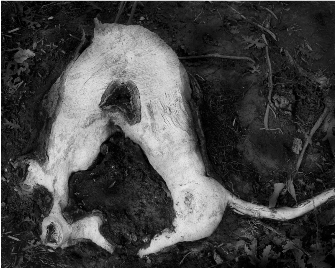
Ghenos 2017 © Antonio Biasiucci.

svolto nel campo profughi di Souda, in cui volti, mani e piedi si fanno portavoce, sebbene qui i piedi siano fermi e non camminino, le mani non afferrino nulla, gli occhi di tutti siano chiusi, dell'esodo inesausto dei popoli in fuga. Così la lotta per la vita, incarnata da chi fugge verso nuove realtà, si ritrova anche nello spasimo del neonato, nel suo dimenarsi per uscire alla luce nel momento del parto, come in quello fotografato da Biasiucci nell'ospedale di Matany, nel 2015. Il desiderio di vita è espresso nei lavori in mostra senza mai toccare esplicitamente il tema dell'Eros, a cui pure siamo freudianamente abituati a collegare il primario impulso di perpetrare noi stessi.