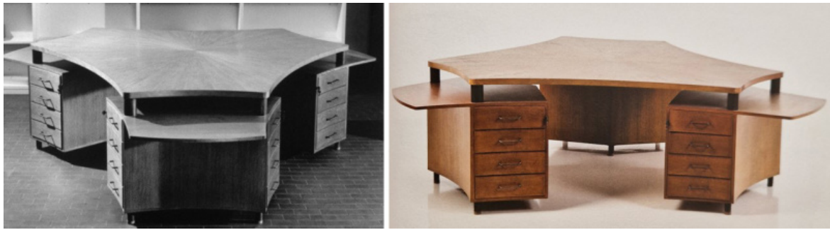
Gio Ponti, prototipo di scrivania per il Corriere della sera, 1936, (cm 279x250x74), eseguito da Iginio Ghianda.

giornalisti del Corriere della sera . Ma quel mobile maestoso ha segnato gli anni della mia crescita, educandomi alla bellezza e al 'fatto bene', insieme alla venerazione che in famiglia si tributava al suo progettista e al suo esecutore.