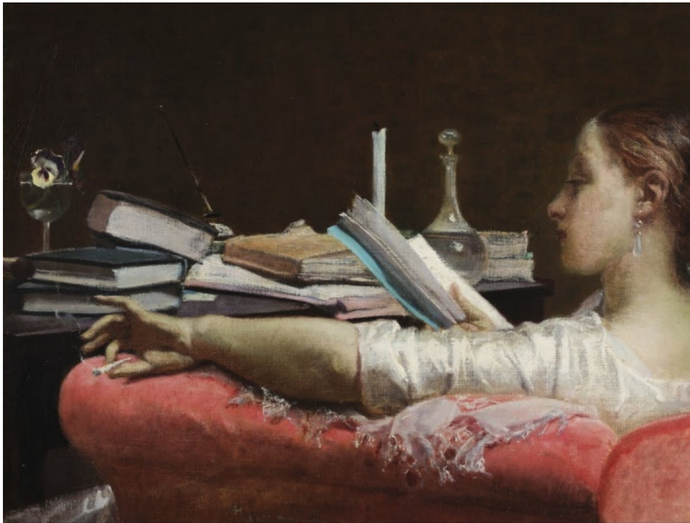
Federico Faruffini, Lettrice (Clara) , 1865, olio su tela, 40,56 x 59 cm, Milano, Galleria d'Arte Moderna.