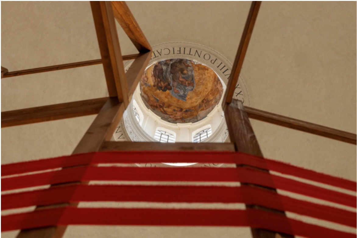
Allestimento della mostra.