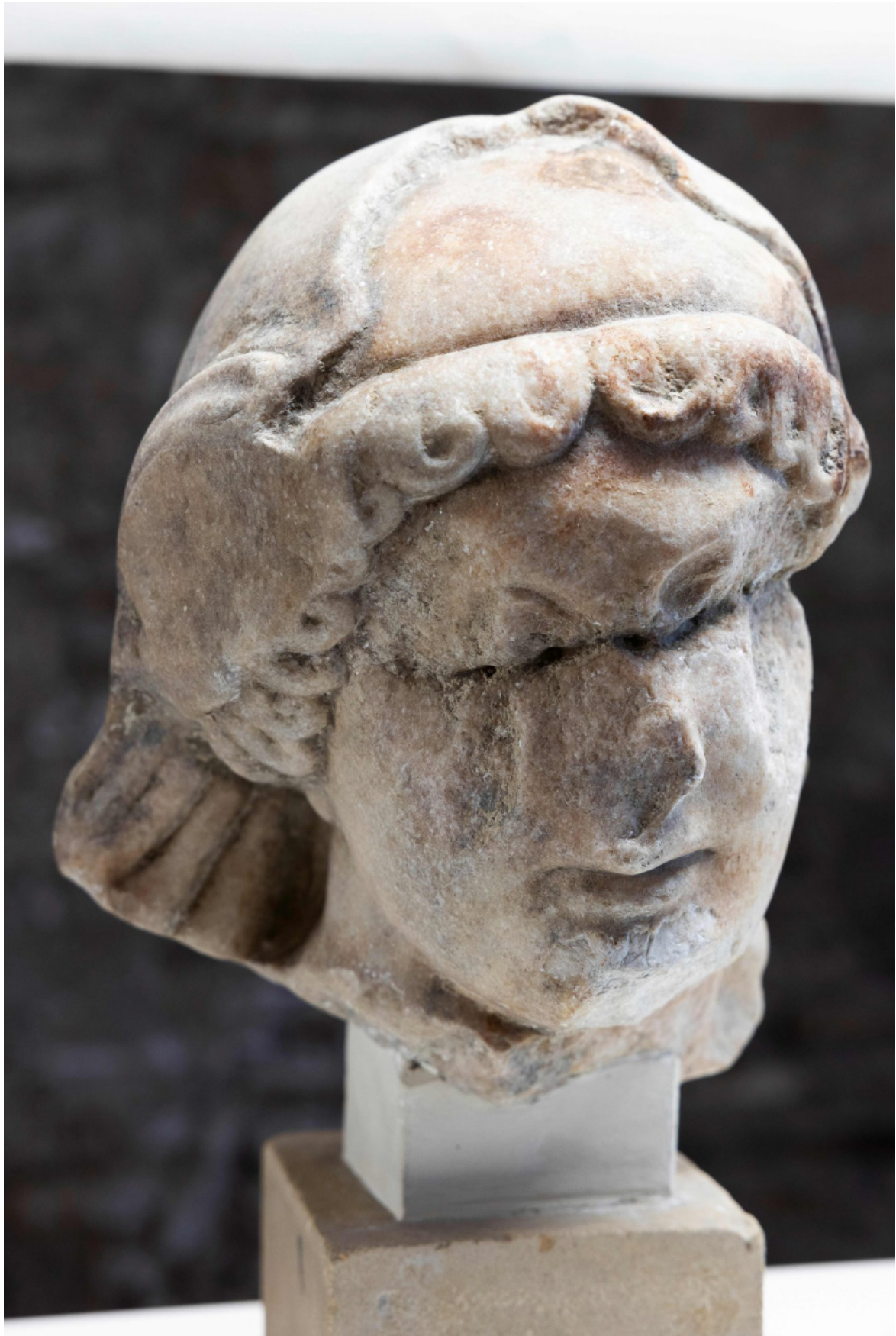
Testa di Penelope, dal Tevere, copie romana del I secolo d.C.

Il velo è l'elemento su cui insiste una serie di raffigurazioni. La donna si copre ai pretendenti che l'attendono nella sala, questo ci si aspetta da lei nel suo ruolo: