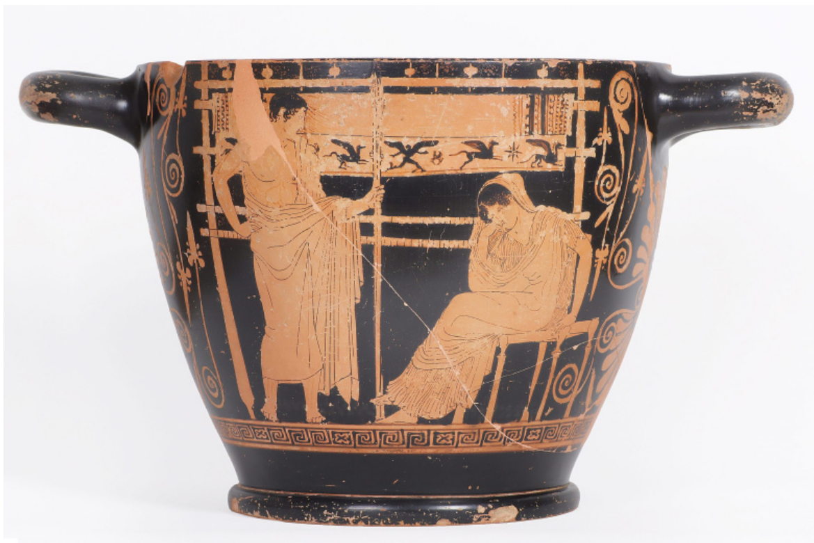
Telemaco e Penelope, skyphos attico, 440 a.C. circa.

punto un'iconografia della regina che ne privilegia l'aspetto umano. Ne è un esempio il vaso attico di Chiusi, risalente al 440 a.C. circa, tra pezzi più antichi dell'esposizione: Penelope appare seduta, la mano sinistra appoggiata allo sgabello, la destra preme la guancia e forse asciuga le lacrime. Anche le crepe della terracotta dicono la sua sofferenza, quando finirà la pena? Il corpo richiuso su sé stesso, dolorante di nostalgia: Telemaco, in piedi di fronte a lei, non può davvero avvicinarsi, né capire la madre, donna sola al mondo, sola di giorno e di notte. Alle loro spalle il sudario di Laerte, incompiuto, dà la misura del silenzio, anni vuoti pieni di fantasmi. Pende dalla staffa come il braccio del Cristo morto, triste. Il disegno ha permesso di ricostruire un modello a grandezza naturale visibile in mostra ed è una sorpresa trovarsi di fronte allo stesso telaio, noi oggi lei allora, percepire le proporzioni, immaginare l'ampiezza dei movimenti.