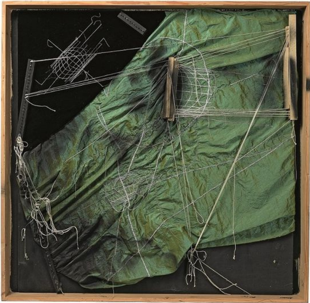
Maria Lai, Errando n. 2 , 2008.

Di Maria Lai sono poi esposti i libri, certamente tra i suoi lavori più noti. Qui il legame ancestrale tra ricamo e scrittura si rivela con grande intensità. Nelle fibre di parole lanuginose, si impiglia l'eco di antiche narrazioni. Le eccedenze di filo - e forse di frasi - raggrumate a lato della pagina assomigliano a formazioni organiche, alghe, cose primordiali della natura. E così la scrittura si fa motore della creazione, una forza misteriosa, indecifrabile.