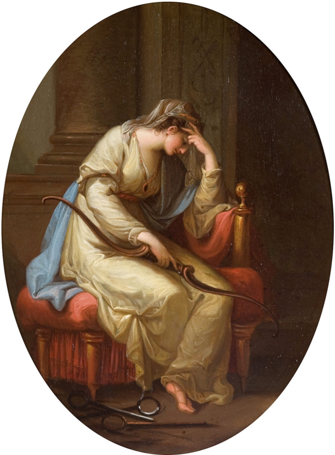
Angelika Kauffmann, Penelope piange sull'arco di Ulisse, 1779 circa.

Leandro Bassano: la giovane tesse nella penombra al lume di candela, medita, la nostalgia diventa un nido dolcissimo in cui appartarsi. Oppure ancora la bella Penelope secentesca di Pellegrino Pellegrini da Fanano, con occhi che guardano altrove, il realismo dei dettagli e nel complesso una quotidianità pervasa di sentimento.