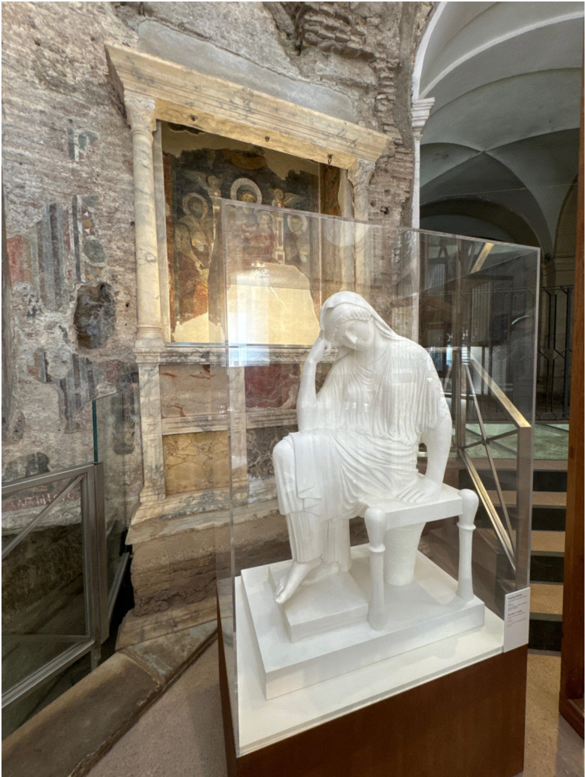
Ricostruzione del tipo statuario antico della Penelope dolente, 2005-2006.