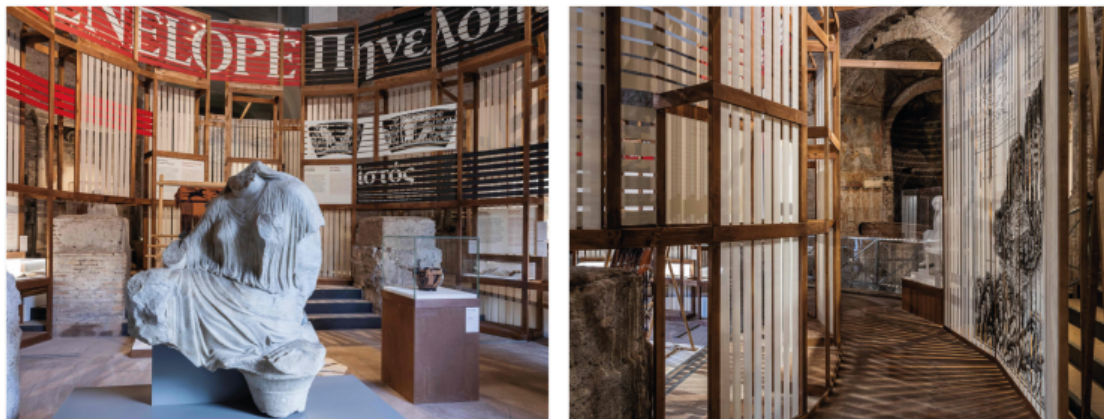
Allestimento della mostra.

L'impostazione data dai due curatori appare essa stessa una tessitura, essendo il filo di trama la disposizione cronologica delle opere e l'ordito i nuclei tematici suggeriti nelle diverse sezioni per illuminare i tratti peculiari del personaggio; la Penelope dolente, velata, la Penelope che sogna e attende, la moglie regina al potere e ancora le sfumature del suo essere donna (per un mio recente ritratto di Penelope, leggi qui ). D'altra parte, proprio la complessità e il mistero legati al personaggio hanno contribuito alla fortuna del mito e stimolato le sue numerose reinterpretazioni, facendo prevalere un tratto o l'altro a seconda dell'epoca e dei valori culturali di riferimento.