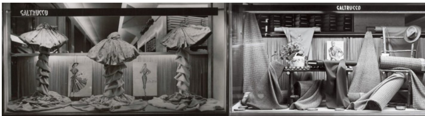
Anni cinquanta, vetrine del negozio Galtrucco di Milano in piazza Duomo con tessuti e figurini, reparto donna e reparto uomo.

Sebbene l'azienda Galtrucco non sia nata a Milano e abbia avuto negozi in molte altre città d'Italia, ha indubbiamente segnato per il capoluogo lombardo il primo step di quel percorso che presto l'avrebbe portata ad essere una delle principali protagoniste della moda milanese. Galtrucco e Milano, insomma, per molto tempo sono stati sinonimi. Il negozio di Galtrucco era la Moda. Il negozio di Galtrucco era Milano.