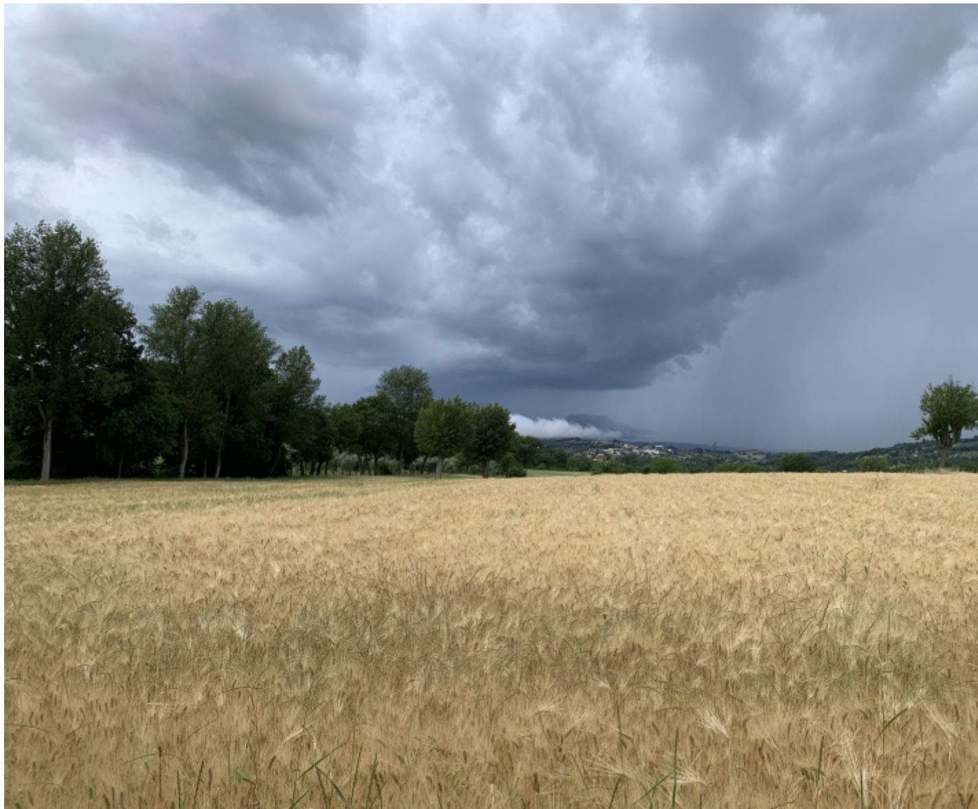
Contrada Filette (fotografia di Ugo Morelli).

I testi e la musica delle canzoni, di cui Rovelli è autore, e in pochi casi coautore, sono messi a confronto con punti di vista diversi, di poeti, studiosi e scienziati, per esplorare il filo conduttore dell'attesa. Non si tratta dell'assenza di qualcosa o di qualcuno da attendere. L'assenza assume lo statuto di una condizione esistenziale, in cui alla fine emergerà chiaramente la matrice di quella intersoggettività che decide dell'evidenza che nessuno diventa qualcuno senza l'altro. L'altro non è la soluzione, ma la condizione. Una condizione di continua ricerca, come nel tempo dilatato dell'Annunciata di Antonello da Messina, che Rovelli assume a icona del suo modo di vivere e sentire l'attesa. L'attesa si propone a Rovelli come una dilatazione infinita del tempo, che annulla passato e futuro. È una condizione di sospensione del giudizio e di presa sul mondo; un modo di lasciare essere il mondo, lasciarlo alla sua pura dimensione del divenire. Del resto come emerge nel dialogo con la poetessa Maria Grazia Calandrone, anche per l'amore vale la disposizione a lasciarsi andare, riuscire ad abbandonarsi per abbandonare la propria ferma identità. Solo a questa condizione è possibile accorgersi dell'esistenza dell'altro uscendo dal guscio soffocante dell'io.