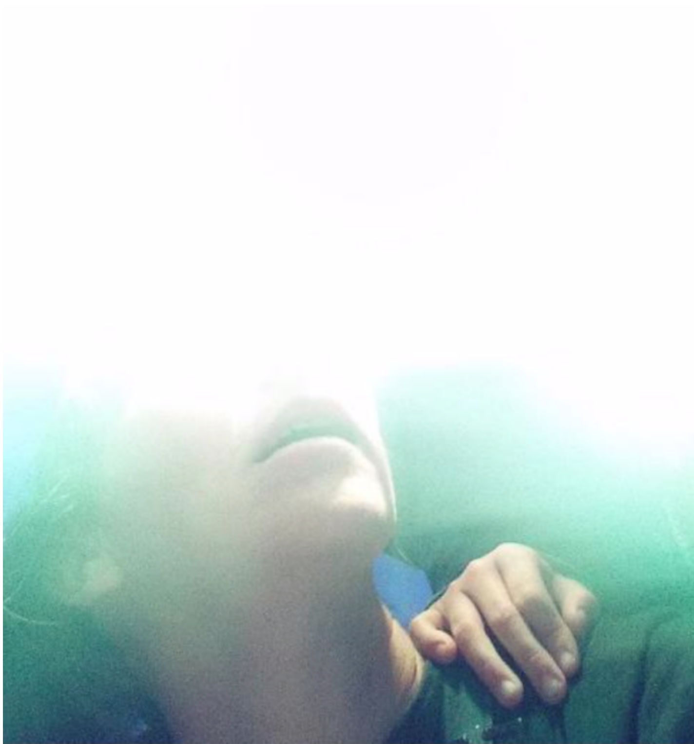
Opera di Moira Ricci.

La mostra Senza titolo (inconscio) , Un progetto di Giulio Lacchini, a cura di Elio Grazioli è aperta fino all'8 marzo presso la Fondazione Galleria Milano ETS.