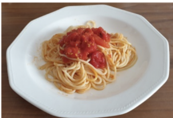
Spaghetti tradizionali al sugo di pomodoro, da mescolare

Oggi la pasta viene portata in tavola già amalgamata col suo condimento, di modo che, in ogni piatto, pastasciutta e intingolo arrivano ben mescolati. Ma si ricorderà che, fino a una ventina d'anni fa o poco più, gli spaghetti, e in generale la pasta, venivano serviti bianchi in tavola, con un po' di salsa di pomodoro al top, e spettava al singolo commensale mescolarli a piacere prima di gustarli. Molto a lungo s'è fatto così, e in alcune famiglie più legate alla tradizione accade ancora. Le giovani generazioni non lo sanno, e quando glielo si racconta scatta, da un lato, l'incredulità e, dall'altro, una latente nostalgia, un vago senso di bel tempo andato.