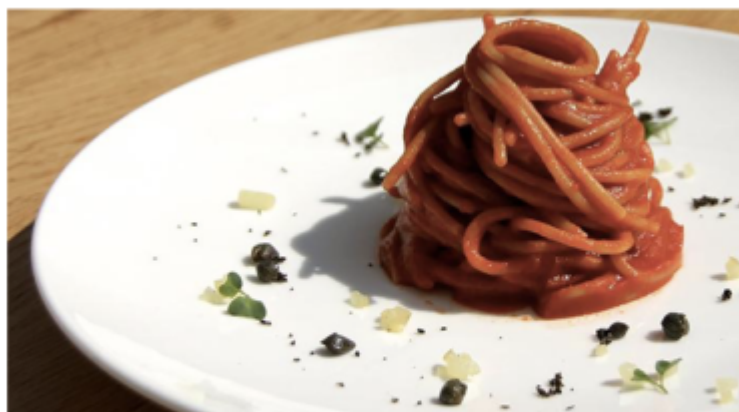
Spaghetti al sugo amalgamati in cucina

Quella pietanza, quel giorno là, era perciò stata realizzata sotto il segno del vintage, ma soltanto nell'impiattamento, nell'aspetto visivo. La pasta era bianca, il burro intensificava questo colore, a suo modo però condendola. Il tonno stava sopra, spolverata d'un rosso assai forte, separato dal resto ma pronto a esser mescolato alle busiate secondo il gusto e le fisime del singolo invitato. Perché tutto ciò? questa composizione stava influenzando il gusto del piatto? stava favorendo la creazione del cuoco? serviva a dettare un preciso modo di degustazione? Pare proprio di no. La risposta è un'altra: si trattava d'un gioco, soltanto un gioco di camuffamento, è ovvio. Non sappiamo se voluto o inconsapevole, da parte del cuoco, ma comunque evidente agli occhi di un commensale, diciamo, agé .