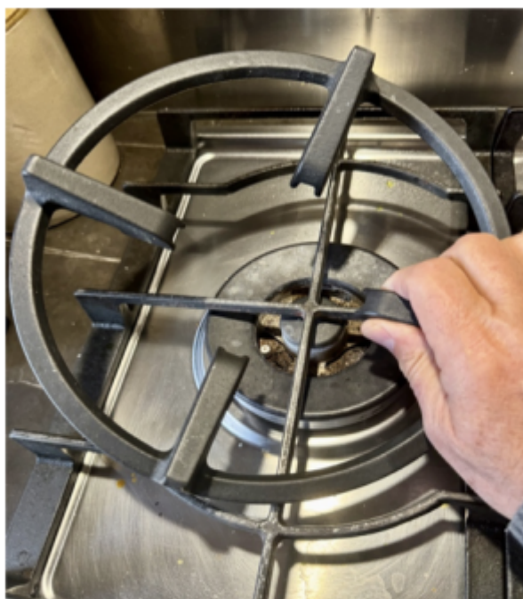
Supporto per wok

Ho tenuto in un armadietto in alto l'adattatore per molti mesi, sinché, riordinando la stanza dei fuochi in uno sprazzo di noia, è saltato fuori. Mai usato, splendente, lui sereno, io perplesso. Più che immaginarmi un modo per utilizzarlo qui e ora (basta chiederlo a Google o ad Alexa), ho provato a capire se, come e cosa il wok abbia modificato la cucina del Belpaese: la quale, nella sua granitica sicumera, di trasformazioni radicali ne ha subite parecchie. Ho interrogato amici e parenti ottenendo risposte dissimili: c'è chi lo usa regolarmente, benedicendo il supporto che lo tiene in equilibrio sul fornello, e chi non sa nemmeno che cosa sia.