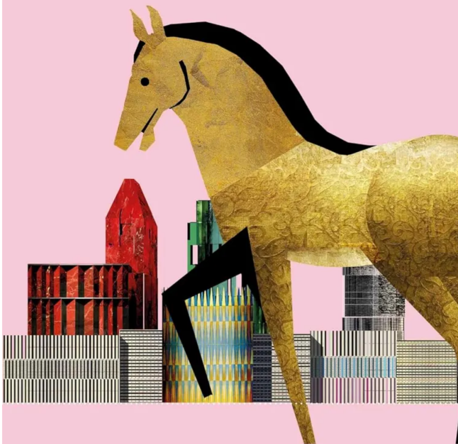
Figure e Testi per una Messinscena del Mito