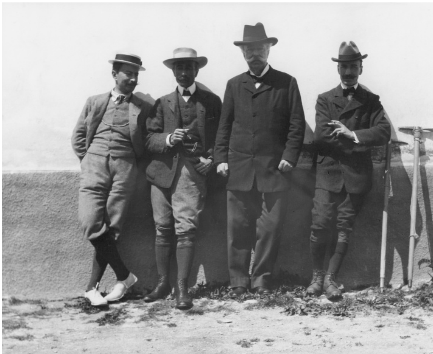
Autore non identificato, Ugo De Amicis, Guido Rey, Edmondo De Amicis ed Edoardo Rubino al Giomein, davanti al Grand Hôtel du Mont Cervin, agosto 1905, negativo originale su pellicola alla gelatina bromuro d'argento. Centro Documentazione Museo Nazionale della Montagna – CAI Torino.

Una persona emerge nelle quattro sezioni dell'esposizione: un fotografo, sì, e letterato, e abile alpinista, ma amico anche dei nomi illustri del panorama culturale del suo tempo, in primis Ugo De Amicis, figlio di Edmondo, e dell'artista Edoardo Rubino.