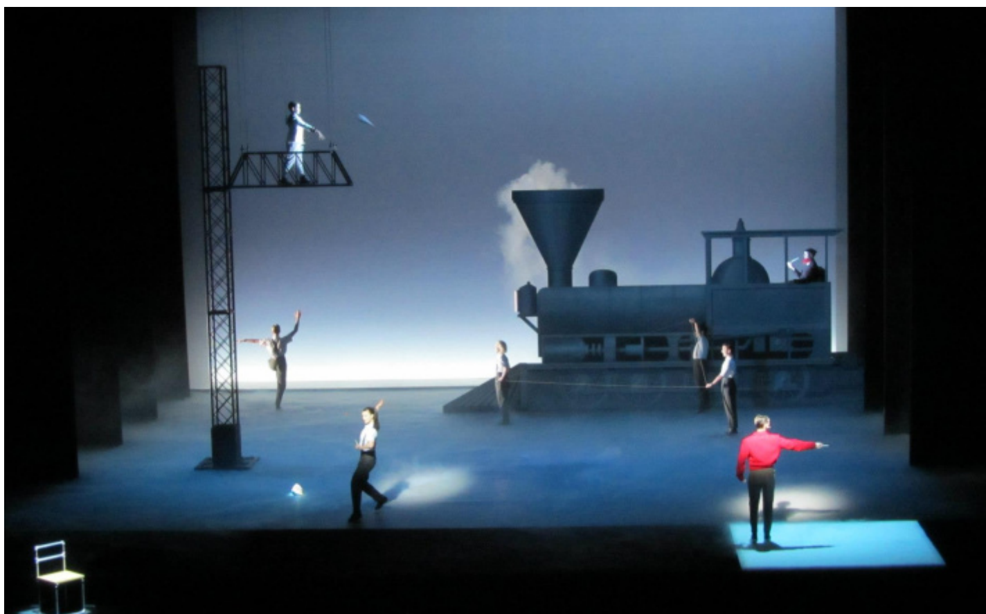
Einstein on the Beach

Bob Wilson, al secolo Robert, lo associo con un cartoccio di pere. Era il 1976. Avevo poco più di vent'anni. Correvo, con una cara amica, a vedere il suo Einstein on the Beach alla Fenice di Venezia per la Biennale teatro diretta da Luca Ronconi, consigliere Franco Quadri, che Wilson lo aveva seguito dagli inizi di Deafman Gance , spettacolo creato dopo aver lavorato con ragazzi disabili.