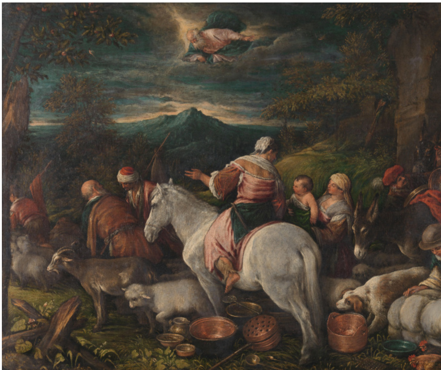
Abramo lascia Haran, Leandro Bassano.

Un simile «Big Bang dell'umanità» (la definizione si trova anche nell'edizione curata da Baricci) ha avuto e continua ad avere esiti imprevedibili nella stessa letteratura profana, compresa quella di Marilynne Robinson. Ammesso e non concesso che quanto accade a Gilead e dintorni non faccia parte a sua volta della storia sacra. O, meglio, che la trasformazione degli esseri umani in «competenti attori morali» avvenuta attraverso la «conoscenza del bene e del male» non sia qualcosa che ci riguarda ancora direttamente. Non sappiamo quale fosse il segno impresso dal Signore su Caino, ma intuimo una disarmante bellezza in Jack, l'antieroe che nella tetralogia Robinson assume su di sé la sventura del figlio colpevole e disamato: un diseredato «principe delle tenebre» inseguito dal sospetto che l'esistenza di ciascuno sia visitata da «un misterioso, benevolo intento».