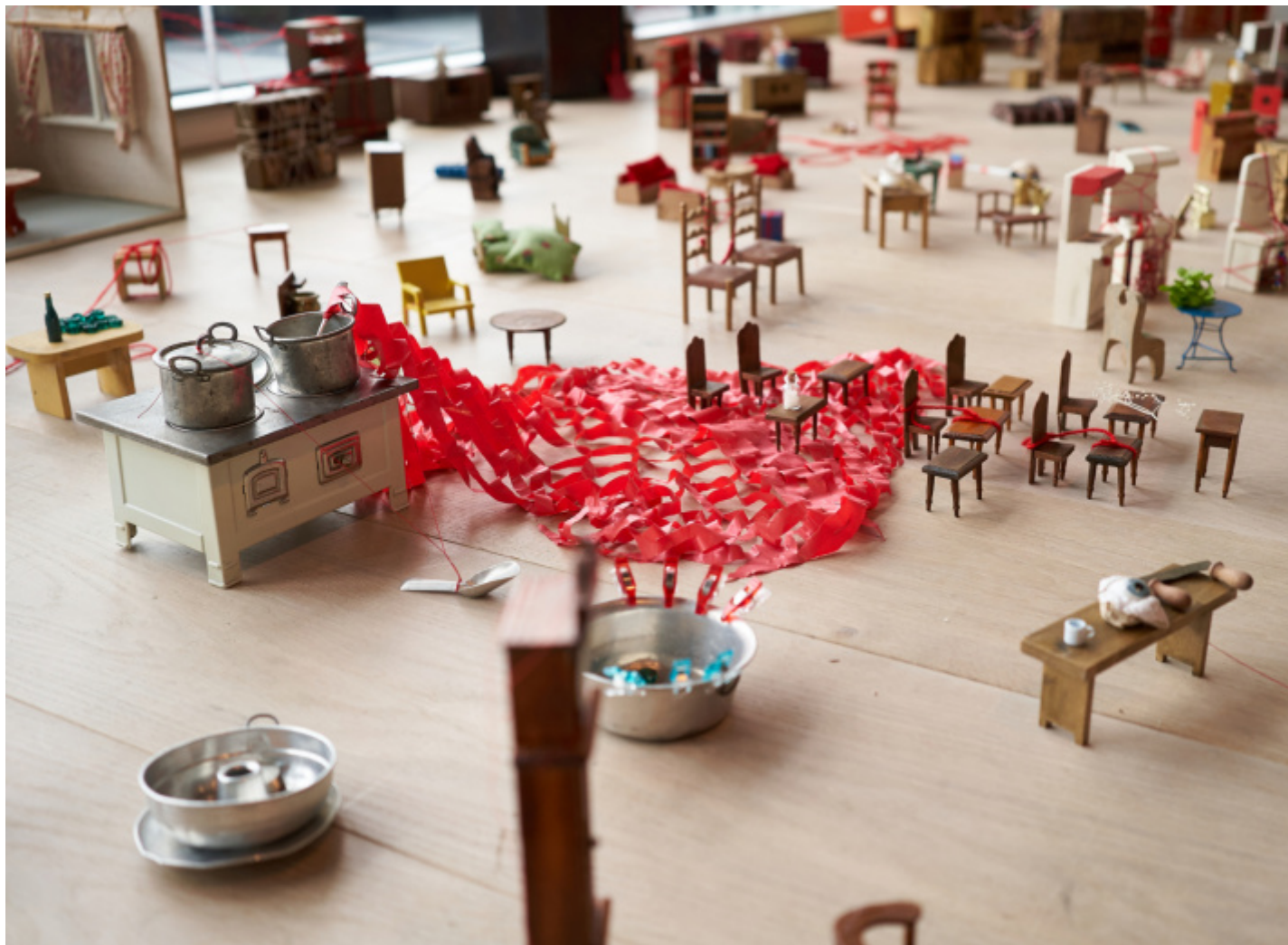
Shiota Chiharu, Connecting Small Memories (detail), 2019, Mixed media Dimensions variable Installation view: Shiota Chiharu: The Soul Trembles , Mori Art Museum, Tokyo, 2019

O più piccoli. Connecting Small Memories (2019) è un mondo miniaturizzato in cui ogni oggetto si presenta in una piccola rete di fili rossi – “Quando voglio raccontare una storia, uso il rosso”, dice sempre Shiota – a ribadire ancora le strade molteplici che ogni cosa porta con sé; sta a noi capire se i fili ingabbiano o connettono.