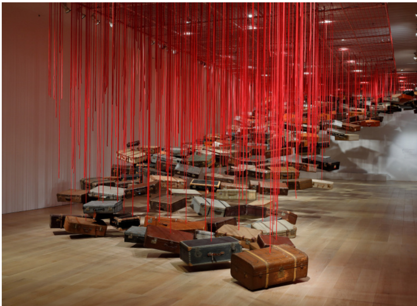
Shiota Chiharu, Accumulation - Searching for the Destination , 2014/2019, Suitcase, motor and red rope. Dimensions variable, Installation view: Shiota Chiharu: The Soul Trembles , Mori Art Museum, Tokyo, 2019.