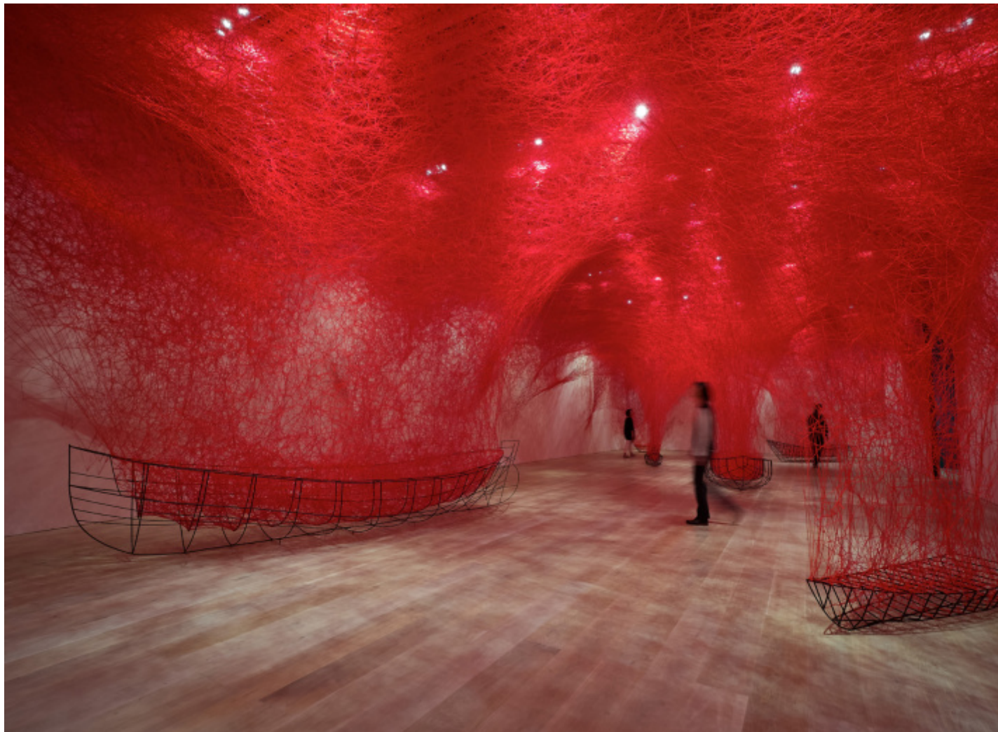
Shiota Chiharu, Uncertain Journey 2016/2019

Metal frame, red wool Dimensions variable Installation view: Shiota Chiharu: The Soul Trembles , Mori Art Museum, Tokyo, 2019