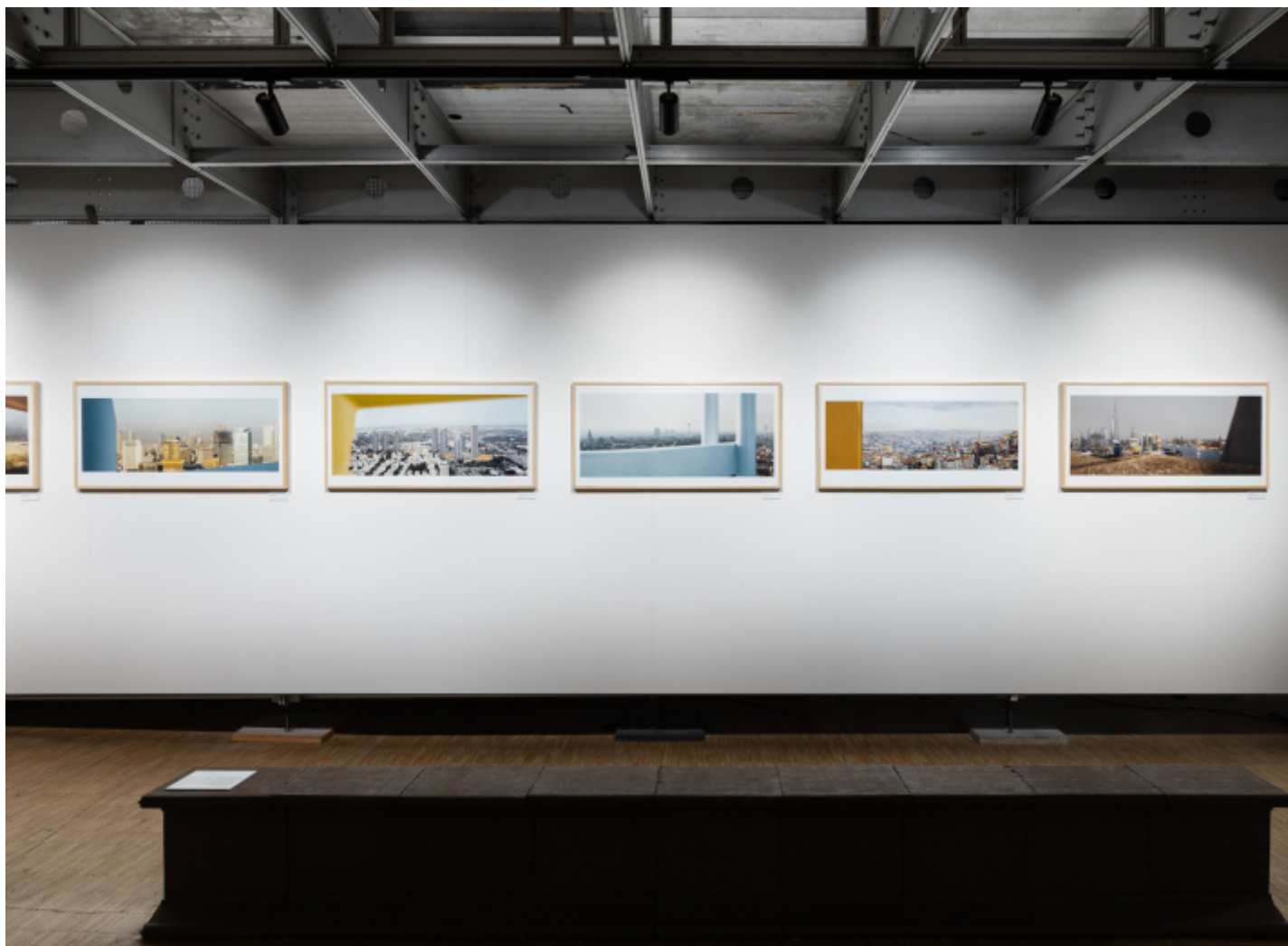
Installation view della mostra, foto Gianluca Di Ioia © Triennale Milano.

Però, come tutti i giochi, anche quello cui si dedica Rosselli ha le sue belle regole e i suoi perché. Lui non ha uno sguardo nostalgico, non vuole giudicare nulla (l'ironia con il suo tocco critico, distaccato e mordace, è ben lontana da lui), non riordina il caos cittadino anzi lo mima, lo moltiplica con giochi di riflessi (come nella serie Specchi, riflessi ) come se dovesse comprimere in una sola immagine un groviglio urbano fatto di strade, persone, auto, capannoni, negozi, luci, cartelli stradali, rumori e quant'altro. Invece di scattare immagini placide e ben composte, cercando di dare una forma armonica al caos, lo accetta come un elemento vitale, anzi lo insegue lasciando che la sua fotografia si dilati in ogni direzione, accogliendo intrusioni e intrusi, elementi casuali o divertiti. Per Rosselli la città è un conglomerato o una miscela di ingredienti interconnessi e spesso disordinati, eppure per certi versi attraenti, dotati di tratti molto umani. Lui è una sorta di flâneur che percorre le metropoli del mondo, le osserva, le ascolta, "le annusa", ne coglie il "clima" – come lui stesso ama definirlo.