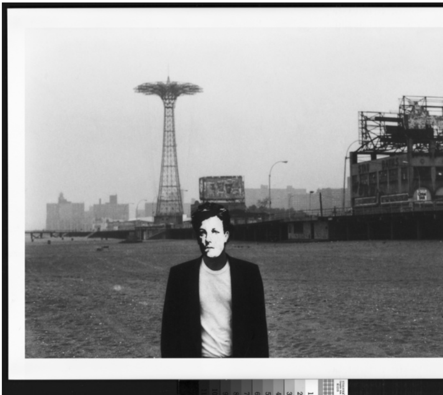
David Wojnarowicz, Arthur Rimbaud in New York (Coney Island), 1978-79, silver print.

David Wojnarowicz, artista queer e HIV+ morto nel 1992 di AIDS conclamata, documenta, in tutta la sua opera, gli spasmi di un'America sofferente e di una New York sventrata dalla crisi: fotografo, visual artist , performer e scrittore, Wojnarowicz è stato una delle figure di culto della scena artistica della Downtown Manhattan che ha raccontato nella sua fulgida parabola dagli inizi fino alla disgregazione causata anche e soprattutto da gentrificazione e crisi dell'AIDS.