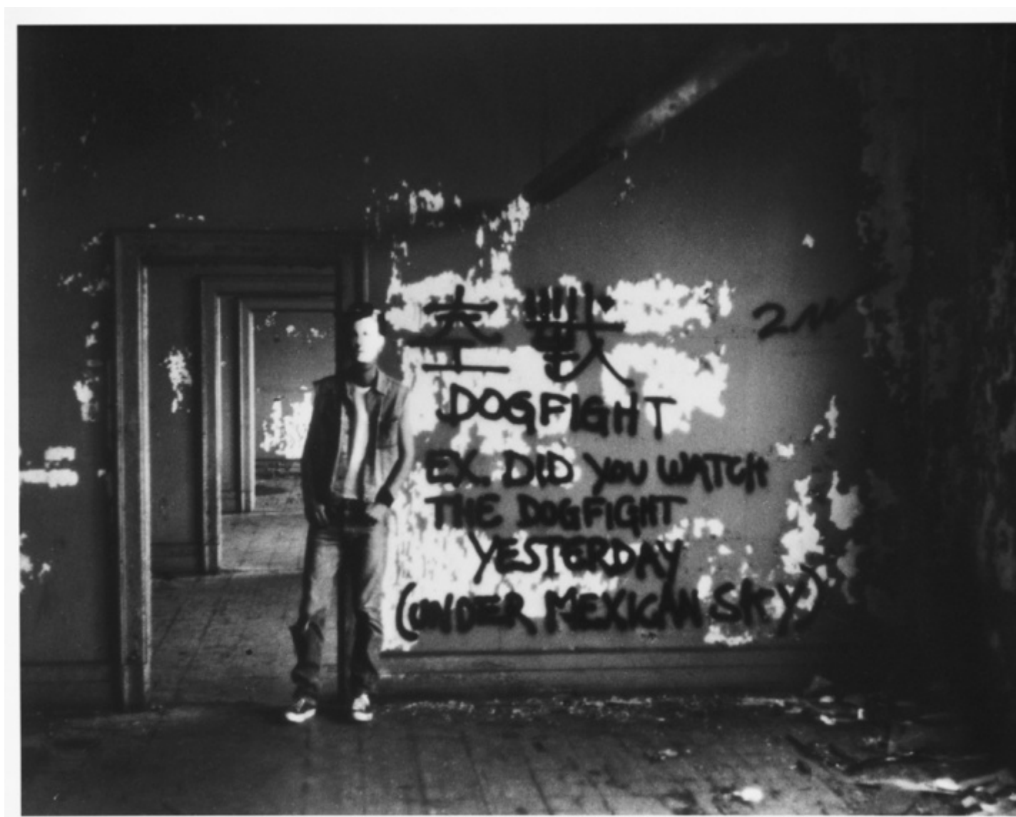
David Wojnarowicz, Arthur Rimbaud in New York (dogfight) , 1978-79, silver print.