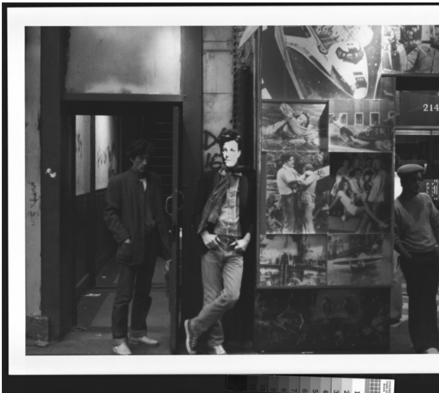
David Wojnarowicz, Arthur Rimbaud in New York (movie house) , 1978-79, silver print.

Il Rimbaud di Wojnarowicz si posiziona all'interno del contesto urbano che intende raccontare: non cerca assimilazione, non si muove con circospezione, ma occupa lo spazio, rivendica alterità e unicità con quella prospettiva apertamente queer che ha contribuito a rendere il lavoro di Wojnarowicz uno snodo fondamentale nella storia dell'arte queer americana (ma non solo). In tutta la sua opera l'artista parla infatti di visibilità del desiderio queer – termine che lui preferisce rispetto a un omonormativo "gay" per il portato politico e uncompromising che reca con sé – di rappresentazione, di salute sessuale e di violenza istituzionale, quella perpetrata anche e soprattutto a carico delle persone con HIV a cui per molto tempo è stato negato l'accesso alle informazioni essenziali in materia di salute e prevenzione, condannate a morte certa dal bigottismo e dall'inerzia delle istituzioni.