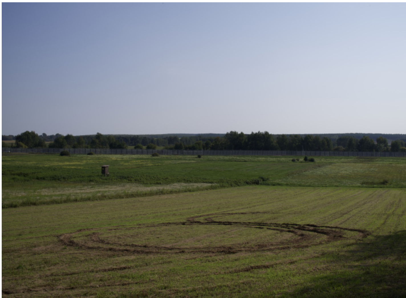
La barriera antimigranti voluta dal governo polacco, Ozierany Ma?e, recinzione di confine tra Polonia e Bielorussia

La strada è ora sterrata e stiamo percorrendo la frontiera attraverso la boscaglia e la vegetazione, lungo una stradina per trattori, o per mezzi corazzati. Procediamo lentissimi, a due all'ora, per non forare le gomme dell'auto, mentre Britney Spears intona Superstar dalle casse dello stereo. In questa lentezza assurda mi accorgo ad un certo punto di star guardando proprio dentro alla Bielorussia. Saremo a una distanza di duecento metri. Vedo dall'altra parte della barriera dei mezzi blindati color grigio chiaro e blu e lo faccio presente a Marcin che però nega l'evidenza sostenendo che sono "dei trattori di Luuukashenkooo" (con enfasi sul nome). Lo dice per prendere volutamente per i fondelli il dittatore bielorusso. Poi ferma la macchina, dicendo che non possiamo più proseguire oltre: le autorità polacche potrebbero fermarci a ogni momento. Mi metto allora a scattare qualche foto e a fare dei video. Percorro poi a piedi qualche decina di metri più a valle per avvicinarmi alla barriera ancora un po', pur standomene a debita distanza.