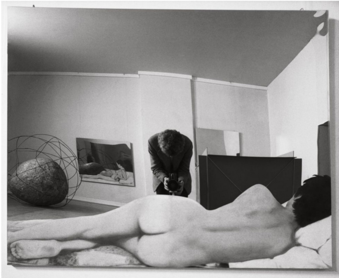
Ugo Mulas, Sala di Michelangelo Pistoletto, mostra Vitalità del negativo, Roma, 1970 (solo se c'è il consenso di Einaudi).

Interessanti anche le osservazioni che vanno sotto il titolo di “figurale” sulla funzione che la scrittura può assumere diventando immagine come nel caso della trasposizione grafica del 1964 da parte del designer Robert Massin del pezzo teatrale di Eugène Ionesco, La cantatrice calva , che trasfigura le lettere del testo interpretando visivamente lo scontro tra i personaggi fino a invadere con caratteri cubitali le pagine finali del libro-spettacolo (vedi anche l'articolo della stessa scrittrice qui ).