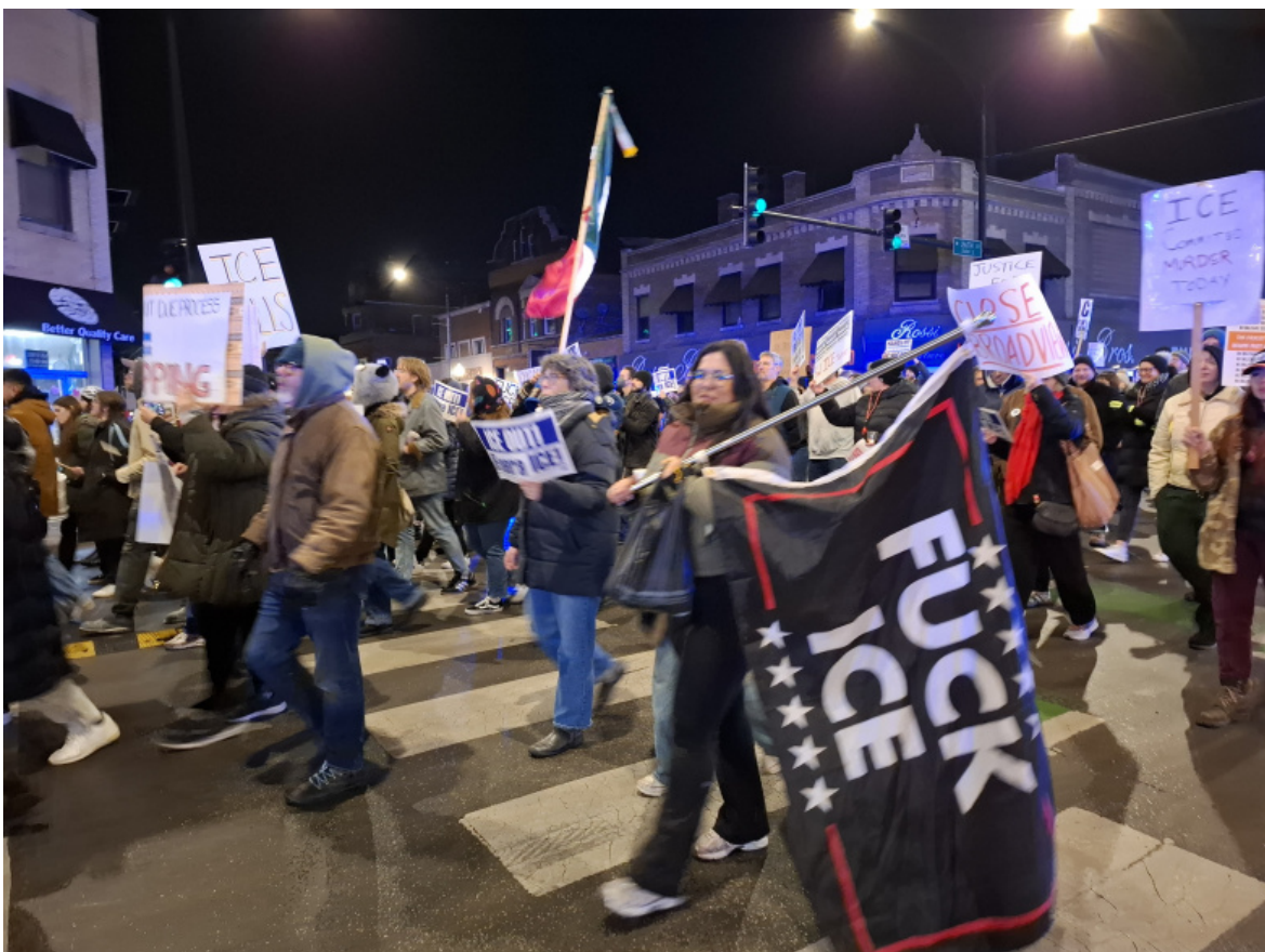
Manifestazione anti-Ice, Little Village, Chicago, gennaio 2026.

La separazione delle famiglie e il dislocamento dei minori getta un'ombra lugubre sotto il sole accecante di Texas e Arizona. Secondo una stima, fra il 2018 e il 2019, durante la politica "Zero Tolerance" della prima amministrazione Trump, sono stati separati dai genitori 5500 bambini e per 2000 di loro si sono perse le tracce. Ora le famiglie vengono divise non solo appena varcano il confine, ma anche nelle città in cui da anni fanno parte integrante del tessuto urbano. Nei primi dodici mesi del secondo mandato di Trump il numero di minori in custodia dell'Ice, inclusi neonati, è sestuplicato. Attualmente le persone detenute in attesa di rimpatrio forzato sono 70.000. Secondo attivisti e avvocati, le condizioni igienico-sanitarie nei centri detentivi sovraffollati sono "mostruose".