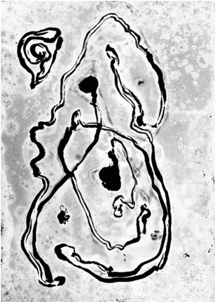
Nino Migliori, Pirogramma #7, 1948.

MZ: La tua estetica ha sempre accolto il caso e l'azione della materia fotografica non controllata come elementi co-autoriali. In un mondo che ora insegue la perfezione fake del filtro e del fotoritocco algoritmico, quale valore politico e poetico attribuisce oggi all'errore fotografico?