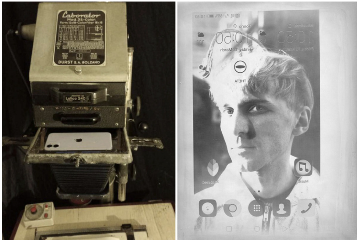
EXPOSED Torino Photo Festival - Extra. Turi Rapisarda-Edoardo Salviato, Pixel on Silverprint , 2021- in progress, stampa ai sali d'argento con smartphone e ingranditore Durst Laborator Mod. 3S - color.

alla fotografia (mi riferisco a una sua veduta del lago d'Orta presente nella collezione Fantini). Possiamo attribuire a questa “ribellione” chimica allo sfruttamento capitalistico delle risorse un’affinità con i comportamenti anticonsumistici e anticapitalistici della comunità Mutoid Waste Company. Allemandi aggiunge: “Rapisarda aveva stampato delle immagini dedicate ai Mutoid anche con chimici che contenevano ciò che lui definisce ‘il virus’: un elemento di disturbo in grado di alterare, se non del tutto vanificare, le operazioni di sviluppo e fissaggio”.