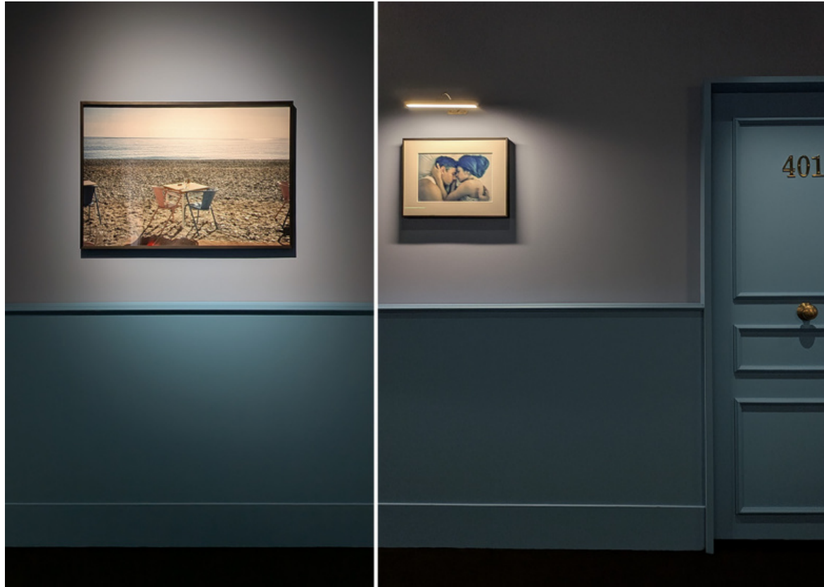
EXPOSED Torino Photo Festival – Replaced. Diana Markosian, dalla serie Replaced , 2026.

l'opera di Leckey. Frammenti estratti da fotografie di backstage, still dal video O Magic Power of Bleakness (2019) e immagini IA evocano un mondo oscuro, infernale, onirico e al tempo stesso sovranaturale e profetico. Catabasis è un'opera significativa rispetto a ciò che sta maturando nel contesto dell'aggregazione giovanile. L'artista britannico porta l'attenzione sull'insorgere irrazionale e visionario di una nuova sensibilità.