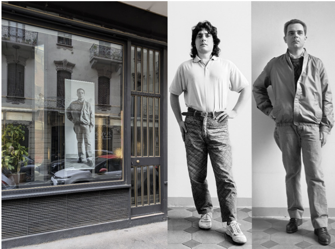
EXPOSED Torino Photo Festival - Extra. Turi Rapisarda, Atto dovuto , Ottofinestre, installation view / Turi Rapisarda, Sei dei Mille , 1992, stampa digitale (2025).

La mostra Atto dovuto di Turi Rapisarda, inserita nel circuito Extra di EXPOSED Torino Photo Festival (a cura di Carola Allemandi - Ottofinestre, dal 15 aprile al 20 maggio 2026), entra nel merito del tema proposto con tre serie fotografiche: Sei dei Mille (1992), Mutoid (1994-1995) e Pixel on Silverprint , iniziata nel 2021.