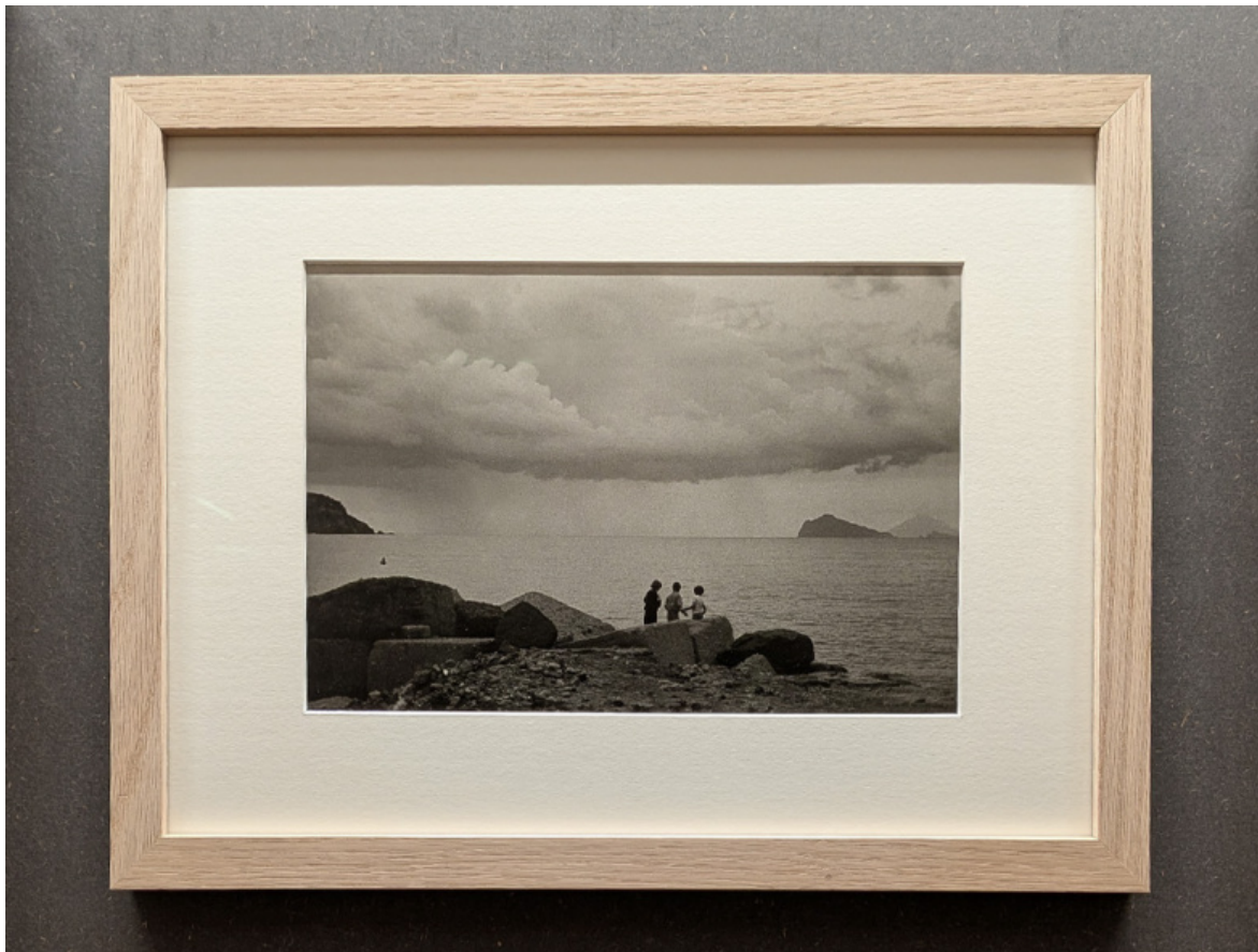
EXPOSED Torino Photo Festival - Dopo l'estate. Bernard Plossu, Lipari, 1988.

Sempre nel raggio del cosiddetto "miglio della fotografia", al Circolo del Design si può visitare Back in Ibiza e altre storie del fotografo inglese Dean Chalkley (a cura di Walter Guadagnini). Sono esposte tre serie fotografiche, la prima è dedicata alla scena musicale britannica dagli anni Novanta a oggi, con ritratti di Amy Winehouse, Oasis, The White Stripes. La seconda serie, Never Turn Back , è un reportage sul viaggio di un gruppo di ragazzi lungo le coste di Norfolk, e la terza, Back in Ibiza , racconta l'euforia e l'eccesso dell'isola.