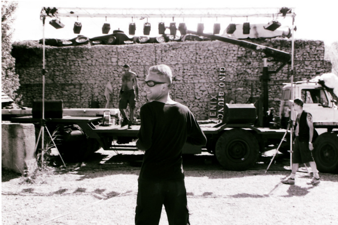
EXPOSED Torino Photo Festival - Extra. Turi Rapisarda, dalla serie Mutoid , 1994-95, stampe ai sali d'argento.

bidimensionalità [inoltre] le stampe dei Sei dei Mille , sono sospese a dei profili a U di ferro. La carta, che non segue mai perfettamente la linea del ferro, sollevandosi e curvandosi fa della fotografia una scultura soggetta ai moti imprevedibili del suo stesso materiale". Per questa ragione alla curatrice "piace pensare a queste immagini come a dei monumenti dotati di una loro fragilità e discontinuità".