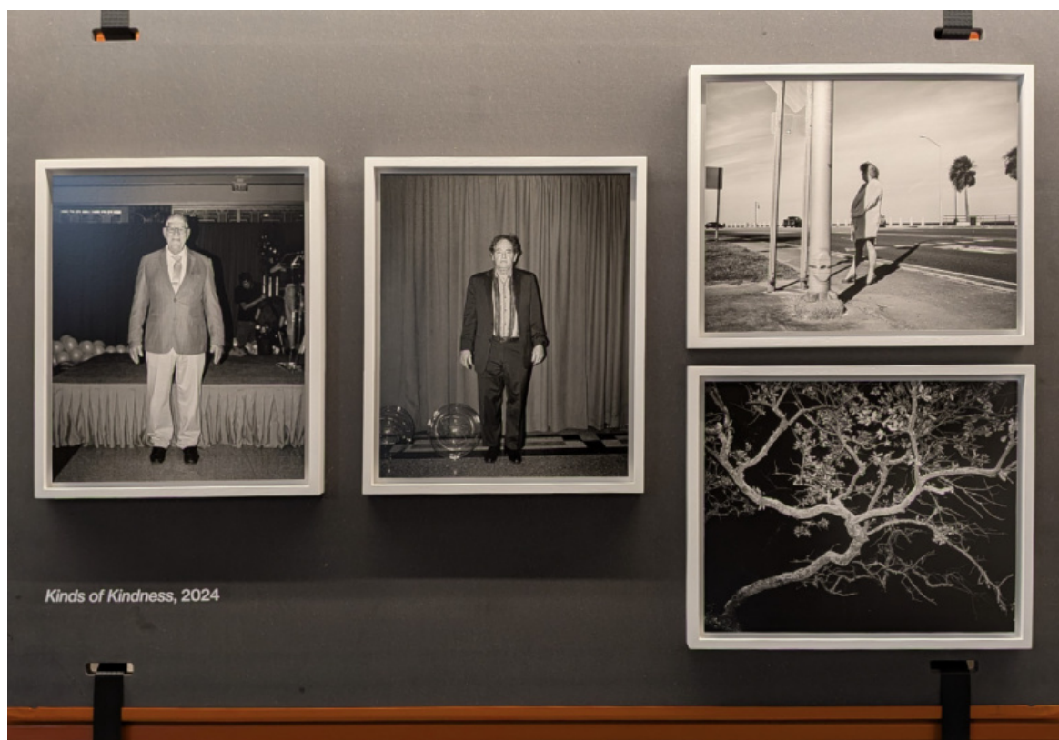
EXPOSED Torino Photo Festival. Yorgos Lanthimos, Photographs , 2024. Dal set di Kinds of Kindness e dal contesto, che include anche il paesaggio circostante.

questa sua condizione transitoria può essere modificata da eventi che avvengono nel presente. Saksida ha condotto degli esperimenti a Cambridge su pazienti che avevano subito dei traumi trasformando la loro memoria “solida”.