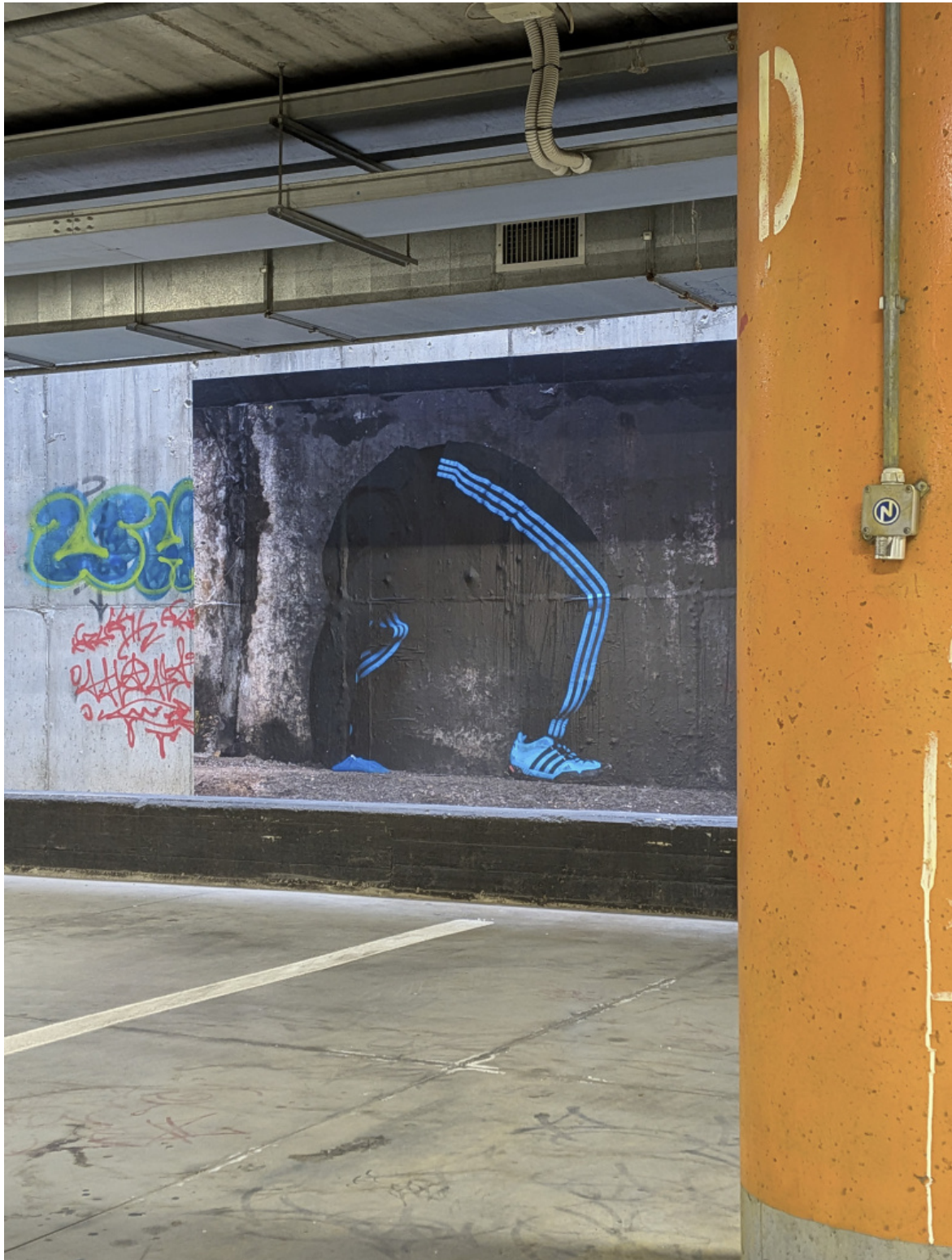
EXPOSED Torino Photo Festival - Catabasis. Mark Leckey, O Magic Power of Bleakness (film still), 2019. Courtesy Mark Leckey.

Questa permeabilità tra mostre indoor ed outdoor invita il visitatore ad un'esplorazione della città, anche nei suoi aspetti più nascosti e marginali. A questo riguardo l'intervento site-specific Catabasis di Mike Leckey è certamente uno dei più suggestivi (a cura di Cripta747 e Caterina Avataneo). I wallpapers incollati alle pareti del parcheggio sotterraneo GTT Valdo Fusi si inseriscono nella penombra della struttura architettonica segnata da graffiti che interagiscono con