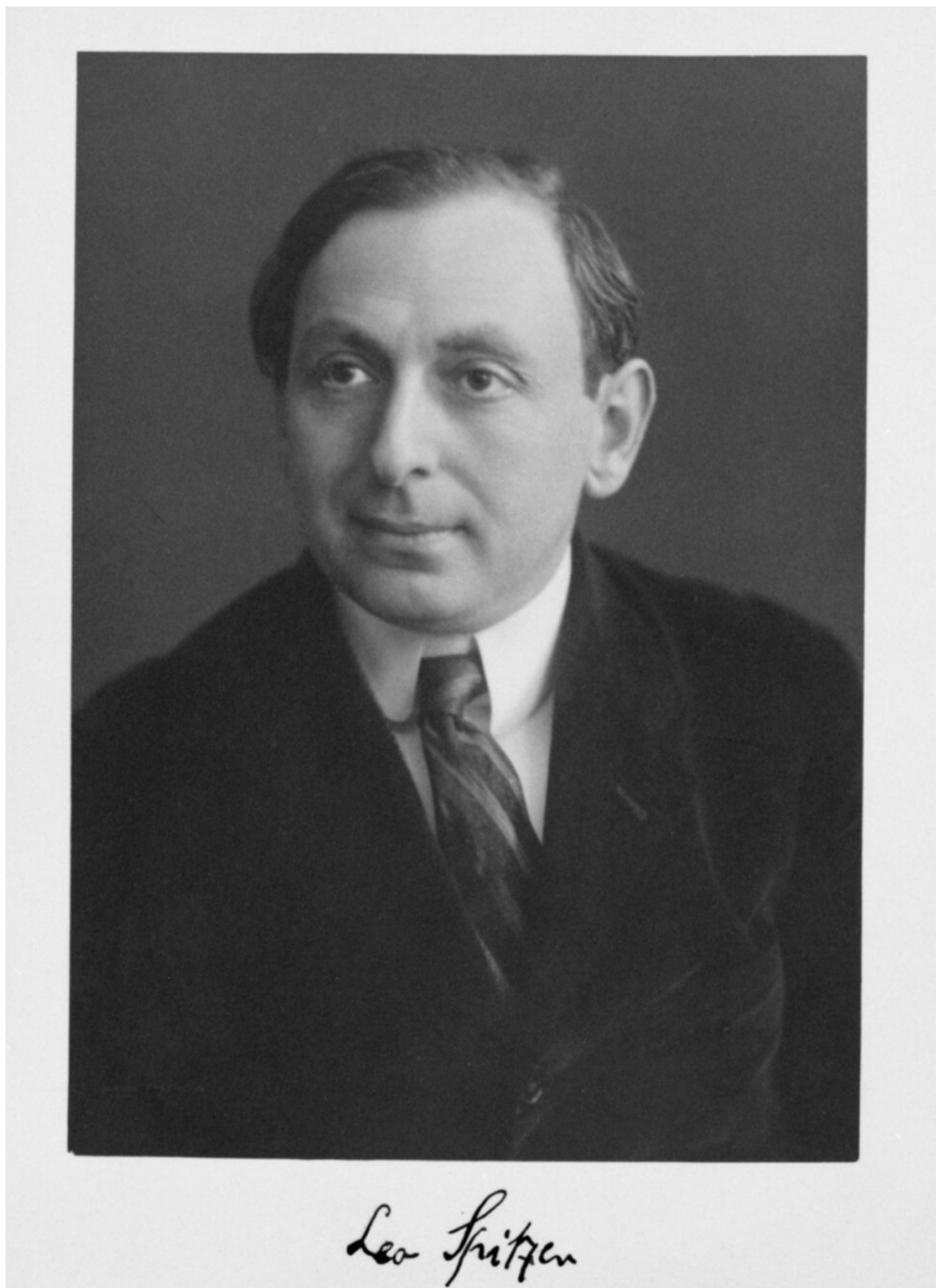
Leo Spitzer

Ma lo scarto dalla norma (Abweichung) non si realizza solo nelle opere di letterati. Poeta è anche il popolo, poeta è anche la madre di un bambino piccolo, quando, ad esempio, respingendo il limite dell'univocità del nome proprio, inventa per il suo figlioletto un'infinità di vezzeggiativi, ripetendo in ambito domestico un rito primordiale: quello di chi tenta di appropriarsi di ciò che fugge (o che muta) con lo