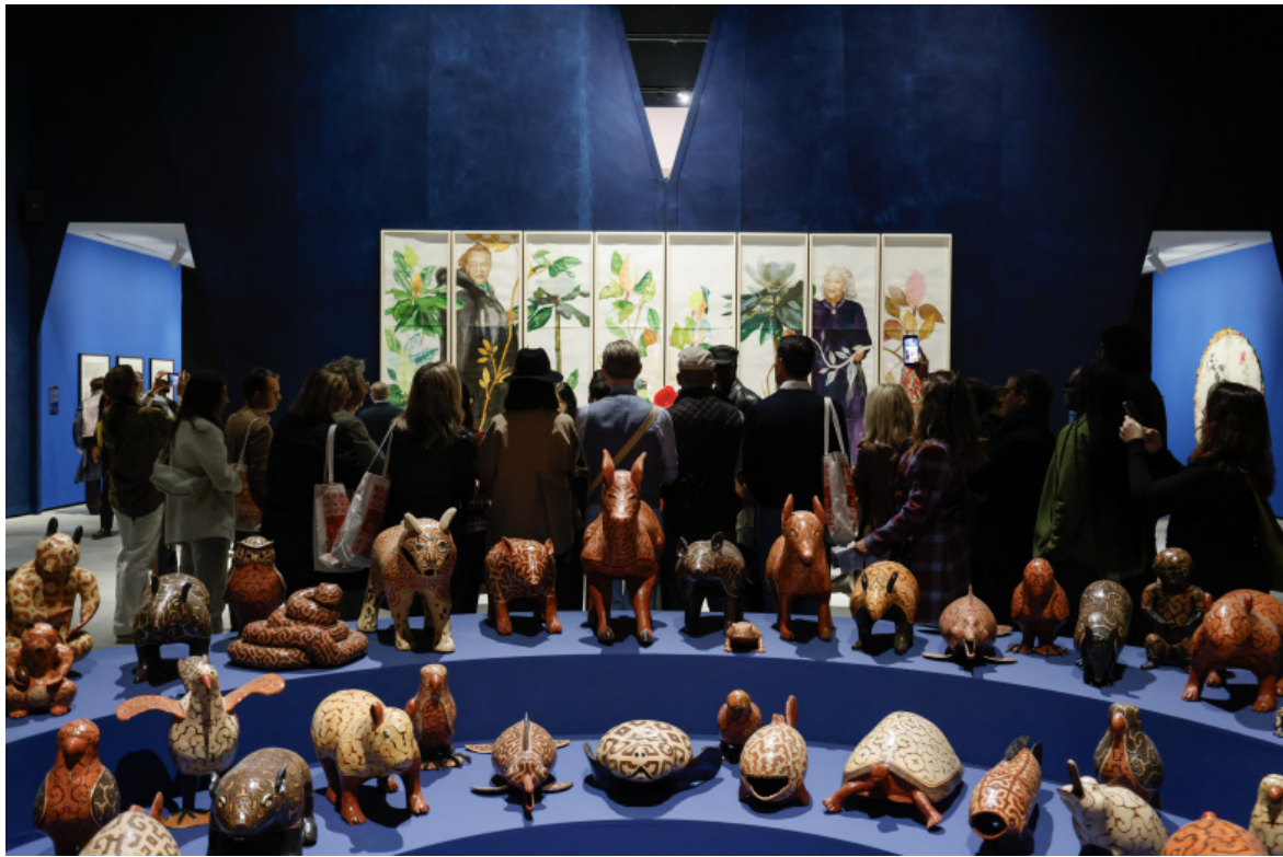
Installation view © Foto di Jacopo Salvi.

codificato con le sue convenzioni, i suoi stilemi ricorrenti, la sua liturgia e resta un senso di esotico nell'oggetto indigeno collocato su un piedistallo che la volontà dei curatori non basta a neutralizzare.