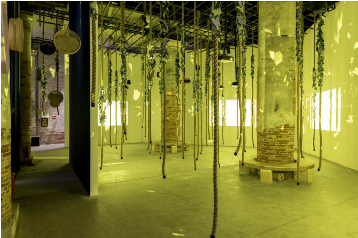
Kader Attia, Whisper of Traces , 2026.

Con Whisper of Traces (2026), Kader Attia realizza un'installazione multimediale che intreccia statue rituali africane, erbe essiccate, grosse corde verticali ricoperte di frammenti di specchio e video. Il punto di partenza è il discorso di uno sciamano per il quale la tecnologia digitale è piena di "entità spirituali". L'opera ci pone di fronte a un interrogativo: "se decidiamo di ascoltare questo sciamano e di seguire ipoteticamente i suoi ragionamenti, quali possibilità ci si aprono per quanto riguarda il pensiero e la creazione?" Una stimolazione a utilizzare criticamente credenze ancestrali per pensare e sentire in modo diverso, magari riconoscendo il dàimon nelle tecnologie digitali, una forza demoniaca ma non per forza malvagia.