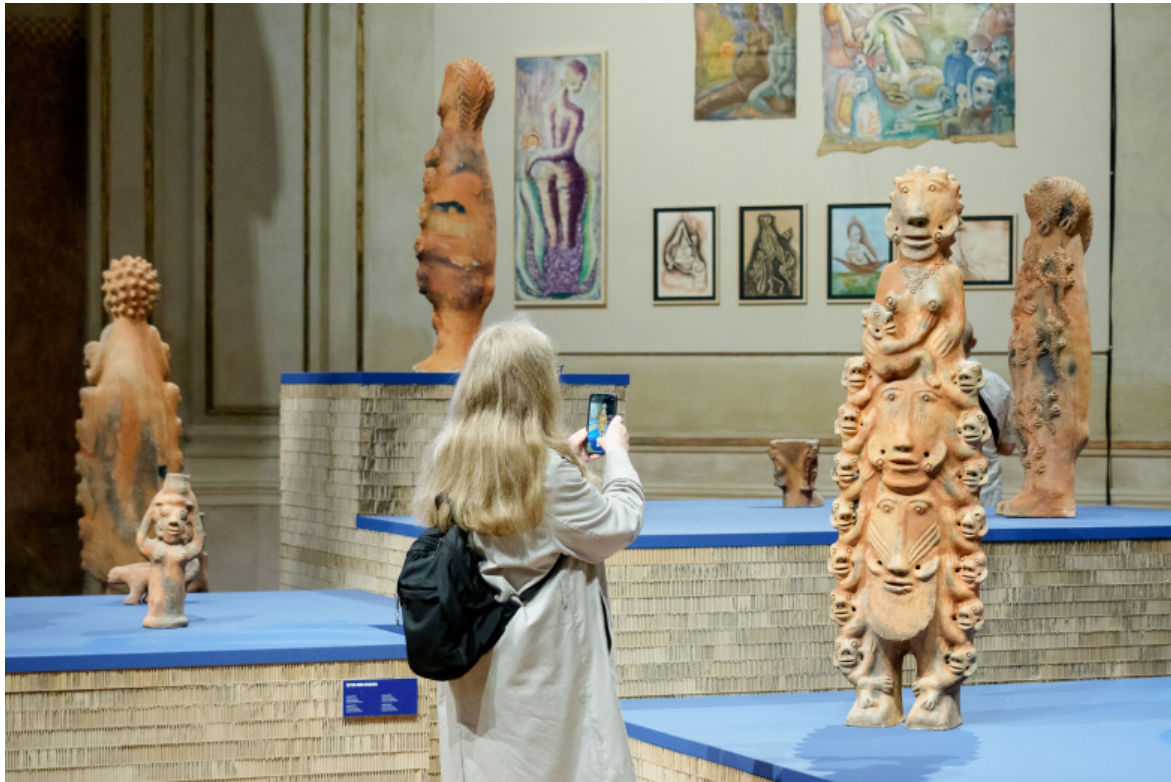
Installation view © Foto di Andrea Avezù.

Le superfici di argilla, le texture dei tessuti, le cuciture a mano. I toni pastello e le musiche morbide, le installazioni sonore che invitano a rallentare il passo. Esperienze sensoriali olfattive. I dipinti naïf che attingono al folklore e alla tradizione orale. I riferimenti agli antenati attraverso voci, sospiri, richiami. Le figure tra il mitico e il surrealista. I lavori sulla vita agricola, la schiavitù, la diaspora, il colonialismo e le sue tracce materiali. I giardini come metafora di resistenza e sopravvivenza. Le radici, i fossili, la terra. Tutto questo è presente in abbondanza. E tutto questo era già presente alla Biennale di due e di quattro anni fa.