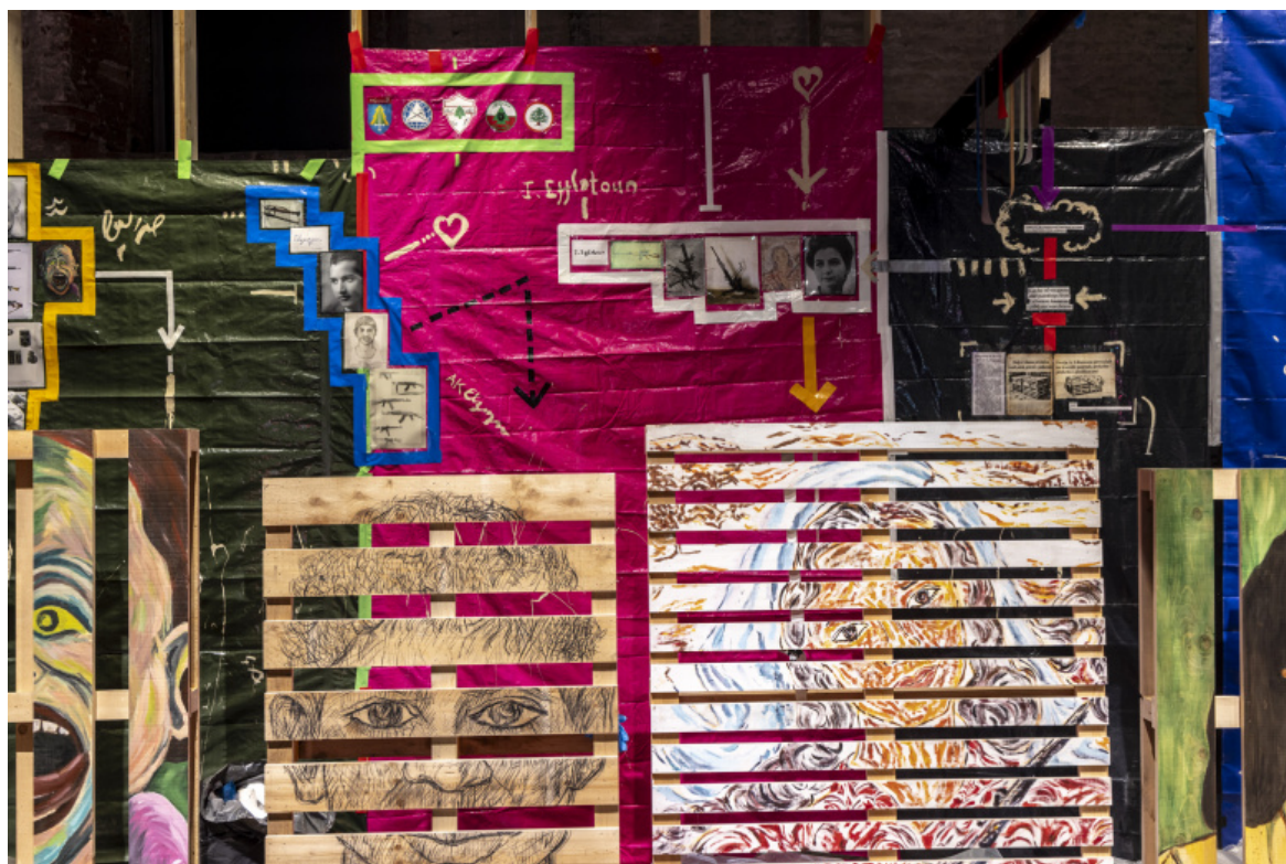
Walid Raad, Postscript to the Arabic Edition, 1938-2025 .

Walid Raad lavora sul limite tra documento e finzione, tra la storia e la sua ricostruzione. Ci interroga su cosa accade quando una guerra finisce e in che modo il trauma che ne origina condiziona individui, società e pratiche artistiche. Raad porta all'Arsenale l'installazione Postscript to the Arabic Edition, 1938-2025 : "Una Guerra finisce, un'altra comincia. Le armi si mossero da un campo di battaglia all'altro. Questa volta, tuttavia, qualcos'altro viaggiò insieme a loro." Infatti, sui pallet usati per trasportare armi dalla guerra civile libanese verso i Balcani qualcuno scopre la presenza di immagini. Sono copie di celebri dipinti turchi e arabi. L'allestimento replica la disposizione del deposito in cui è avvenuto il ritrovamento.