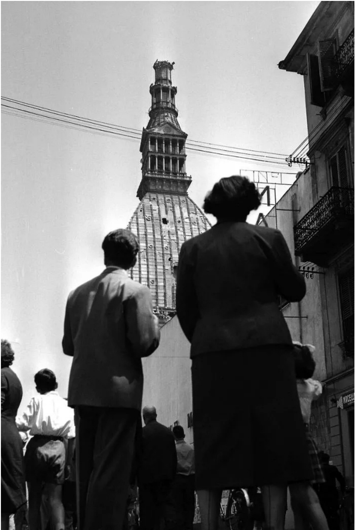
La Mole all'indomani del nubifragio.

In quegli anni, durante le vacanze, trascorrevo intere giornate solitarie nelle sale dei musei a Genova: ricordo che una volta fui riconsegnato ai genitori che