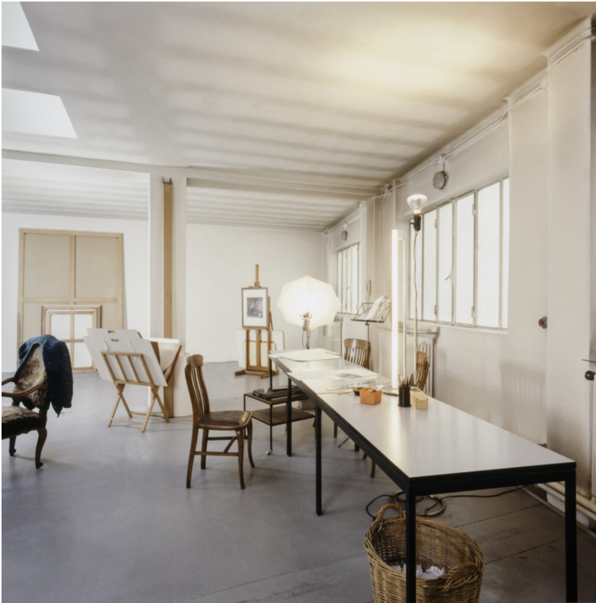
Lo studio di Via Po 32, Foto Paolo Mussat Sartor.

Tra le pareti del mio studio di Via Po posso contare sugli strumenti di lavoro più fedeli (matite, squadre, compassi...). Lì riesco a fingere di esistere, a mettere ordine tra le mie carte: in verità, mettere in scena un finto e calcolato disordine per farmi credere di essere all'opera.