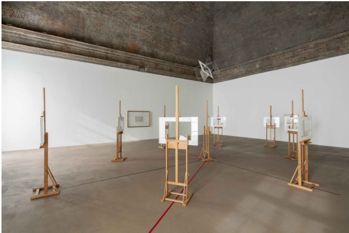
Le Chef-d'œuvre inconnu 2020, Foto Agostino Osio.

Chi interroga questo enigmatico “oracolo” – il titolo evoca il santuario della Grecia classica in cui aveva sede il famoso oracolo delfico di Apollo – non riceve alcun responso. Di fronte alle aspettative dello osservatore, l’autore incrocia le braccia: non ha nessuna verità da dichiarare. Anzi: sembra assumere egli stesso la parte di chi attende una risposta. Invece di esercitare l’“arte della divinazione”, l’autore-oracolo formula una domanda sul rapporto stesso che intercorre tra lo spettatore e il quadro, o tra il quadro e l’autore. Non mette in gioco il passato né il futuro, né il mondo né tanto meno il proprio io: all’espressione e alla comunicazione, preferisce il silenzio dei quesiti senza risposta, la riflessione sull’esserci e non esserci rispetto a se stesso, alla sua opera e allo spettatore. Riflettendoci ora, mi accorgo come debba dichiararmi qui debitore di queste riflessioni all’amico filosofo Gianni Vattimo, mio prezioso interlocutore per tante stagioni passate.