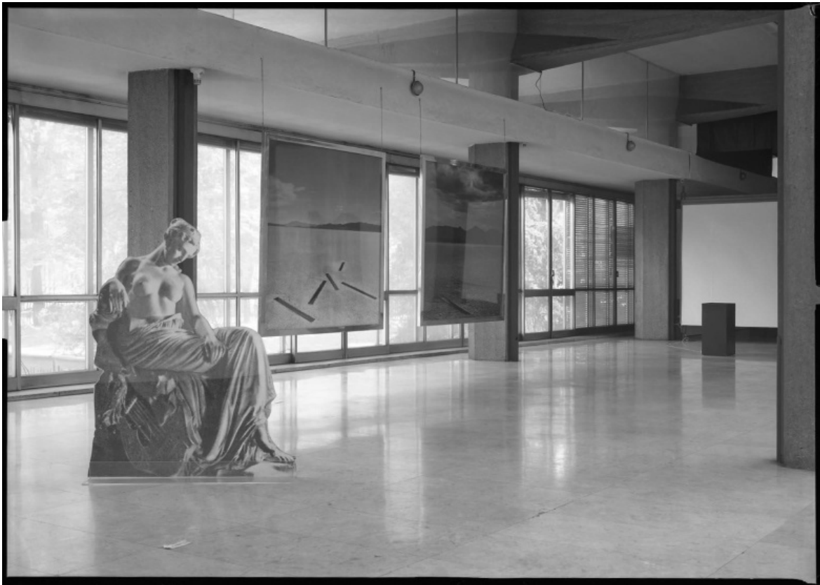
Torino GAM, 1970