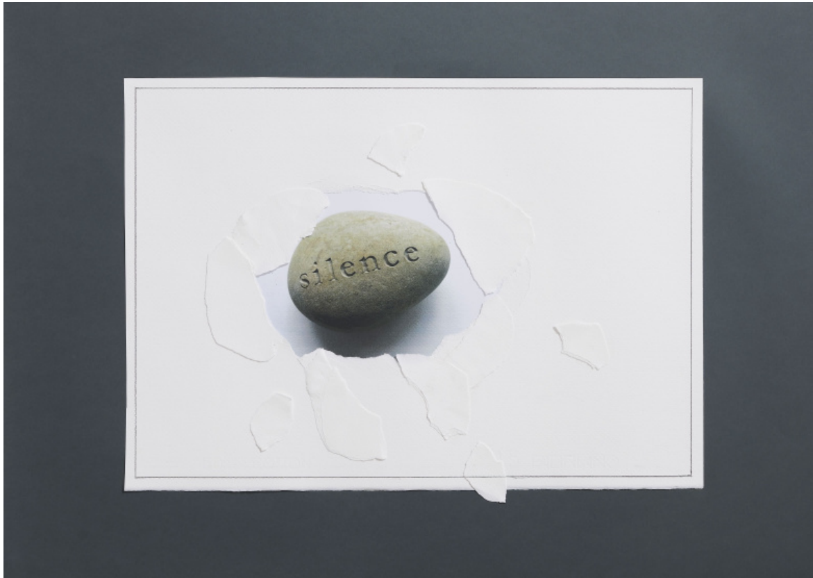
Silence 2025, Foto Luca Vianello.

Dunque, in conclusione, cos'altro aggiungere: col tempo ho preso distanza da me stesso, tanto da potermi osservare da fuori.