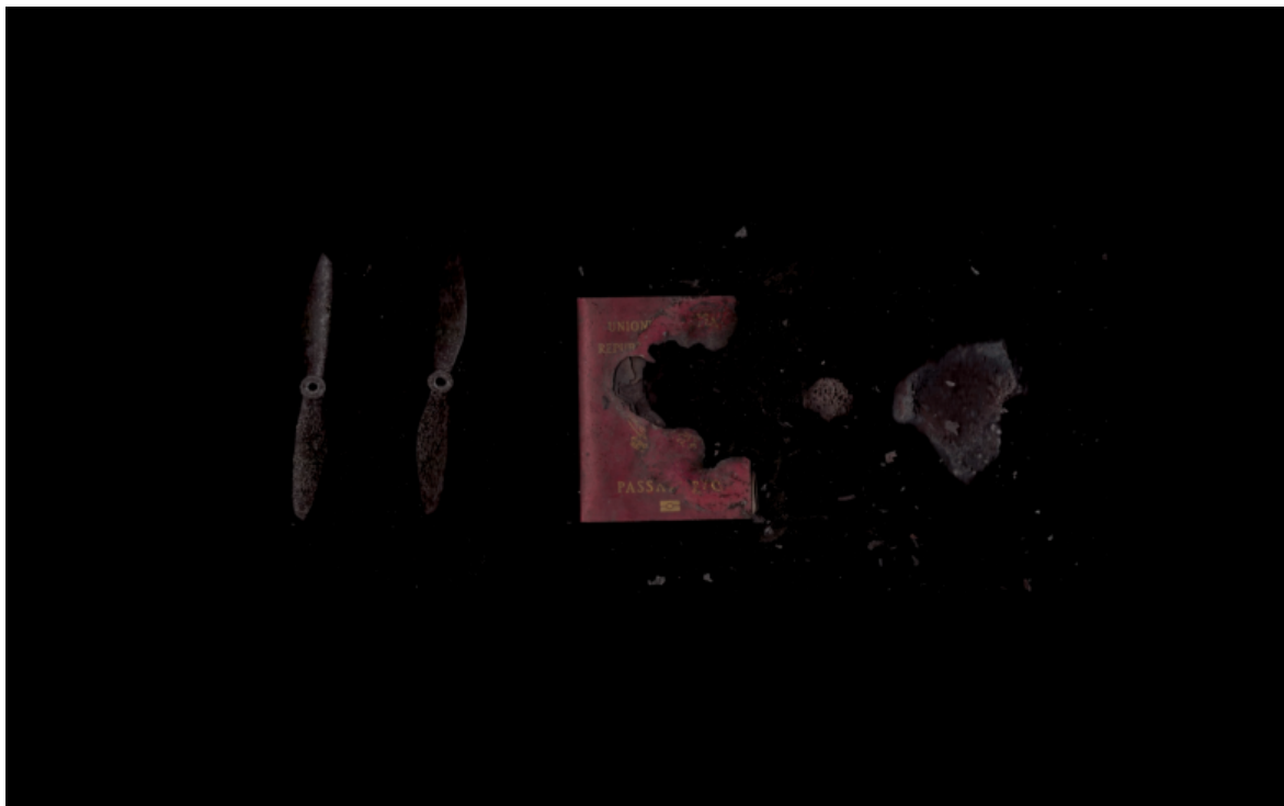
C. Cogitore, Ferdinandea: Uncertainties (2022).

E ciò che Leoni sottolinea, tramite il prisma artistico di Cogitore, è che di fronte a questi eventi, a questa dimensione insignificante - «[l'evento] è insignificante [...], in quanto accade, è in quella sequenza ma non segue proprio niente, e non è seguito da niente» (p. 10) - è proprio il sapere che l'umano erge a strumento per proteggersi dall'enigmaticità, dall'indecifrabilità e dalla potenziale irruenza con cui l'evento si dà nella nostra esperienza.