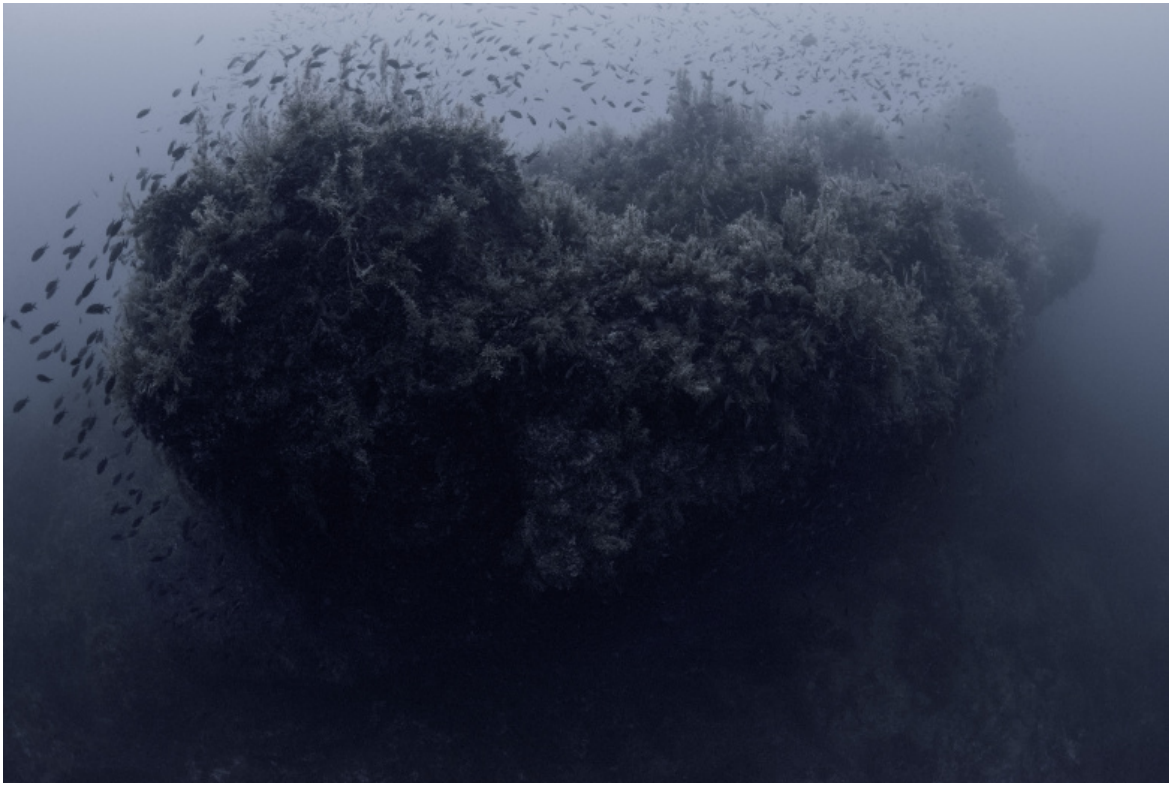
©C. Cogitore, Ferdinanda: Aviamu addivintatu un populu r'insonni (2022).