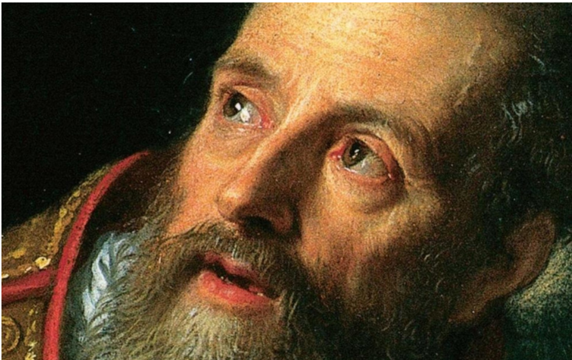
Agostino di Ippona.