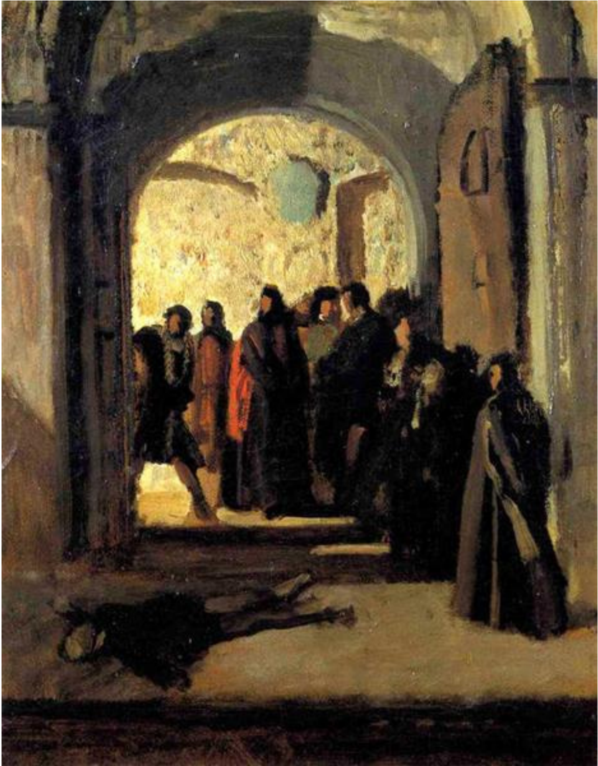
Lorenzino De Medici, Cristiano Banti, 1855

l'erostratismo. (Erostrato incendiò il tempio di Artemide a Efeso, la notte in cui nacque Alessandro Magno e, a chi gli chiese il perché, rispose che voleva semplicemente rendersi famoso in questo modo). Non sapremo mai come stavano effettivamente le cose. Però possiamo dare ascolto, tramite l' Apologia , alla voce dello stesso Lorenzino. Il testo, scritto già un mese dopo l'omicidio, circolò ampiamente manoscritto, benché venisse stampato in effetti solo nel 1723.