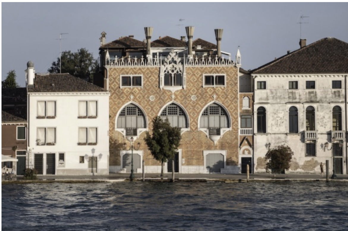
Tre Oci © Massimo Pistoletto. Courtesy of Casa dei Tre Oci - Berggruen Institute Europe.

Le opere agiscono come strumenti documentari: programmano assetti del sapere. L'archivio seleziona, ordina e riattiva sempre il linguaggio, rimodellandolo in struttura processuale.