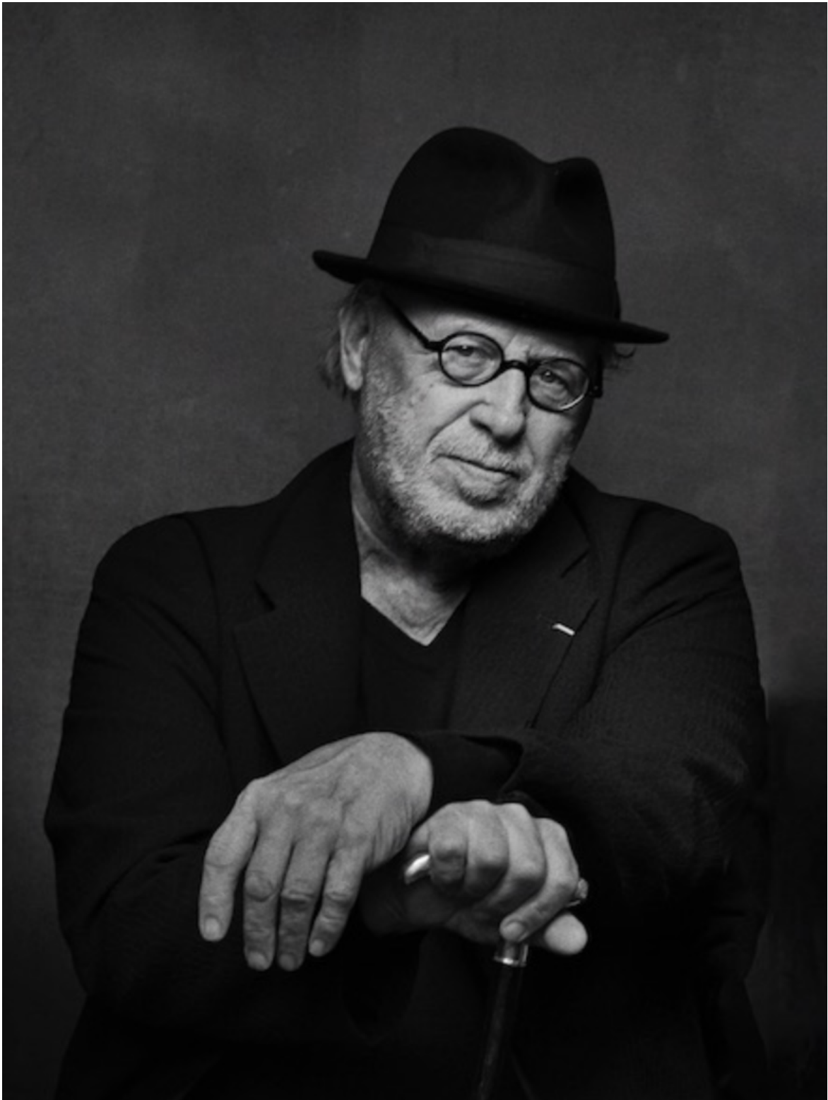
Joseph Kosuth.

Nel confronto con altri artisti, la posizione di Kosuth si corrobora per divergenza funzionale. Marcel Broodthaers teatralizza il museo come finzione critica, Lawrence Weiner riduce l'opera alla forma della messa in parola, Daniel Buren analizza le premesse di visibilità del contesto. Kosuth incorpora l'istituzione come logica immanente del linguaggio e la traduce in assemblaggio operante del significato.