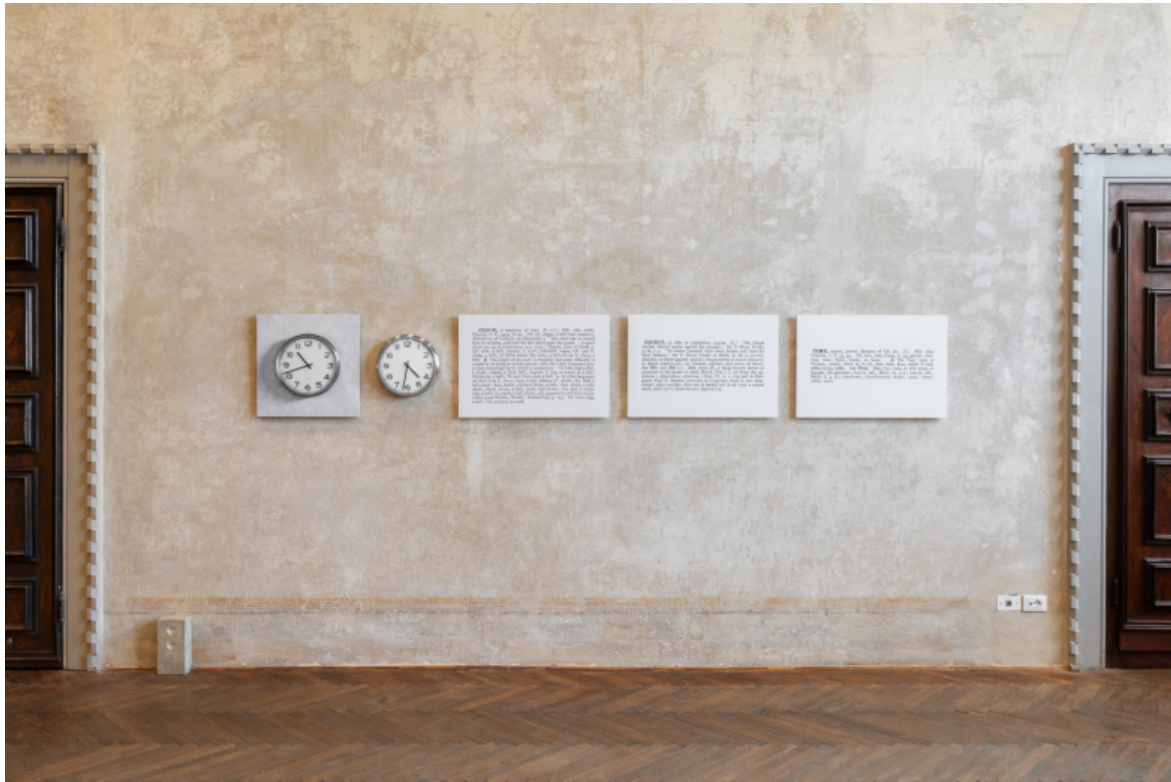
Clock (One and Five), Tre Oci, Marco Cappelletti.

La luce che attraversa le finestre, il riflesso dell'acqua e la variazione continua del campo visivo impediscono ogni fissazione stabile della concezione, producendo un'esperienza frammentata che modifica direttamente il modo in cui il senso si forma.