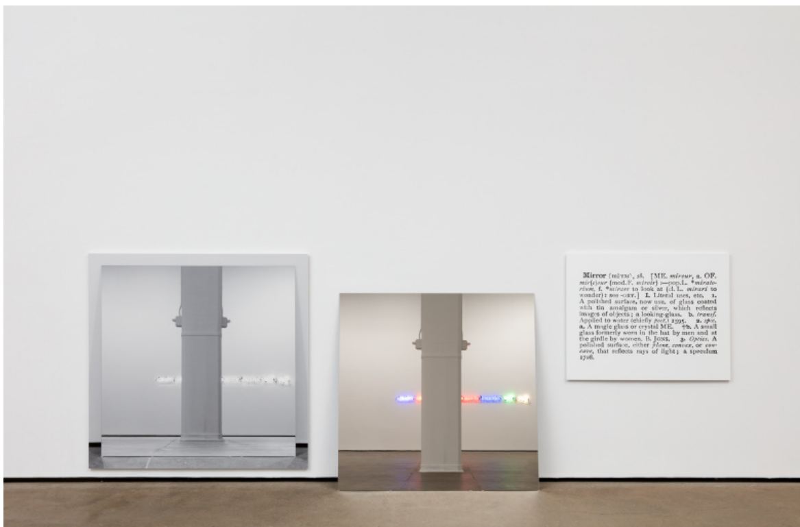
Joseph Kosuth, 'One and Three Mirrors' [Eng.] 1965, Two mounted photographs and mirror, dimensions variable.

Questa alterazione consegue una natura parallelamente artistica ed epistemologica: implica il superamento dell'idea di opera come entità autonoma e il suo riesame come supporto di interrogazione dei presupposti del conoscibile. L'arte produce variabili di leggibilità del mondo.