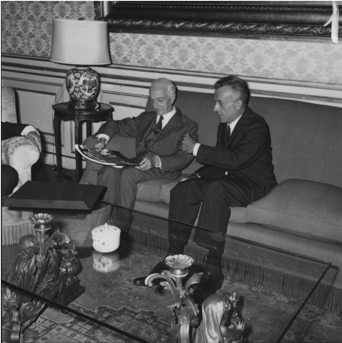
Lo scrittore Carlo Emilio Gadda e Giulio Einaudi in visita di omaggio al Presidente della Repubblica Antonio Segni per fare dono del libro: La cognizione del dolore