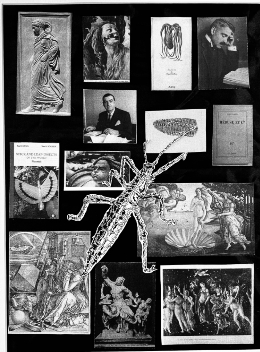
Tommaso Lisa "Atlante Fasmide" (collage 2015).

Senza contare il contorno della collezione: scatole, mobili e arredamento, opere di ebanisteria o forniture specifiche per determinati settori di ricerca realizzate su commissione o dall'entomologo stesso. Si creano complesse installazioni in cui, intorno agli insetti, stratificano libri, rappresentazioni grafiche, e strumenti come pinze, spilli, microscopi, lenti, retini, vagli, flaconi, cassette. Dispositivi di cattura scelti con attenzione tra le svariate marche disponibili. L'insetto viene osservato, poi rappresentato e messo infine in mostra nella rappresentazione che è anche la sua celebrazione. Per traslato la natura diventa metafora di sé stessa nel cabinet