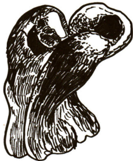
SCHIENA FORZUTA DEL PEPERONE

Infatti, presa ormai questa strada Dadaista, per quanto Weston la rifuggisse, giocherei con la foto "Water" del 1925 che più di tutte sembra rimandare ai